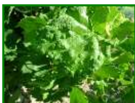
Eriosis (raza de las agallas)

No se observa presencia de eriosis en las parcelas muestreadas. Los síntomas que suelen observarse generalmente corresponden a la raza de las agallas , que no suele dar problemas en plantaciones adultas.