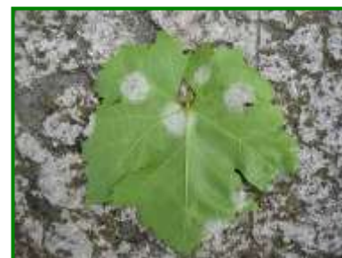
Síntomas de Mildiu

Ya que el daño de las infecciones secundarias es el más importante, conviene controlar desde el principio las primeras infecciones, para evitar que se extienda la enfermedad. Por ello, para planificar una correcta protección del cultivo es fundamental la detección de las primeras manchas, e informar de ello con la mayor celeridad posible, para que los viticultores puedan tomar las medidas oportunas, en caso de ser necesario.