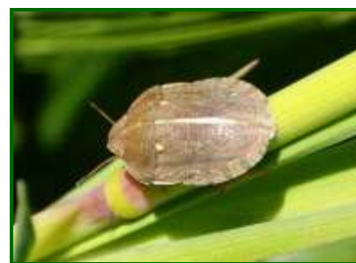
Adulto de paulillón

Por otra parte, se detecta la presencia de paulilla en el 97 % de las 35 parcelas muestreadas, con una media provincial de 1,11 adultos+ninfas/m 2 . Todas las zonas biológicas rondan una media de 1 adulto+ninfa/m 2 .