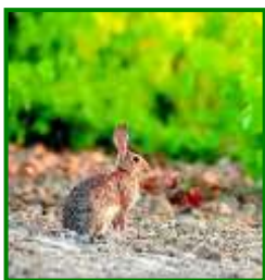
Conejo en viñedo

No se han observado daños de conejos en las estaciones de control muestreadas esta semana.