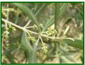
Estado fenológico "D1"

Para la semana del 14 al 20 de abril de 2025, la Agencia Estatal de Meteorología (AEMET) prevé en Córdoba cielos mayormente despejados al inicio, con temperaturas máximas que podrían alcanzar los 30°C el martes 15. A partir del miércoles, se espera un ligero descenso de temperaturas, con máximas alrededor de 26°C y aumento de la nubosidad. El jueves podrían registrarse chubascos. El viernes y sábado serán parcialmente nublados, con temperaturas de hasta 24°C. El domingo hay mayor probabilidad de lluvias, con máximas de 24°C. Los vientos serán suaves, predominando del oeste y suroeste al inicio de la semana y cambiando al noreste y este en los días siguientes.