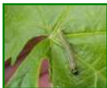
Larva de Piral

No se observan esta semana daños producidos por este agente.