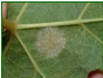
Mildiu en hoja

Se han realizado tratamientos fungicidas para prevenir la entrada de este hongo en algunas parcelas.