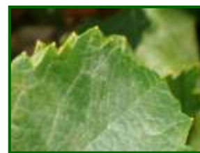
Oidio en hoja

A veces los comienzos del ataque suelen manifestarse con manchas aceitosas con puntaduras pardas. En los casos de ataque intenso de las hojas aparecen abarquilladas y recubiertas de polvillo por el haz y el envés. En brotes y sarmientos, los síntomas se manifiestan por manchas difusas de color verde oscuro, que van creciendo, definiéndose y pasando a tonos achocolatados al avanzar la vegetación, y a negruzcos al endurecerse el brote. En racimos, al principio los granitos aparecen con un cierto tinte plumizo, recubriéndose en poco tiempo de polvillo ceniciento, que si se limpia deja ver puntitos pardos sobre el hollejo.