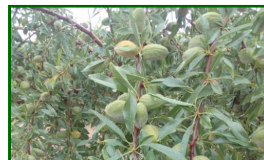
Estado fenológico "I" Fruto joven.

Periodo del jueves 17 de abril al miércoles 23 de abril : Las temperaturas medias han registrado valores en torno a los 14.8 °C , las máximas en torno a los 21.7 °C y las mínimas en torno a los 8.6 °C . En cuanto