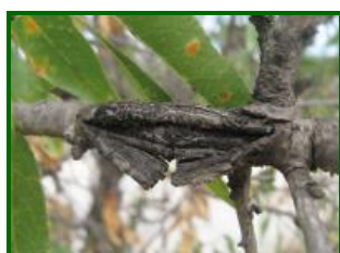
Daño en madera

Continúan detectándose síntomas en esta semana en todas las ECBs muestreadas, con un porcentaje de brotos afectados que ha pasado del 1 % al 1,75 % y máximos del 3 %. Si durante la floración se producen humedades relativas altas (por lluvias, rociadas, etc.) se está favoreciendo la aparición de esta enfermedad.