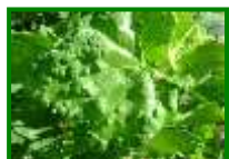
Erinosis (raza de las agallas)

No se observa presencia de erinosis en las parcelas muestreadas. Los síntomas que suelen observarse generalmente corresponden a la raza de las agallas , que no suele dar problemas en plantaciones adultas.