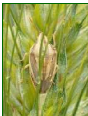
Adulto de paulilla

Baja la presencia de chinches del trigo en todas las estaciones de control biológico (ECB) de la provincia.