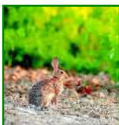
Conejo en viñedo

Se ha detectado presencia de roedores en el 36 % de las parcelas muestreadas (sobre 11 estaciones de control); registrándose una media provincial del 1,5 % de cepas afectadas; siendo Las Arenas la zona biológica más afectada por los conejos, con un 2,7 % de cepas afectadas.