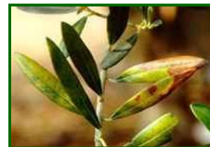
Hojas con síntomas

Biología del hongo y daños que produce: El hongo P. cladosporioides penetra en la hoja a través de los estomas y desarrolla su micelio en el interior del tejido foliar. Con el tiempo, provoca una decoloración característica en el envés de las hojas, con un tono grisáceo o plumizo debido a la esporulación del hongo. En el haz pueden aparecer manchas irregulares de color amarillo o marrón. La enfermedad causa debilitamiento del árbol debido a la pérdida prematura de hojas, lo que afecta la capacidad fotosintética y puede reducir la producción y calidad de la aceituna. En casos graves, también se han observado daños en los frutos, con manchas superficiales que afectan a su desarrollo.