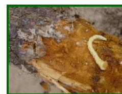
Larva de gusano cabezudo

Medidas culturales que ayudan a controlar a los pulgones: El abonado nitrogenado debe ser racional, y conviene eliminar los chupones; de esta forma evitamos tener el sustrato donde se desarrollan las colonias.