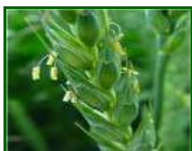
Fin espigado - floración

El estado fenológico dominante en la provincia es BBCH: 71 – 77 “ grano lechoso ”, aunque aún hay parcelas más atrasadas en BBCH: 56 – 59 “ fin espigado - floración ”.