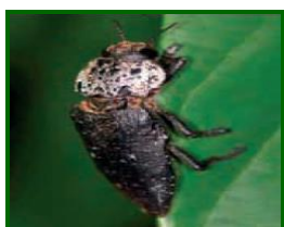
Adulto de gusano cabezudo

Comienzan a observarse presencia de adultos, tras su salida invernal del suelo.