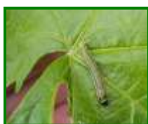
Larva de Piral

No se observan esta semana daños producidos por este agente.