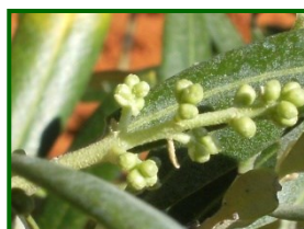
Estado fenológico "D2"

Según la previsión oficial de la Agencia Estatal de Meteorología (AEMET) para la provincia de Córdoba durante la semana del 28 de abril al 4 de mayo de 2025, se espera un tiempo variable con temperaturas máximas entre 21 °C y 23 °C y mínimas entre 6 °C y 8 °C. Las probabilidades de precipitación son bajas, oscilando entre el 0 % y el 15 % al inicio de la semana, aumentando ligeramente hacia el final. La humedad relativa variará entre el 45 % y el 100 %, siendo más elevada durante las primeras horas del día. En cuanto al viento, predominarán las brisas suaves del noreste y suroeste, con velocidades entre 5 y 15 km/h, sin rachas significativas previstas.