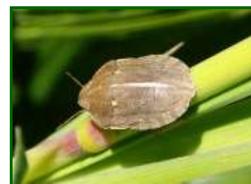
Adulto de paulillón

Se detectan individuos de paulillón en el 100 % de las 35 parcelas muestreadas, con una media provincial de 1,26 adultos+ninfas/m 2 (2,29 en el último muestreo). La zona biológica más afectada es Campiña Baja Occidental , con una media de 1,25 adultos+ninfas/m 2 .