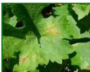
Hoja con síntomas

Esta semana se han detectado los primeros daños por araña amarilla en el cultivo, detectándose estos en el 18 % de las parcelas muestreadas (sobre 11 de estaciones de control), con una media provincial muy baja, de solo el 0,7 % de hojas inferiores con presencia. Sierra ha sido la zona biológica más afectada por estos ácaros, con un 2 % de hojas inferiores con presencia de araña amarilla.