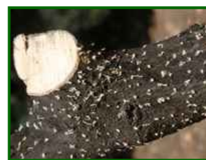
Orificios de entrada

El barrenillo del olivo ( Phloeotribus scarabaeoides ) es un coleóptero de la familia Curculionidae, subfamilia Scolytinae, considerado una de las principales plagas de los olivos en climas mediterráneos. Ataca especialmente a árboles debilitados, mal gestionados o con presencia de ramas secas y restos de poda sin eliminar.