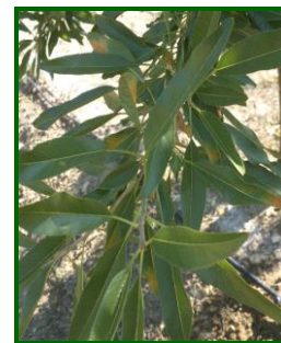
Síntomas en hojas

El hongo de un año para otro, permanece en las hojas que caen al suelo y en las que quedan adheridas al árbol, produciéndose una sola infección que pasa del suelo a la hoja, después en las hojas ya no hay nuevas reinfestaciones entre sí. Para evitar o reducir infecciones al año siguiente es importante eliminar las hojas del suelo o destruirlas mediante labores de cultivo.