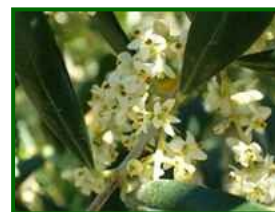
Estado fenológico "F"

Hay una gran disparidad de estados fenológicos . En el 75% de las parcelas de control, se encuentra entre "D3" (la corola cambia de color y "F" (floración).