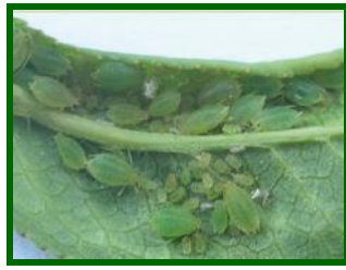
Colonia de pulgones

Descenso de presencia de colonias de pulgones Hyalopterus amygdali (Pulgón harinoso), con un porcentaje de brotes afectados que ha pasado del 3 % al 1,7 % , máximos del 12 % y registrado en la cuarta parte de las parcelas muestreadas. Es conveniente estar atentos a su evolución con el aumento de la temperatura, ya que pueden llegar a provocar en casos de elevada presión de población, debilitamiento, amarilleamientos y retraso del crecimiento. Su presencia se detecta por los