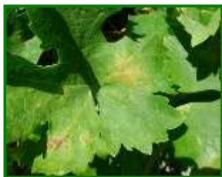
Hoja con síntomas

Esta semana se han detectado daños por araña amarilla en el 9 % de las parcelas muestreadas (sobre 11 de estaciones de control), registrándose una media provincial muy baja, de solo el 0,4 % de hojas inferiores con presencia (igual que la pasada semana). Los Llanos ha sido la única zona biológica afectada por estos ácaros, con un 0,7 % de hojas inferiores con presencia de araña amarilla.