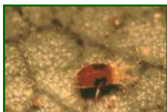
Adulto de Tetranychus urticae

Leve aumento del porcentaje de brotes atacados con formas vivas , pasando del 0,8 % al 1,3 % y un máximo del 6 %, registrándose en el 25 % de las parcelas muestreadas.