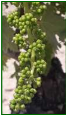
Estado fenológico "H" (Botones florales separados)

El estado fenológico dominante es "H" ( Botones florales separados ).