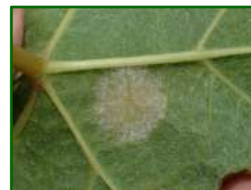
Mildiu en hoja

Cabe recordar que la temperatura a partir de la cual se desarrolla esta enfermedad debe ser superior a 10° C, y que las contaminaciones primarias se producen con lluvias de al menos 10 mm, y siempre en brotes de más de 10 cm de longitud.