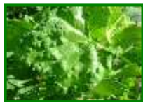
Erinosis (raza de las agallas)

No se observa presencia de erinosis en las parcelas muestreadas. Los síntomas que suelen observarse generalmente corresponden a la raza de las agallas , que no suele dar problemas en plantaciones adultas.