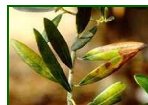
Hojas con síntomas

Biología del hongo y daños que produce: El hongo P. cladosporioides penetra en la hoja a través de los estomas y desarrolla su micelio en el interior del tejido foliar. Con el tiempo, provoca una decoloración característica en el envés de las hojas, con un tono grisáceo o plumizo debido a la esporulación del hongo. En el haz pueden aparecer manchas irregulares de color amarillo o marrón. La enfermedad causa debilitamiento del árbol debido a la pérdida prematura de hojas, lo que afecta la capacidad fotosintética y puede reducir la producción y calidad de la aceituna. En casos graves, también se han observado daños en los frutos, con manchas superficiales que afectan a su desarrollo.