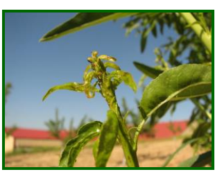
Colonia de pulgones

Descenso de presencia de colonias de pulgones Hyalopterus amygdali (Pulgón harinoso), con un porcentaje de brotes afectados que ha pasado del 3 % al 1,7 % , máximos del 12 % y registrado en la cuarta parte de las parcelas muestreadas. Es conveniente estar atentos a su evolución con el aumento de la temperatura, ya que pueden llegar a provocar en casos de elevada presión de población, debilitamiento, amarilleamientos y retraso del crecimiento. Su presencia se detecta por los