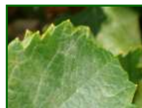
Oídio en hoja

A veces los comienzos del ataque suelen manifestarse con manchas aceitosas con punteaduras pardas. En los casos de ataque intenso de las hojas aparecen abarquilladas y recubiertas de polvillo por el haz y el envés. En brotes y sarmientos, los síntomas se manifiestan por manchas difusas de color verde oscuro, que van creciendo, definiéndose y pasando a tonos achocolatados al avanzar la vegetación, y a negruzcos al endurecerse el brote. En racimos, al principio los granitos aparecen con un cierto tinte plumizo, recubriéndose en poco tiempo de polvillo ceniciento, que si se limpia deja ver puntitos pardos sobre el hollejo.