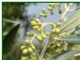
Estado fenológico "D3"

Según la Agencia Estatal de Meteorología (AEMET) , la semana del 12 al 18 de mayo de 2025 en la provincia de Córdoba se caracterizará por cielos mayormente despejados y temperaturas agradables. Las máximas oscilarán entre 24 °C y 28 °C, mientras que las mínimas se situarán entre 10 °C y 13 °C. La humedad relativa variará entre el 45 % y el 70 %, siendo más elevada durante las madrugadas y en zonas de valle. El viento soplará predominantemente del oeste y noroeste, con velocidades medias de 10 a 20 km/h y rachas máximas que podrían alcanzar los 30 km/h. La probabilidad de precipitaciones será baja durante la mayor parte de la semana, aunque no se descartan lluvias débiles y dispersas hacia el fin de semana, especialmente en áreas de sierra.