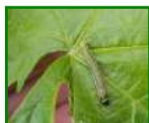
Larva de Piral

No se observan esta semana daños producidos por este agente.