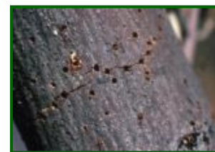
Orificios de salida