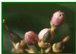
Elementos florales afectados