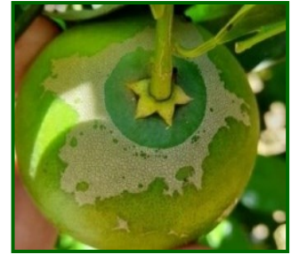
Síntomas en fruto

Scirtothrips aurantii Faure (Thysanoptera: Thripidae) es una plaga relevante en cultivos de cítricos y otras especies frutales. Ha sido detectado en varias regiones cítricas de España, principalmente en el sureste, donde las condiciones climáticas favorecen su proliferación. Su presencia ha sido confirmada en cultivos de la Comunidad Valenciana, Murcia y Andalucía.