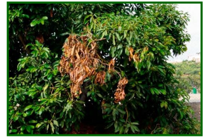
Síntomas en ramas

El cultivo del aguacate es un cultivo subtropical de gran importancia en el litoral de Málaga (especialmente Axarquía) y Granada, con cerca de 7.500 ha en Málaga (de 19.500 ha en España) y unas 49.000 t anuales. Desde 2015 se detecta en la zona una enfermedad conocida como “seca de rama”, “muerte regresiva” o “hongo aéreo” del aguacate, causada por diversos hongos (de la familia Botryosphaeriaceae ) que atacan la parte aérea de la planta. Los síntomas típicos son necrosis descendente desde la punta de las ramas y panículas florales, con decoloración rojiza interna de los tejidos vasculares, lo que acaba secando progresivamente las ramas. Esta enfermedad no es exclusiva de Málaga (existe en California, Israel, Canarias...), pero aquí ha cobrado relevancia porque daña la productividad de una zona de alto valor socioeconómico. Dado que no existen fitosanitarios específicos autorizados, las estrategias de control deben centrarse en medidas culturales y preventivas.