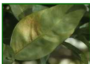
T. urticae Síntomas en hoja