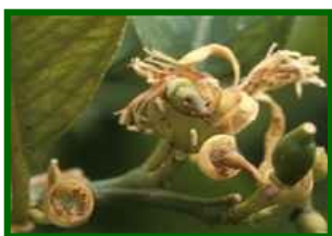
Elementos florales afectados

La Polilla del limonero ( Prays citri ) es un lepidóptero ditrisio de la familia Plutellidae que puede desarrollar varias generaciones al año en climas mediterráneos, donde los inviernos son suaves; las primaveras moderadamente lluviosas favorecen su ciclo biológico. Los adultos, de apenas 8–12 mm de envergadura y color gris moteado, depositan sus huevos en los botones florales, dando lugar a orugas que se alimentan de tejido reproductivo y provocan el aborto de flores y pequeños frutos. Afecta especialmente a limonero ( Citrus limonum ) y pomelo ( Citrus decumana ), aunque también ataca con menor incidencia a naranja agria ( Citrus aurantium ). Para minimizar pérdidas, se recomienda un manejo integrado que combine monitorización, umbrales de tratamiento claramente definidos, alternancia de modos de acción y técnicas de control biológico y cultural.