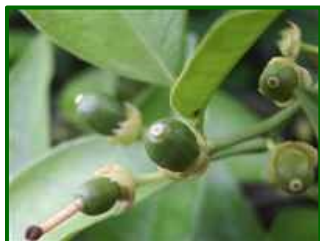
Estado fenológico "H"

El estado fenológico dominante en esta época es H (caída de estilos) y ya se empieza a observar I1 (cuajado del fruto).