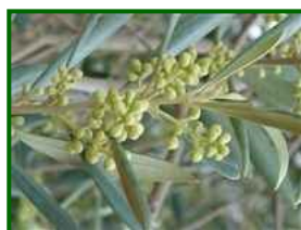
Estado fenológico "D3"

Según la Agencia Estatal de Meteorología (AEMET) , la semana del 19 al 25 de mayo de 2025 en la provincia de Málaga se caracterizará por un tiempo mayormente estable y temperaturas agradables. Las temperaturas máximas oscilarán entre los 22 °C y 29 °C, mientras que las mínimas se situarán entre los 15 °C y 18 °C. La humedad relativa variará entre el 60 % y el 85 %, siendo más elevada durante las madrugadas y en zonas cercanas al litoral. El viento soplará predominantemente de componente oeste y suroeste, con velocidades medias de 10 a 20 km/h y rachas máximas que podrían alcanzar los 30 km/h. No se esperan precipitaciones significativas durante la semana, aunque no se descartan lluvias débiles y dispersas hacia el fin de semana, especialmente en áreas montañosas.