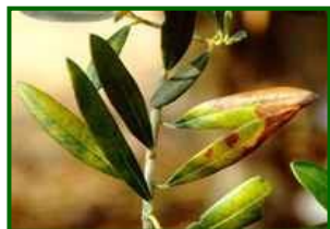
Hojas con síntomas

El repilo plumizo es una enfermedad fúngica causada por Pseudocercospora cladosporioides , que afecta principalmente a las hojas del olivo, aunque también puede incidir en frutos y peciolo. Su desarrollo es más lento que el del repilo común ( Fusicladium oleagineum ), por lo que sus síntomas suelen aparecer más tarde y ser menos evidentes en las primeras fases de infección.