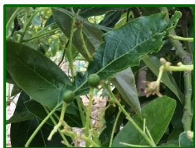
Estado fenológico "H"

El estado fenológico dominante en las parcelas de control es "H" (cuajado).