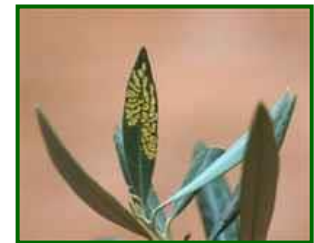
Daños de Glifodes

Destacan la zona biológica Campiña baja Oriental (9,0%), Campiña baja Occidental (4,8%) y Las Colonias-Vega Baja (2,9%).