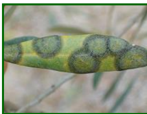
Hoja con síntomas

Se han realizado una serie de evaluaciones para determinar cuanta presencia de repilo hay en estos momentos en las parcelas de control. Desde mediados de mayo hasta mediados de junio, en las 99 parcelas de control analizadas se detecta presencia de repilo visible en el 79,8% de ellas. El porcentaje medio provincial de hojas con repilo visible es el 3,7%.