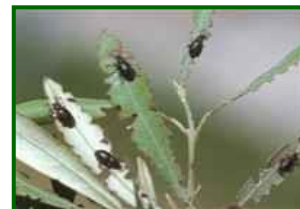
Hojas con insectos

El otiorrinco del olivo, Othiorhynchus cribricollis , es un coleóptero de la familia Curculionidae que, aunque históricamente ha sido considerado una plaga menor, en los últimos años ha adquirido mayor relevancia en algunas zonas olivereras, especialmente en plantaciones jóvenes o con manejo ecológico. Esta especie es polífaga, afectando también a otros cultivos leñosos y ornamentales.