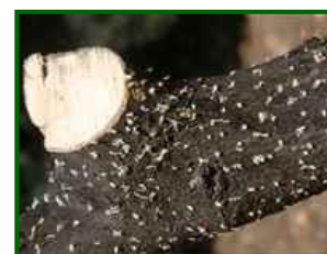
Orificios de entrada

Se recuerda que la legislación vigente establece que, desde el 1 de mayo hasta el 31 de octubre, donde haya leña y restos procedentes de la poda anual del olivar, se tomen las medidas reguladas por la Ley 43/2002 de 20 de noviembre de Sanidad Vegetal y desarrollada en la Comunidad Autónoma de Andalucía mediante las órdenes del 2 de noviembre del 1981 y del 10 de marzo de 1982 que resume y determina las normas a seguir para prevenir los daños de Barrenillo del olivo ( Phloeotribus scarabaeoides ).