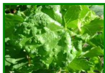
Eriosis (raza de las agallas)

No se ha observado presencia de eriosis en las parcelas muestreadas. Los síntomas que suelen observarse generalmente corresponden a la raza de las agallas , que no suele dar problemas en plantaciones adultas.