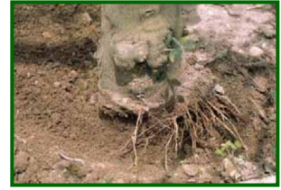
Daños de topillo

Los topillos (género Pitymys ) son pequeños roedores que viven en madrigueras. Su aspecto recuerda al de un ratón, pero tienen cola mucho más corta (2–2,5 cm) y orejas pequeñas, con pelaje pardo amarillento y vientre blanquecino. Construyen nidos subterráneos con musgo y raíces a unos 30-35 cm de profundidad, formando galerías largas. Pueden tener 4-5 camadas al año (3-4 crías cada una, hasta 12-20 crías anuales). Son nocturnos y crepusculares, pasando la mayor parte del tiempo bajo tierra. Su población suele estar limitada por depredadores naturales (reptiles, aves rapaces, mamíferos), por lo que eliminar estos controladores naturales puede favorecer plagas.