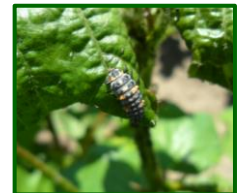
Larva de coccinélido

Las altas temperaturas que se esperan los próximos días serán más desfavorables para su desarrollo. Se recomienda vigilar su evolución, principalmente en los algodones más tardíos.