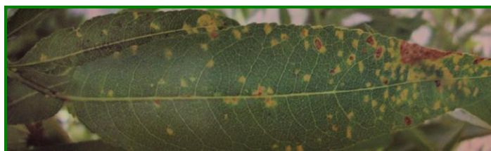
Síntomas en el haz

En almendro se comporta como una roya de ciclo incompleto. El hongo inverna como micelio o uredosporas en las ramas y hojas de desarrollo tardío, que no se han desprendido del árbol. Así puede sobrevivir uno o dos años. Las uredosporas se extienden por el viento y la lluvia, pudiendo germinar con un amplio margen de temperaturas (8-38°C), siendo la humedad el factor limitante. Las