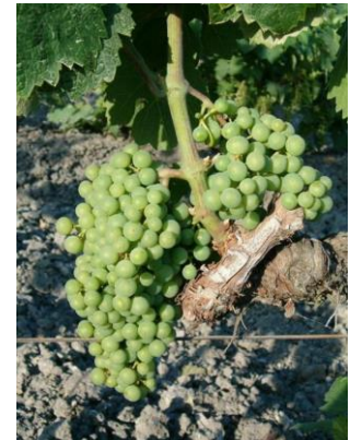
Estado fenológico "L" (Cerramiento de racimo)

Antes de realizar cualquier control fitosanitario debemos de consultar al asesor fitosanitario de nuestra asociación o cooperativa para asegurar el éxito de nuestra intervención, además al realizar cualquier tipo de tratamiento químico debemos atender a las indicaciones del técnico asesor, así como la información reflejada en la etiqueta de los productos fitosanitarios a utilizar, respetando los plazos de seguridad que marcan los fabricantes de estos productos.