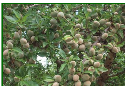
Estado fenológico "J" Fruto desarrollado.

El estado fenológico dominante en las distintas variedades sigue siendo "J" (Fruto desarrollado).