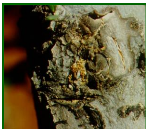
Excrementos de larvas

No aparecen daños en las 19 parcelas de control muestreadas.