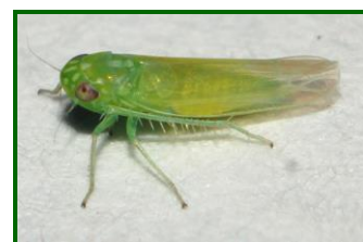
Adulto de mosquito verde

Este insecto se alimenta de savia que succiona el de las hojas y brotes tiernos, dando lugar a deformaciones de las hojas, amarilleamientos y hasta incluso caída prematura. Es aconsejable prestar especial atención en plantaciones jóvenes e injertos.