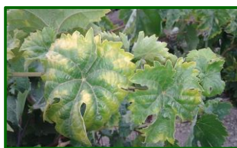
Daños por mosquito verde

Invernan como adultos en otras plantas cultivadas y espontáneas sobre todo en sitios abrigados. En primavera emigran a las cepas donde se alimentan. Tienen entre 4 o 5 generaciones al año con una duración media de 40 días, siendo la más importante la que corresponden a los meses de verano.