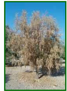
Árbol con síntomas

Desde el punto de vista biológico, V. dahliae es un hongo capaz de sobrevivir durante años en el suelo en forma de estructuras de resistencia llamadas microsclerocios. Estas estructuras germinan en presencia de exudados radiculares del olivo u otras plantas hospedantes. Tras penetrar por las raíces, el hongo asciende por el xilema, multiplicándose y liberando toxinas que obstruyen el transporte de savia. Existen dos formas patogénicas principales: la defoliante, más agresiva y frecuente en variedades sensibles como 'Picual', y la no defoliante, de menor impacto, pero también relevante.