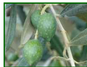
Estado fenológico H

El estado fenológico más abundante, en el 58% de las parcelas de control, es "H" (endurecimiento de hueso) en el 42% restante es "G2" (fruto cuajado).