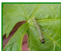
Larva de Piral

Continúa sin observarse la presencia de daños producidos por este agente en las parcelas observadas (11 en total).