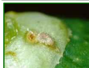
Orificio de entrada en fruto

El porcentaje medio provincial de frutos con formas vivas de prays (incluidos los huevos viables) es el 10,11%. Aparecen frutos con daños en el 96,3% de las 27 parcelas analizadas.