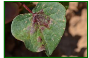
Hoja con araña roja

Se aconseja mantener limpias las lindes de malas hierbas, ya que es en estos lugares donde se refugian los adultos de estos ácaros antes de invadir los campos de algodón e igualmente aquellas lindes con parcelas sembradas de maíz ya que este cultivo es sensible al ataque de araña roja y puede ser lugar de entrada.