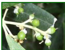
Estado fenológico "G2"

Según a previsión meteorológica para la próxima semana, nos indica temperaturas máximas comprendidas entre 37°C y 43°C y las mínimas comprendidas entre 22°C y 24°C, no se esperan precipitaciones. Los vientos van a ser flojos y de componente variable, predominando los vientos con dirección oeste - suroeste.