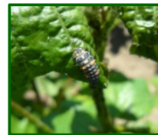
Larva de coccinélido

Por Zonas Biológicas, sigue siendo Vega Alta la más afectada con una presencia 0.66 pulgones.