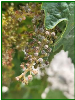
Mildiu en racimo

Cabe recordar que la temperatura a partir de la cual se desarrolla esta enfermedad debe ser superior a 10° C, y que las contaminaciones primarias se producen con lluvias de al menos 10 mm, y siempre en brotes de más de 10 cm de longitud. Para que se produzcan las contaminaciones posteriores ( contaminaciones secundarias ) basta solo con la presencia de agua libre (rocío, niebla, condensación, etc) en las hojas. Los primeros síntomas en las hojas se manifiestan por las típicas "manchas de aceite" en el haz, que se corresponde en el envés con una pelusilla blanquecina, si el tiempo es húmedo.