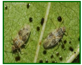
Adulto de tigre del almendro

Las hojas afectadas por la actividad de este agente presentan un punteado sobre el haz de la hoja y en el envés se observa una serie de pequeños puntos negros que son sus excrementos, la hoja se debilita, reduciendo la actividad fotosintética, y cuando el ataque es muy agresivo se produce la caída de las hojas.