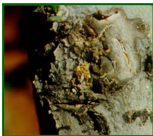
Excrementos de larvas

Se sigue monitorizando el vuelo con trampas de feromonas y la media provincial de adultos por trampa y día desciende a 0,71 (1,26 la semana anterior). Se producen capturas en el 48% de las 25 parcelas de control que han aportado datos. Destacan las zonas biológicas Campiña Alta Oriental I (1,70), campiña Baja Occidental (1,09), Las Colonias Vegas Bajas (1,80) y Sierra Morena Occidental (2,0) adultos por trampa y día. En el resto de las zonas las capturas son menores que la media provincial.