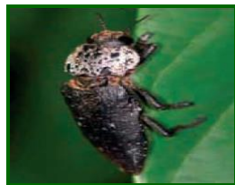
Adulto de gusano cabezudo

Se mantiene la presencia leve de adultos . Se observan daños sobre los brotes de las hojas. Las parcelas deben muestrearse semanalmente a partir de la entrada en vegetación del cultivo hasta final de verano, valorando la distribución y población de adultos y larvas neonatas. Dado que las condiciones que favorecen el desarrollo de esta plaga son las del secano o próximas a éste, es recomendable en lo posible mejorar en su caso las características del riego.