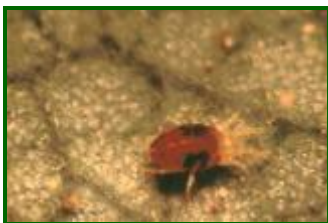
Adulto de Tetranychus urticae

Las condiciones climatológicas que se dan en los meses de julio y agosto favorecen el desarrollo de este agente, que se valora en el porcentaje de brotes atacados con formas vivas . Durante este periodo de observación el valor de brotes afectados se ha mantenido en el 10,8%, registrándose este dato en el total de las estaciones muestreadas.