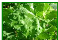
Erinosis (raza de las agallas)

No se detecta la presencia de daños por este agente en las 11 estaciones de control muestreadas. Los síntomas que suelen observarse generalmente corresponden a la raza de las agallas , que no suele dar problemas en plantaciones adultas.