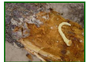
Larva de gusano cabezudo

Es muy importante la detección precoz del problema con presencia de adultos, sin esperar a apreciar los primeros árboles deprimidos. Existe una gran influencia entre parcelas cercanas, actuando a menudo aquellas más abandonadas como foco de contaminación. Se recomienda, como medida complementaria para su control arrancar y quemar cuanto antes los árboles afectados, incluyendo el máximo de raíces.