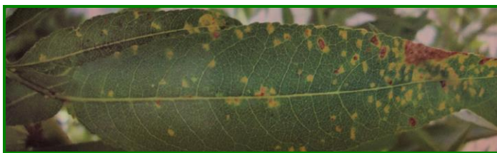
Síntomas en el haz

Los síntomas iniciales consisten en pequeñas lesiones cloróticas angulares de 1-2 mm en el haz de las hojas. Estas manchas están delimitadas, en forma y tamaño, por las nerviaciones foliares y más tarde se pueden agrupar varias y tomar un color amarillo dorado. En el envés de las hojas se aprecian pústulas pulverulentas de color naranja a marrón debidas a las fructificaciones del hongo.