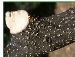
Orificios de entrada

Se recuerda que la legislación vigente establece que, desde el 1 de mayo hasta el 31 de octubre, donde haya leña y restos procedentes de la poda anual del olivar, se tomen las medidas reguladas por la Ley 43/2002 de 20 de noviembre de Sanidad Vegetal y desarrollada en la Comunidad Autónoma de Andalucía mediante las órdenes del 2 de noviembre del 1981 y del 10 de marzo de 1982 que resume y determina las normas a seguir para prevenir los daños de Barrenillo del olivo ( Phloeotribus scarabaeoides ).