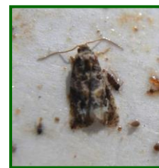
Adulto de Polilla

Inverna como crisálida, con la diapausa inducida, desde septiembre-octubre hasta la primavera siguiente. Se ubica preferentemente bajo la corteza de las cepas, y en las grietas de los rodrigones cuando la vid se conduce en espaldera, en el interior de un capullo de textura más recia y consistente que cuando la crisálida es no diapausante. Las larvas de la 1ª generación destruyen botones florales, flores e incluso frutos recién cuajados que se reúnen en (glomérulos) o nidos en donde viven. Las larvas de las siguientes generaciones producen pérdida de cosecha y calidad, sobre todo en las variedades de uvas de mesa, debido a que se alimentan de las bayas y penetran en ellas. En la 2ª y 3ª generación las larvas realizan galerías en las bayas, siendo estas vía de entrada de infecciones de podredumbres, y su desarrollo dependerá de las condiciones climatológicas.