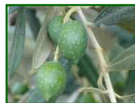
Estado fenológico H

El estado fenológico más abundante, en el 83% de las parcelas de control, es "H" (endurecimiento de hueso) siendo en el 17% restante "G2" (fruto cuajado).