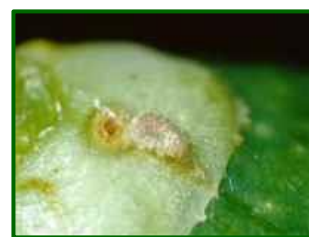
Orificio de entrada en fruto

El porcentaje medio de frutos con formas vivas de prays en las zonas más atrasadas es del 8,43% (incluidos los huevos viables). Aparecen frutos con daños en el 100% de las parcelas analizadas.