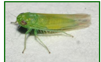
Adulto de mosquito verde

Este insecto se alimenta de savia que succiona el de las hojas y brotes tiernos, dando lugar a deformaciones de las hojas, amarilleamientos y hasta incluso caída prematura. Es aconsejable prestar especial atención en plantaciones jóvenes e injertos.