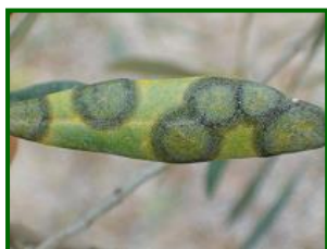
Hoja con síntomas

Se han realizado una serie de evaluaciones para determinar cuanta presencia de repilo hay en estos momentos en las parcelas de control. Desde mediados de mayo hasta mediados de junio, en las 99 parcelas de control analizadas se detecta presencia de repilo visible en el 79,8% de ellas. El porcentaje medio provincial de hojas con repilo visible es el 3,7%.