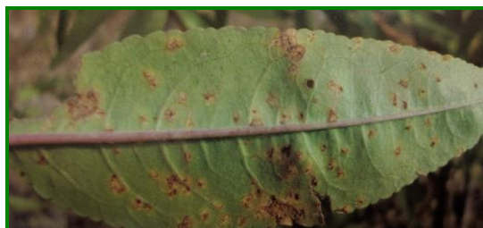
Síntomas en el envés

Las uredosporas de estas especies se caracterizan por ser anchas, fusiformes oclavadas con una pared dorada más engrosada en el ápice.