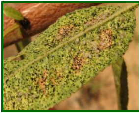
Hoja afectada por tigre del almendro

Leve aumento de la presencia de brotes atacados con formas vivas , con un porcentaje del 5.50 % , (4,80% de la semana anterior) registrándose en la totalidad de las parcelas muestreadas.