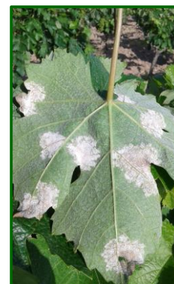
Mildiu en hoja

Se aconseja estar atentos a las previsiones meteorológicas, con objeto de tomar las medidas oportunas de protección fitosanitaria en caso de ser necesario. Las altas temperaturas de estos días, y las previstas para la semana que viene van a seguir frenado el avance de esta enfermedad; no obstante, se recomienda el monitoreo semanal de nuestros viñedos, siendo este fundamental y necesario para determinar la evolución de la enfermedad.