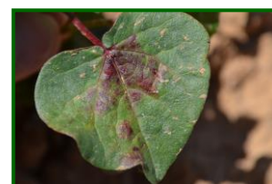
Hoja con araña roja

Por otra parte, la media provincial del número de adultos por hoja aumenta 0,30, siendo el dato de la semana anterior 0,20 adultos/hoja.