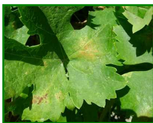
Hoja con síntomas

Continúa sin detectarse la presencia de este agente, así como la no existencia de daños en ninguna de las parcelas muestreadas (sobre un total de 11 estaciones de control).