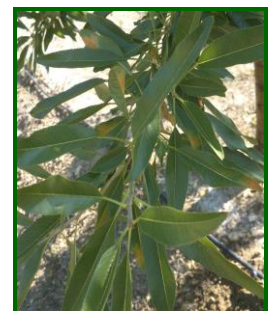
Síntomas en hojas

El hongo de un año para otro, permanece en las hojas que caen al suelo y en las que quedan adheridas al árbol, produciéndose una sola infección que pasa del suelo a la hoja, después en las hojas ya no hay nuevas reinfestaciones entre sí. Para evitar o reducir infecciones al año siguiente es importante eliminar las hojas del suelo o destruirlas mediante labores de cultivo.