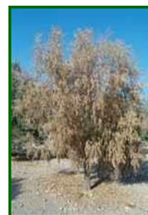
Árbol con síntomas

Las condiciones meteorológicas tienen una influencia decisiva en la aparición y gravedad de la verticilosis. La humedad del suelo elevada, las temperaturas suaves (entre 20 y 25 °C) y un drenaje deficiente favorecen la infección y diseminación del