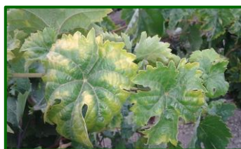
Daños por mosquito verde

Invernan como adultos en otras plantas cultivadas y espontáneas sobre todo en sitios abrigados. En primavera emigran a las cepas donde se alimentan. Tienen entre 4 o 5 generaciones al año con una duración media de 40 días, siendo la más importante la que corresponden a los meses de verano.