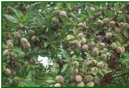
Estado fenológico "J" Fruto desarrollado.

El estado fenológico dominante en las distintas variedades sigue siendo "J" (Fruto desarrollado).