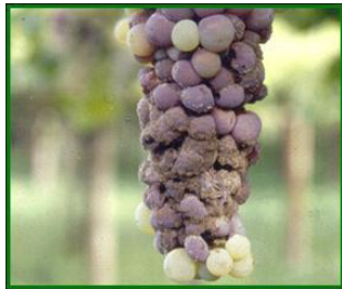
Racimo afectado por Podredumbre Gris

La mayor o menor presencia de daños durante el periodo de maduración producidos por podredumbre gris ( Botrytis cinerea ), podredumbre ácida , (olor a vinagre) y/o podredumbres secundarias ( Aspergillus niger , Cladosporium herbarum , Alternaria sp. , Rhizopus nigricans ), (siendo la más común Aspergillus niger en la provincia de Córdoba), dependerá entre otros factores de la incidencia de heridas producidas por la polilla del racimo y/o oidio en los racimos, agravándose en periodos de lluvias, humedad relativa elevada y temperaturas suaves.