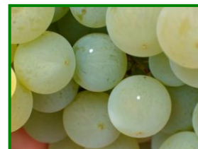
Puestas de Lobesia

Inverna como crisálida, con la diapausa inducida, desde septiembre-octubre hasta la primavera siguiente. Se ubica preferentemente bajo la corteza de las cepas, y en las grietas de los rodrigones cuando la vid se conduce en espaldera, en el interior de un capullo de textura más recia y consistente que cuando la crisálida es no diapausante. Las larvas de la 1ª generación destruyen botones florales, flores e incluso frutos recién cuajados que se reúnen en (glomérulos) o nidos en donde viven. Las larvas de las siguientes generaciones producen pérdida de cosecha y calidad, sobre todo en las variedades de uvas de mesa, debido a que se alimentan de las bayas y penetran en ellas. En la 2ª y 3ª generación las larvas realizan galerías en las bayas, siendo estas vía de entrada de infecciones de podredumbres, y su desarrollo dependerá de las condiciones climatológicas.