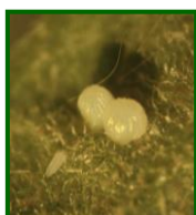
Puesta de heliotis

Debemos seguir estando alerta y realizar frecuentes observaciones en nuestras parcelas para valorar la evolución biológica de esta plaga. Se sigue apreciando la presencia de puestas y larvas en las parcelas muestreadas.