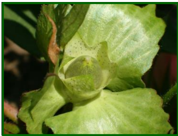
"P" Cápsula pequeña

La fenología nos muestra como estado dominante en el cultivo "B" (Botones), con una media provincial de 612700 mil botones por hectárea, como más adelantado nos encontramos "G" (cápsulas grandes) con una media provincial de 420000 mil cápsulas grandes por hectárea, también tenemos presentes los estadios "F" (Floración) con 33330 mil flores por hectárea y "P" (cápsulas pequeñas) con 286600 mil cápsulas pequeñas por hectárea. De todas las zonas biológicas muestreadas Las Colonias presenta todos los estadios que se han comentado anteriormente, la zona biológica Vega Baja tiene como estado más adelantado "P" (cápsulas pequeñas), del resto de zonas biológicas no tenemos datos esta semana.