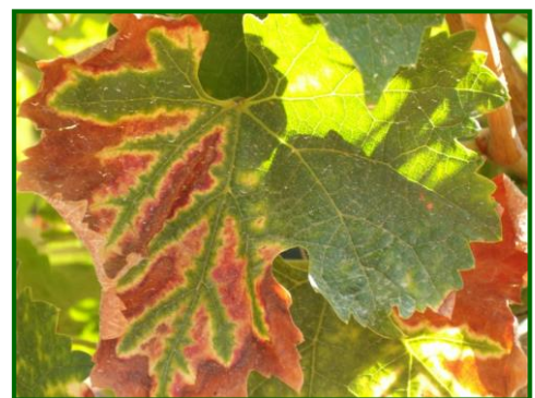
Hoja afectada por Yesca

Los síntomas que manifiestan las cepas atacadas son, muy parecidas a los síntomas de Yesca ( Stereum hirsutum y Phellinus igniarius ) y/o Eutipiosis ( Eutypa lata ). Sin embargo, en los análisis realizados en laboratorio se aíslan otros hongos además de los anteriores, tales como, Fomitiporia punctata , Neofusicoccum sp. , Rosellinia sp. , Botryosphaeria obtusa , Phaemoniella chlamidospora , Phaeoacremonium aleophilum y Cylindrocarpon sp.