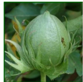
"G" Cápsula grande

La previsión meteorológica para la próxima semana nos indica temperaturas máximas muy elevadas situándose en valores en torno a los 44 °C, las mínimas no descenderán de valores en torno a los 25 °C, no se esperan precipitaciones. Los vientos seguirán siendo de flojos a moderados con dirección variable y con periodos de calma.