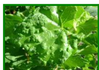
Erinosis (raza de las agallas)

Continúa manteniéndose nula la presencia de daños en cepa de este agente en las observaciones realizadas esta semana.