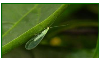
Adulto de crisopa

En cuanto a la actividad de los insectos auxiliares se detecta esta semana presencia de adultos de crisopa en el 88.89% de las 90 parcelas de control muestreadas, con una media provincial superior a la de la semana anterior. La media provincial se sitúa en 1.57 adultos por trampa y día ( 1.27 la semana anterior). Las zonas biológicas con mayor presencia de Crisopas son: Campaña Baja Occidental, Las Colonias-Vega Baja y Subbética Septentrional, con 2.75, 2.43 y 2.14 capturas por trampa y día respectivamente.