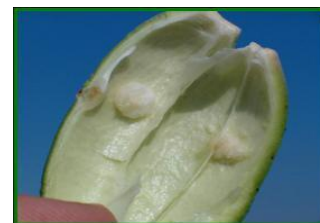
Callos internos por picaduras

Recordar que, si la incidencia de estos agentes es muy elevada, puede provocar deformaciones y endurecimiento de las cápsulas y manchado de las fibras como consecuencia de las picaduras.