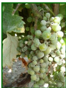
Oídio en racimo

La temperatura, la humedad y, en menor medida la insolación, son los factores climáticos que condicionan el desarrollo del hongo. Alrededor de 15°C la temperatura comienza a ser favorable estando su óptimo en los 25-28°C. El desarrollo de la enfermedad se ve favorecido por humedades altas, pero las lluvias abundantes frenan su desarrollo. El oidio puede atacar todos los órganos verdes de la vid. En hojas, los síntomas pueden aparecer tanto en el haz como en el envés; en ambos casos suele observarse un polvillo blanco ceniciento, que puede limitarse a algunas zonas o bien ocupar toda la superficie de la hoja.