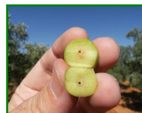
Ataque de larva generación carpófaga

En las próximas semanas se efectuará un muestreo puntual en todas las parcelas que conforman la Red de Alerta para realizar un seguimiento del estado en que se encuentran los frutos, observando la incidencia que han tenido las larvas de la generación carpófaga de la polilla del olivo ( Prays oleae ), que penetraron al interior del hueso del fruto durante el mes de junio y julio. Una vez penetran las larvas en el interior del hueso antes de que este se endurezca. Durante el verano se alimentan de la semilla hasta que a mediados del mes de septiembre se inicia su salida de la aceituna para terminar crisalidando en el suelo.