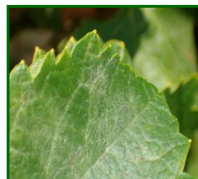
Oídio en hoja

La media provincial de % de hojas con síntomas se mantiene en el 1.45% , siendo la zona biológica de Las Arenas la que supera ampliamente la media provincial, con un % de hojas con síntomas que alcanza el 4% . Los datos de % de cepas afectadas por este agente se mantiene igual que la semana anterior con un 1.45% , siendo la zona biológica de Las Arenas la que supera la media provincial con un 4% de cepas afectadas.