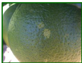
Daños por Mosquito verde

Aumenta la detección de frutos atacados por este agente al 46.15% de las parcelas muestreadas, duplicando su valor respecto a la semana pasada, sobre un total de 13 . La media provincial es de 1.38% de frutos atacados, valor muy superior a la semana anterior, 0.81% de brotes atacados. La zona biológica de La Vega es la que presenta daños de este agente.