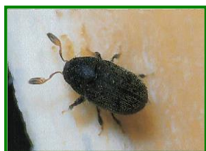
Adulto de barrenillo

En las próximas semanas se efectuará un muestreo puntual en todas las parcelas que conforman la Red de Alerta para realizar un seguimiento de los adultos del Barrenillo del olivo ( Phloeotribus scarabaeoides ). Para ello se realizarán observaciones del número de brotes afectados. El daño se debe a las galerías de alimentación de los adultos las cuales provocan la seca y posterior caída de hojas, frutos y ramitas productivas.