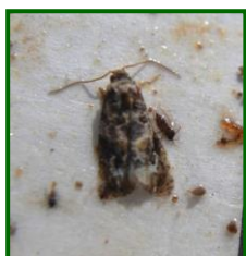
Adulto de Polilla

Continúa sin haber capturas de adultos en polilleros. Sigue sin observarse la presencia de puestas y/o larvas en racimos.