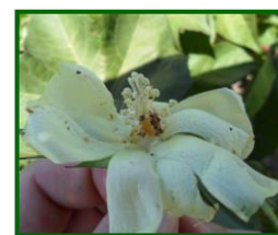
Larva en farolillo

En cuanto a las capturas de adultos la media provincial alcanza el valor de 0.71 adultos/trampa y día (0.95 la semana anterior) , observadas en el 77.78% de las 9 ECB muestreadas.