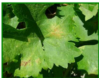
Hoja con síntomas

Sigue sin apreciarse la presencia de este agente en todas las zonas biológicas muestreadas.