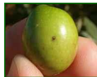
Picada de mosca

En el 97.50% de las parcelas de control el estado fenológico es el de endurecimiento del hueso, estos frutos son receptivos, son adecuados para que la mosca los pueda picar. De las 92 parcelas muestreadas esta semana el 21.74% presentan picada, con una media de 0.99% de aceitunas picadas total (aumenta respecto a la semana anterior que fue de 0.32%), destacando la zona biológica de la Subbética Central con un valor de 4.10% de picada total, prácticamente duplica su dato de la semana anterior; la zona biológica de la Campiña Baja Occidental aumenta la picada de manera muy considerable, alcanzando un valor de 1.75%, la semana anterior 0.09%.