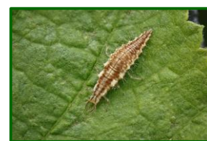
Larva de crisopa

En cuanto a la actividad de los insectos auxiliares se detecta esta semana presencia de adultos de crisopa en el 88.89% de las 90 parcelas de control muestreadas, con una media provincial superior a la de la semana anterior. La media provincial se sitúa en 1.57 adultos por trampa y día ( 1.27 la semana anterior). Las zonas biológicas con mayor presencia de Crisopas son: Campaña Baja Occidental, Las Colonias-Vega Baja y Subbética Septentrional, con 2.75, 2.43 y 2.14 capturas por trampa y día respectivamente.