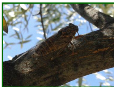
Adulto de chicharra

En los meses estivales se pueden observar daños producidos por Chicharras ( Cicada barbara ) en los olivares de la provincia de Córdoba.