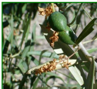
Estado fenológico "H" (Endurecimiento de hueso)

En las zonas biológicas de olivar esta semana, las temperaturas máximas han diferido desde los 36 °C de la Subbética hasta los 41.52 °C de Sierra Morena y las mínimas variaron 19 de Sierra Morena y 22 °C de la Campiña. La temperatura media ha estado en torno a los 28-31 °C. La humedad relativa media ha estado en torno a valores de 33-42%. No se han producido precipitaciones durante este periodo. Se pueden consultar estos datos en la tabla de datos meteorológicos .