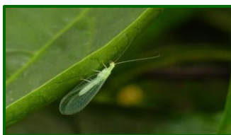
Adulto de crisopa

En cuanto a la actividad de los insectos auxiliares se detecta esta semana presencia de adultos de crisopa en el 88,43 % de 121 ECBs muestreadas, con una media provincial levemente inferior a la de la semana anterior. La media provincial se sitúa en 1,48 adultos por trampa y día ( 1,06 la semana anterior).