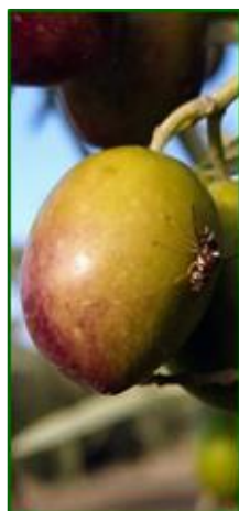
Adulto de mosca sobre aceituna

En el 100% de las parcelas de control el estado fenológico dominante es el de "H" endurecimiento del hueso , estos frutos son receptivos, son adecuados para que la mosca los pueda picar. De las 121 ECBs sobre las que se han aportado datos esta semana, el 34,71% % presentan picada, con una media de 1,63 % de aceitunas picadas total mismo dato de la semana anterior, destacando las zonas biológicas de la Subbética Central con un valor de 13,60 % y Subbética Meridional con un valor de 4,50 % de picada total .