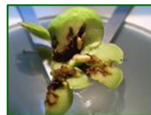
Galerías y pupas de mosca

El dato de las picadas con mosca viva desciende levemente respecto a la semana anterior con un valor de 0,52 % de media provincial. La zona biológica de Subbética Central con 4,70 % y Campiña Alta Oriental II con 0,75 % tienen el dato de picada viva mayor. El porcentaje de parcelas afectadas aumenta hasta un 22,41 % de las ECBs muestreadas ( 21,79 % la semana anterior). Esta semana se detectan algunas aceitunas picadas con orificios de salida en el 10,17 % de las ECBs muestreadas, con un valor muy cercano al cero de media provincial. Las zonas biológicas que presentan aceituna con orificio de salida son Campiña Alta Oriental I (0,03 %), Sierra Morena Oriental (0,05 %), Campiña Baja Occidental (0,03), Campiña Baja Oriental (0,10), Las Colonias-Vega Baja (0,09) y Sierra Morena