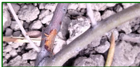
Mosquito de la corteza