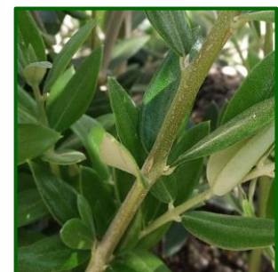
Larva de crisopa

Las larvas de este agente depredan tanto los huevos como las pequeñas larvas de polilla del olivo, por lo que es conveniente observar los niveles de depredación para considerar o no un posible tratamiento.