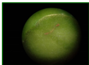
Galería de larva de mosca

El Reglamento de Producción Integrada establece una tolerancia diferente para la mosca según sea el destino del fruto: en almazara se permite cierto porcentaje de fruto afectado, pero un fruto picado no sirve para su aderezo; por esta razón se recomienda prestar especial atención en olivares de verdeo.