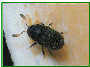
Adulto de barrenillo

Continuamos realizando un muestreo puntual en todas las parcelas que conforman la Red de Alerta para realizar el seguimiento de los adultos del Barrenillo del olivo ( Phloeotribus scarabaeoides ). Para ello se realizarán observaciones del % de brotes afectados. El daño se debe a las galerías de alimentación de los adultos las cuales provocan la seca y posterior caída de hojas, frutos y ramitas productivas.