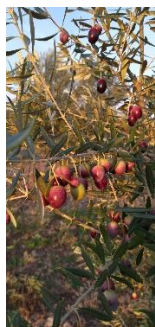
11 (Envero, manchas rojas)

El estado fenológico dominante es, en la mayoría de las estaciones de control, "H" (endurecimiento de hueso) . Apareciendo como estado fenológico adelantado "11" (envero, amarillo) en algunas estaciones de control muestreadas situadas en las zonas biológicas de Campiña Baja occidental, Campiña Alta Occidental, Las Colonias- Vega Baja y Sierra Morena Occidental, e "12" (envero, manchas rojas) en parcelas de las zonas de Las Colonias-Vega Bajas y Sierra Morena Occidental.