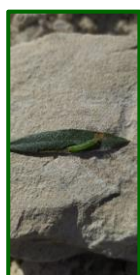
Larva de glifodes

Se han recogido datos de capturas de adultos por trampa y día en 18 estaciones de control, la media provincial aumenta hasta 0,15 adultos . Se observa su presencia en el 44,44 % de las ECBs muestreadas.