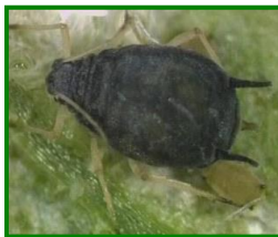
Hembra áptera de Pulgón

Esta semana vuelve a descender la presencia de Pulgones ( Aphis gossypii ) , hasta un valor de 0,06 de media provincial sobre el nivel de 0 a 3, ( 0,15 la semana pasada). Estando presente en el 66,67 % de las ECBs muestreadas.