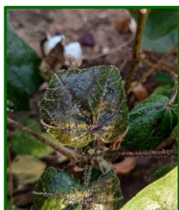
Hoja con melaza de mosca blanca

En las observaciones realizadas esta semana, la media provincial de pupas por hoja desciende hasta el valor de 7,00 ( 8,95 la semana pasada), se mantiene su presencia en el 100% de las estaciones muestreadas. La zona biológica de Vega Baja con 9,00 supera la media provincial.