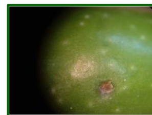
Picada de mosca

Aproximadamente a los tres días de la cópula las hembras pueden efectuar la puesta en frutos para que se inicie una nueva generación. La mosca precisa para ello frutos con el estado fenológico de endurecimiento de hueso o iniciando este estado. Una regla práctica es que, cuando las aceitunas tienen aproximadamente 10 milímetros de diámetro, son susceptibles a la picada de la mosca.