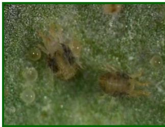
Adultos de Araña roja

Tradicionalmente ha sido una plaga importante en el cultivo, aunque en los últimos años ha disminuido su incidencia. Se desequilibra fácilmente por la desaparición de sus enemigos naturales, por la utilización de insecticidas polivalentes, el abonado nitrogenado y algunos plaguicidas como los piretroides.