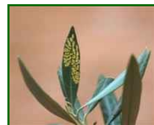
Daños de Glifodes

El glifodes del olivo ( Palpita vitrealis ) , es un lepidóptero de la familia Crambidae que, aunque tradicionalmente se ha considerado una plaga secundaria del olivo, en los últimos años ha incrementado su presencia e incidencia en diversas zonas olivereras, especialmente en aquellas de clima más cálido y húmedo. Su presencia también se ha documentado en otros hospedantes, como el jazmín y algunas especies de laurel, lo que favorece su persistencia en el entorno.