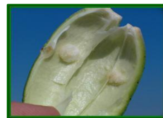
Callos internos por picaduras

Las principales y más abundantes especies de chinches fitófagas que nos podemos encontrar son Creontiades pallidus (chinche verde alargada), Lygus gemellatus (chinche de los cinco puntos) y con una menor presencia Oxycarenus hyalinipennis y Oxycarenus lavaterae (chinches rojinegras).