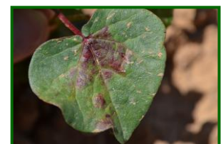
Hoja con araña roja

La Zona Biológica que supera la media provincial de % de plantas ocupadas , es Vega Baja con un valor de 1,00 % (0,33 % la semana pasada) .