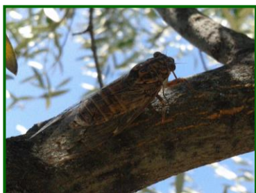
Adulto de chicharra

En los meses estivales se pueden observar daños producidos por Chicharras ( Cicada barbara ) en los olivares de la provincia de Córdoba.