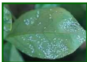
Colonia de mosca blanca

Esta semana continúa sin observarse la presencia de este agente en las estaciones de control sobre las que se ha realizado el muestreo.