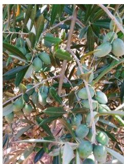
"H" (Endurecimiento de hueso)

En las zonas biológicas de olivar esta semana, las temperaturas máximas han diferido desde los 32 °C de la Subbética hasta los 34 °C de Sierra Morena y las mínimas variaron entre los 16 °C de Subbética y 17,50 °C de La Campiña . La temperatura media ha estado en torno a los 24,50 °C. La humedad relativa media ha estado en torno a valores de 40,2%. No ha habido precipitaciones durante este periodo. Se pueden consultar estos datos en la tabla de datos meteorológicos .