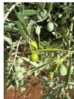
11 (Envero, amarillo)