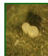
Puesta de heliotis

La media provincial de larvas pequeñas/hectárea aumenta hasta 1400 ( 1020 % la semana anterior ), su presencia se observa en el 100 % de las ECBs muestreadas .