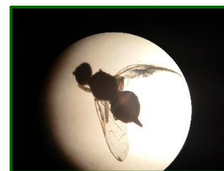
Observación de hembra de mosca en lupa

Es importante la presencia de plantas huésped como Olivarda ( Dittrichia viscosa ), alcaparrera ( Capparis spinosa ) y otros tipos de plantas, así como setos en las lindes, que pueden servir de reservorio para posibles parasitoides de la mosca del olivo, ayudándonos a minimizar su ataque.