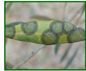
Hojas con repilo visible

El repilo del olivo ( Fusicladium oleagineum , antes Spilocaea oleagina ) es una enfermedad fúngica que afecta principalmente a las hojas del olivo, aunque en casos severos también puede dañar brotes y peciolo. El hongo penetra a través de los estomas y desarrolla su micelio en el interior de la hoja, donde forma manchas