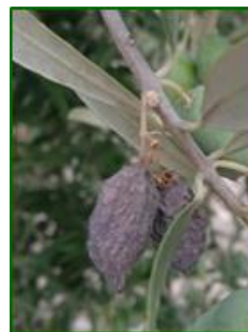
Fruto dañado por adulto de barrenillo

Continuamos realizando un muestreo puntual en todas las parcelas que conforman la Red de Alerta para realizar el seguimiento de los adultos del Barrenillo del olivo ( Phloeotribus scarabaeoides ). Para ello se realizarán observaciones del % de brotes afectados. El daño se debe a las galerías de alimentación de los adultos las cuales provocan la seca y posterior caída de hojas, frutos y ramitas productivas.