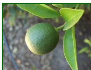
"J" Fruto al 40% de desarrollo"

El estado fenológico dominante es J "Fruto al 40% de desarrollo" en el 100% de las estaciones muestreadas.