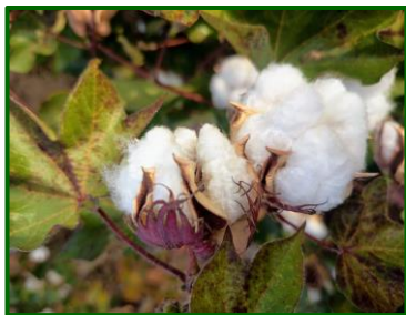
"A" Cápsulas abiertas

La fenología nos muestra como estado dominante en el cultivo "G" ( cápsulas grandes ) con una media provincial de 782500 cápsulas grandes por hectárea, también tenemos presentes los estadios "A" ( cápsulas abiertas ) con 548500 y "P" ( cápsulas pequeñas ) con 234000 cápsulas pequeñas por hectárea. Todas las zonas biológicas muestreadas presentan los estadios anteriormente mencionados.