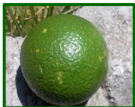
Daños por Mosquito verde

Continúa aumentando la presencia de frutos atacados por este agente al 61,11 % de las parcelas muestreadas, sobre un total de 18 . La media provincial esta semana es de 0,83 % de frutos atacados, valor muy similar respecto al de la semana anterior que fue de 0,85 % . Los daños de este agente se aprecian en la zona biológica de La Vega .