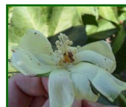
Larva en farolillo

Por Zonas Biológicas Santaella supera la media provincial con 5,40 adultos/trampa y día .