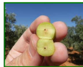
Ataque de larva generación carpófaga

Se continúa realizando el muestreo puntual en todas las parcelas que conforman la Red de Alerta para hacer un seguimiento del estado en que se encuentran los frutos, observando la incidencia que han tenido las larvas de la generación carpófaga de la polilla del olivo ( Prays oleae ) , que penetraron al interior del hueso del fruto durante el mes de junio y julio. Una vez penetran las larvas en el interior del hueso antes de que este se endurezca. Durante el verano se alimentan de la semilla hasta que a mediados del mes de septiembre se inicia su salida de la aceituna para terminar crisalidando en el suelo.