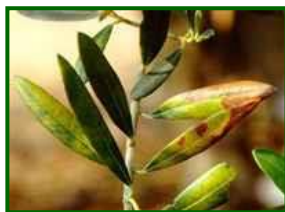
Hojas con síntomas de repilo plumizo

A partir de mediados del mes de agosto hasta primeros de septiembre se realizará una observación sobre repilo plumizo ( Pseudocercospora cladosporioides ), que serán tratados y expuestos en este apartado. Se realizará sobre todas las estaciones de control y zonas biológicas.