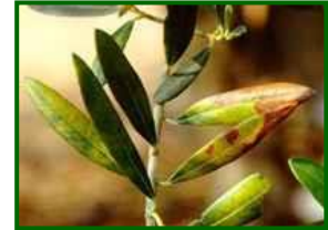
Hojas con síntomas de repilo plumizo

Las lluvias caídas y las previstas, unido a unas temperaturas suaves, pueden favorecer el desarrollo del patógeno.