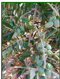
"H" (Endurecimiento de hueso)

En las zonas biológicas de olivar esta semana, las temperaturas máximas han estado en los 25 °C en todas las zonas: Subbética, La Campiña y Sierra Morena , las mínimas variaron entre los 13 °C de Subbética y Sierra Morena y 14 °C de La Campiña . La temperatura media ha estado en torno a los 19 °C. La humedad relativa media ha estado en valores superiores al 70 %. Las precipitaciones durante este periodo han sido muy variables desde los 12 litros/m 2 de la Subbética , los 35 litros/m 2 de Sierra Morena , o los 44 litros/m 2 de La Campiña , de media en cada zona. Se pueden consultar estos datos en la tabla de datos meteorológicos .