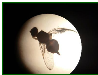
Observación de hembra de mosca en lupa

La mosca del olivo es una de las plagas de mayor importancia en el cultivo del olivar, afectando tanto al rendimiento como a la calidad del aceite obtenido. Dependiendo de cuál sea el destino de la aceituna, el Reglamento de Producción Integrada establece una tolerancia diferente. Para la aceituna cuyo destino es la almazara se permite un cierto porcentaje de fruto afectado, mientras si su destino es el aderezo, un fruto picado no sirve. Es por este motivo, que debemos prestar una especial atención en los olivares de verdeo.