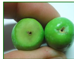
Orificio de salida prais carpófaga

zonas de Campiña Alta Oriental II con 28 , Campiña Alta Oriental I con 13 y Sierra Morena Oriental con 13 , Sierra Morena oriental con 14 , Subbética Central con 18 y Subbética Septentrional con 14,40 aceitunas caídas. Si observamos las aceitunas caídas prais/árbol la media provincial se sitúa en 1,32 , destacando la zona de Campiña Alta Oriental II con 8 , Campiña alta Oriental I con 2,70 y Sierra Morena Oriental con 4 aceitunas caídas.