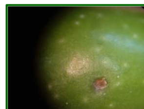
Picada de mosca

El dato de las picadas con mosca viva se mantiene similar respecto a la semana anterior alcanzando el valor de 1,68 % de media provincial ( 1,74 % la semana anterior ). La zona biológica de Campaña Alta Oriental II con 4,75 % , Subbética Central con 7 % , Subbética Septentrional con 2,79 % y Subbética Meridional con 9 % se mantienen como las zonas biológicas con mayor picada con mosca viva. El porcentaje de parcelas afectadas es del 56,44 % de las ECBs muestreadas.