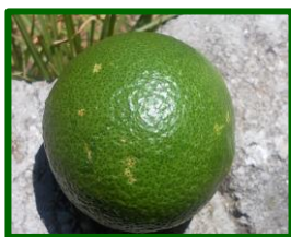
Daños por Mosquito verde

Se mantiene la presencia de frutos atacados por este agente en el 85 % de las ECBs . La media provincial esta semana desciende levemente hasta 1,46 % de frutos atacados (1,68 % la semana anterior) .