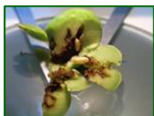
Galerías y pupas de mosca

El dato de las picadas con mosca viva se mantiene similar respecto a la semana anterior alcanzando el valor de 1,68 % de media provincial ( 1,74 % la semana anterior ). La zona biológica de Campaña Alta Oriental II con 4,75 % , Subbética Central con 7 % , Subbética Septentrional con 2,79 % y Subbética Meridional con 9 % se mantienen como las zonas biológicas con mayor picada con mosca viva. El porcentaje de parcelas afectadas es del 56,44 % de las ECBs muestreadas.