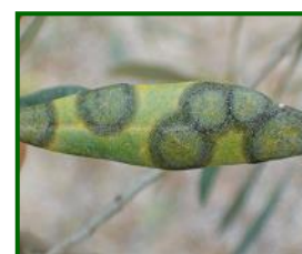
Hojas con repilo visible

La media provincial de % de hojas con repilo visible se situó en el 1,28 % (dato inferior al del muestreo realizado el año pasado, en el mismo periodo, que se situaba en el 1,50 % de hojas con repilo visible) , con zonas que superan la media provincial: Campiña Baja Oriental, Campiña Baja Occidental Sierra Morena Central, Subbética Central, Subbética Septentrional y Subbética Meridional . Su presencia se detectó en el 66,07 % de las ECBs.