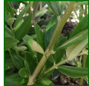
Larva de crisopa

Las larvas de este agente depredan tanto los huevos como las pequeñas larvas de polilla del olivo, por lo que es conveniente observar los niveles de depredación para considerar o no un posible tratamiento.