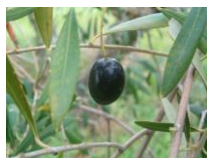
J1 (fruto maduro pulpa blanca)

21 °C y mínimas entre los 13 °C y los 8 °C, en la zona de la Subbética las temperatura máximas rondarán entre los 21 °C y los 19 °C y las mínimas entre los 11 °C y los 8 °C y en la zona de Sierra Morena las temperaturas máximas variarán desde los 21 °C y los 18 °C, situándose las mínimas entre los 11 °C y los 6 °C. Las humedades relativas máximas variaran desde el 85 al 100% dependiendo de las zonas. Existe riesgo de precipitaciones en todas las zonas con probabilidad variable según las zonas. Los vientos serán flojos a moderados con dirección variable en todas las zonas y la presencia de periodos de calma según zonas. Hay probabilidad de brumas matinales y de tarde, según las zonas y días.