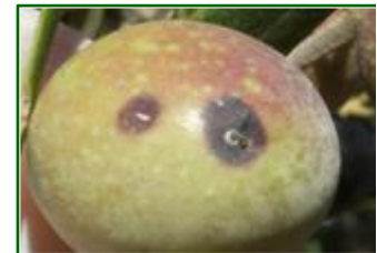
Aceituna con Parlatoria

Los datos recibidos hasta la fecha, de un total de 83 ECBs, en el 2,41 % de estaciones se observa la presencia de esta plaga. Comparando con los datos recibidos la campaña anterior, el porcentaje de estaciones con presencia fue de 3,23 % algo superior a este año.