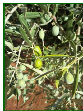
I1 (Envero, amarilleo)

Los estados fenológicos dominantes son en el 2,80 % de las parcelas de control "H" (endurecimiento del hueso), en el 50,47 % es I1 (envero, Amarilleo) , en el 35,51 % I2 (envero, manchas rojas) y en el 11,21 % J1 (fruto maduro pulpa blanca) .