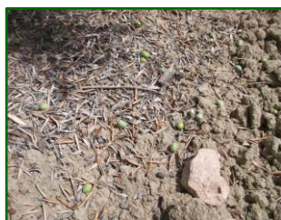
Caída de San Miguel

Los primeros datos recibidos nos arrojan una media de un 78,72 % de estaciones afectadas, la media provincial de aceitunas caídas total/árbol es de 8,37 , destacando las