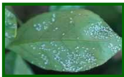
Colonia de mosca blanca

No se observa la presencia de esta plaga en los muestreos realizados en 19 estaciones de control.