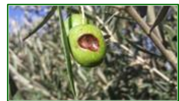
Escudete en aceituna

Los datos obtenidos de un total de 60 ECBs de las que se han recibido datos, en el 33,33 % de las estaciones se observa la presencia de esta plaga. El año pasado la presencia de escudete fue sensiblemente inferior, registrándose en el 13,89 % de las estaciones.