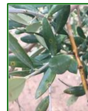
Lepra en hojas

Los datos recibidos hasta la fecha, de un total de 70 ECBs, en el 1,43 % de las estaciones se observa la presencia de esta plaga. La campaña pasada no se observó presencia de este agente ninguna estación de control.