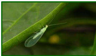
Adulto de crisopa

En cuanto a la actividad de los insectos auxiliares se detecta esta semana presencia de adultos de crisopa con una media provincial inferior a la de la semana anterior. La media provincial desciende hasta 0,32 adultos por trampa y día.