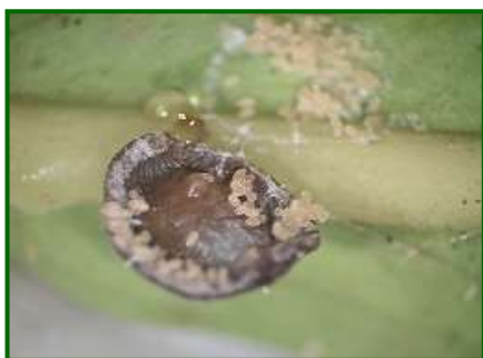
Hembra con puestas

Como viene siendo habitual, de pasadas campaña a mediados de junio se realizó un muestreo específico para valorar la presencia de este agente sobre el olivar en la provincia, como resultado de las observaciones realizadas no se ha encontrado presencia de ataque sobre el cultivo en ninguna de las parcelas de seguimiento.