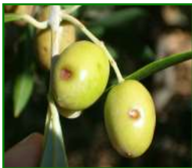
Aceitunas con escudete

La incidencia de escudete ( Camarosporium dalmaticum ), es más acusada en aquellas parcelas en donde la incidencia de mosca del olivo ( Batrocera oleae ) es más alta.