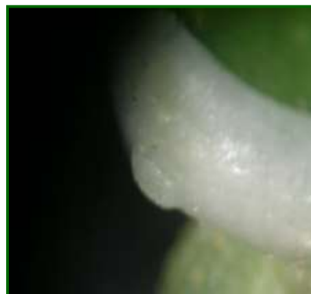
Puesta Prays carpófaga

Por otra parte, las Zonas Biológicas de Sierra Cazorla, Campiña Norte y Sierra Sur, han sido las que menos población de adultos han registrado, logrando sus máximos valores medios de 18.52, 18.89 y 32.42 adultos/polillero y día, respectivamente, registrados en la primera decena de mayo en las tres zonas.