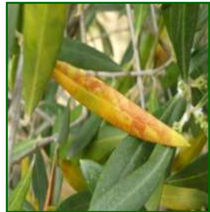
Hoja con síntomas

En referencia a los controles fitosanitarios realizados contra este agente, se efectuaron en el 1.33% de las parcelas muestreadas, (0.67%, la pasada campaña) lo que supone el 1.52% de los tratamientos realizados al cultivo; mientras que, para la realización de estos tratamientos se han utilizado los productos, Oxido cuproso y en menor medida Difenoconazol y Trifloxistrobin.