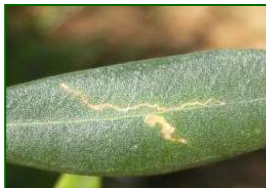
Ataque de larva Prays filófaga

Por Zonas Biológicas, ha presentado una mayor incidencia en Mágina Norte, Mágina Sur y Loma Alta, alcanzando unos valores máximos de 25.64, 15 y 12.30% de brotes afectados con formas vivas, respectivamente, produciéndose estos registros a primeros de la tercera decena de marzo en la primera y segunda zona, mientras que, en la tercera zona se registra a finales de la primera decena de marzo.