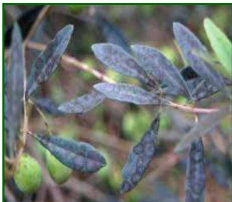
Hoja con síntomas

En cuanto al repilo ( Fusicladium oleagineum ), su presencia sobre el cultivo ha tenido unos niveles medios, observándose daño de este agente en el 72.46% de las 236 estaciones de control muestreadas, (la campaña anterior fue 68.37%).