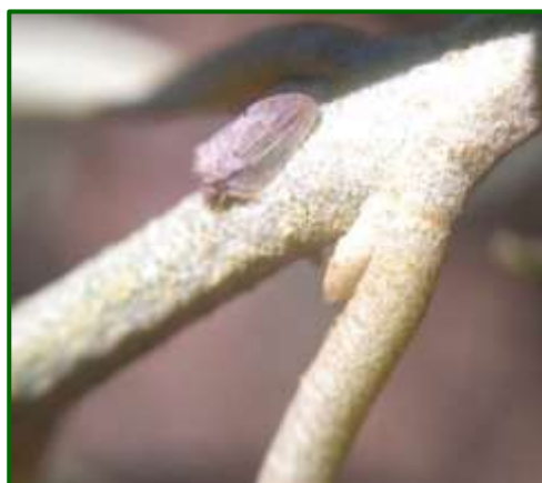
Adulto de algodoncillo

Por Zonas Biológicas, han destacado por los niveles medios más elevados, las Zonas Biológicas de Sierra Segura, Loma Alta y Loma Baja, con un valor medio de 43, 27 y 26% frutos con presencia de masa algodonosa o insectos, respectivamente, detectado en la segunda decena de mayo para las tres zonas.