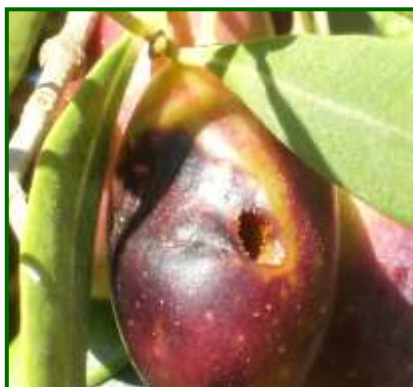
Orificio de salida

Se ha observado presencia de adultos de este agente en las trampas Macphail en el 97.91% de las 287 estaciones de control muestreadas, (99.65%, la pasada campaña).