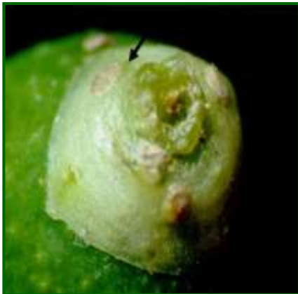
Puesta Prays carpófaga

En cuanto a la actividad de la tercera generación, la carpófaga , en general ha tenido una incidencia alta sobre el cultivo, realizándose los muestreos durante el periodo de cuajado de frutos. Los primeros frutos afectados se comienzan a detectar a primeros de la segunda decena de mayo, mientras que, en la campaña anterior se apreció a mediados de mayo.