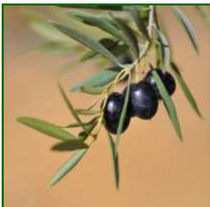
J 2 (Fruto maduro, pulpa roja)

La presencia de estos dos anteriores estados fenológicos viene motivada principalmente, por el estado de estrés hídrico que padece el cultivo, apreciándose en el cultivo amarilleamiento en la masa foliar, hojas abarquilladas y frutos arrugados.