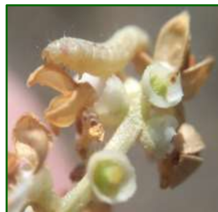
Larva Prays antófaga

Por Zonas Biológicas, las que han registrado mayor incidencia han sido, Sierra Ahillos y San Pedro, Condado y Loma Alta, con unos valores medios máximos de 25.20, 17.82 y 16.12% de inflorescencias atacadas con formas vivas,