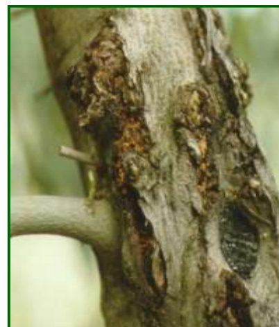
Excrementos de larvas

En referencia a los tratamientos fitosanitarios , no se han registrado ninguna operación contra este agente en las parcelas de observación.