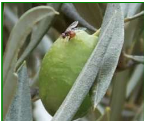
Adulto realizando puesta.

La actividad de los adultos de mosca del olivo ( Bactrocera oleae ), se aprecian con los primeros síntomas de ataque sobre el cultivo en áreas de las Zonas Biológicas de Campiña Sur y Loma Alta, en la última semana de junio, seguida por Loma Baja, en la primera decena de julio, y a finales de julio en Sierra Sur, generalizándose la picada a mediados de octubre en el resto de zonas. Por otra parte, la pasada campaña se inició la incidencia de este agente en Loma Baja, en la última semana de junio, seguida por Campiña Sur, Mágina Norte, Sierra Sur y Sierra Morena, a finales de la primera decena de julio, encontrándose picada en la primera mitad de agosto en el resto de zonas a excepción de Mágina Sur que es detectada a finales de la primera decena de septiembre.