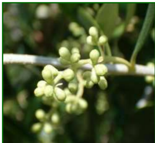
D 2 (Despliegue corola)

Las lluvias no vuelven a hacer acto de presencia hasta la segunda mitad de septiembre , con el paso de un frente nuboso, y siendo generalizadas en toda la provincia. Oscilando las mismas entre los 34.15 l/mt 2 de Campiña Norte y los 5.20 l/mt 2 de Campiña Norte, siendo estas superiores comparándolas con los registros de la pasada campaña durante este mes, y que fluctuaron entre 30 l/mt 2 en Sierra Cazorla y los 1.60 l/mt 2 de Sierra Morena. Estos registros no han logrado sacar al cultivo del estrés hídrico que viene arrastrando durante los meses estivales.