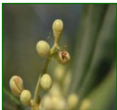
Daños en inflorescencia por larva de Prays antófaga

Por otra parte, las Zonas Biológicas de Sierra Segura, Campiña Norte y Condado, han sido las que menor incidencia han presentado, con unos valores medios más altos de 2, 5.36 y 5.57% de brotes afectados con formas vivas, respectivamente.