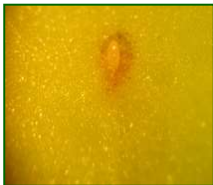
Huevo recién puesto

Comentar que las poblaciones de adultos , han estado presentes en el cultivo desde antes del inicio de su seguimiento, producida de forma generalizada en la provincia a partir de mediados de junio, siendo mínimas sus poblaciones. Durante los meses estivales a nivel provincial las poblaciones de adultos se han mantenido en unos niveles muy bajos, a causa principalmente por las olas de calor registradas, oscilando las poblaciones de adultos a lo largo de este periodo entre 0.27 y 1.75 adultos/placa y día.