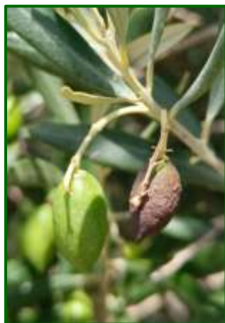
Desecación de frutos

En cuanto a las temperaturas máximas absolutas, se registran a finales del mes, siendo superiores a los alcanzados durante la pasada campaña, y obteniéndose máximos por encima de los 39°C en algunas de las Zonas Biológicas, destacan las estaciones meteorológicas situadas en Loma Baja, Campiña Norte y Campiña Sur, con una temperatura máxima absoluta de 39.95, 39.32 y 37.96°C, respectivamente, mientras que, la pasada campaña registraron unos valores en Sierra Morena, Sierra Segura y Sierra Cazorla, con una temperatura máxima absoluta de 39.52, 36.75 y 36.21°C, respectivamente.