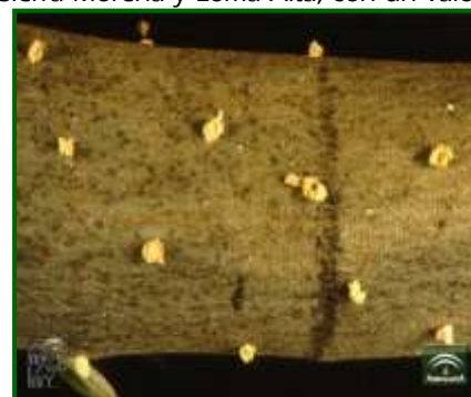
Orificios de galerías con serrín

El máximo de salida de adultos se observa a finales de junio, descendiendo el vuelo en las semanas siguientes., (la pasada campaña se detectó en las mismas fechas).