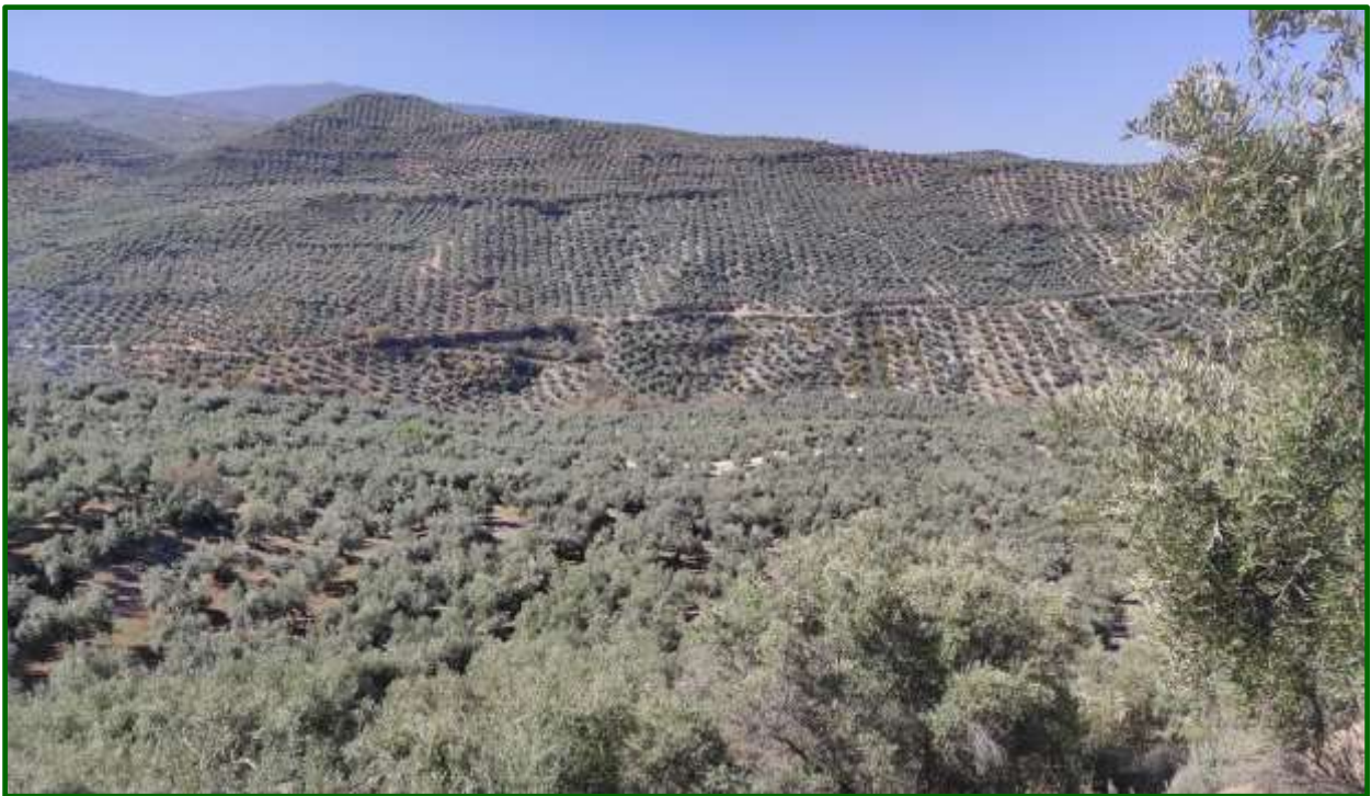
Plantación de Olivar.

La presente campaña se ha caracterizado por una actividad vegetativa del cultivo limitada por las escasas lluvias apreciadas durante el periodo de invierno, los notables registros de precipitaciones en primavera y las olas de calor con altas temperaturas registradas durante los meses estivales.