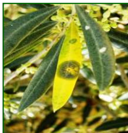
Hoja con síntomas

Destacan por su presencia las Zonas Biológicas de Campiña Norte, Sierra Sur y Loma Baja, con un valor medio de 1.30, 1.50 y 1.70% de hojas afectadas con repilo incubado, respectivamente.