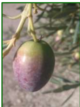
I2 (Envero manchas rojas)

En lo relativo a las temperaturas medias han sido inferiores tanto los valores más bajos como los más elevados, respecto a la pasada campaña, destacan los valores obtenidos en las siguientes Zonas Biológicas y que han fluctuado en Mágina Norte entre 21.76 y 5.51°C, Campiña Sur, entre 21.22 y 6.51°C y Sierra Ahillos y San Pedro entre 18.88 y 4.19°C. En referencia a estos datos, los más bajos se registran a primeros de la tercera decena de mes, mientras que, los más altos se obtienen a primeros de la segunda decena de mes.