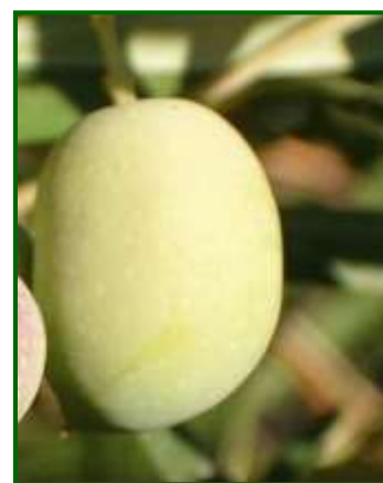
I1 (Envero amarillo)

Durante el mes de noviembre , se registran precipitaciones a lo largo de todo el mes, siendo notables los valores acumulados y que han ido acompañados por un descenso de las temperaturas.