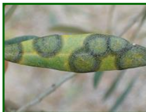
Hoja con síntomas

Actualizando los datos de repilo incubado el total de estaciones muestreadas hasta el momento de la realización del informe, es de 41 ECBs y nos indica un valor medio provincial de 3,82 % de repilo incubado respecto al total de hojas afectando el 100 % de las ECBs . Las zonas biológicas en general están muy afectadas, destacando las zonas de Subbética y Campiña , con valores muy altos que incluso superan el 4 % de hojas con repilo incubado respecto al total de hojas .