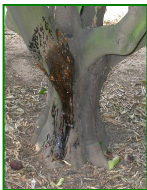
Síntomas de Gomosis

El % de frutos afectados con este agente desciende de manera notable hasta el 0,19 % de media provincial (1,07 % la semana pasada), detectándose su presencia en el 13,33 % de las 30 ECBs muestreadas (5,88 % la semana pasada). La zona biológica de La Vega es donde se detecta la presencia de daños por este agente con un valor de 0,22 % (1,28 % la semana pasada).