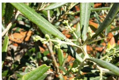
Estado fenológico "D1"

La previsión meteorológica para la próxima semana nos indica unas temperaturas máximas en la zona de la Campiña de máximas comprendidas entre los 25 °C y los 22 °C y mínimas entre los 11 °C y los 6 °C, en la zona de la Subbética las temperaturas máximas rondarán entre los 20 °C y los 15 °C y las mínimas entre los 7 °C y los 3 °C y en la zona de Sierra Morena las temperaturas máximas variarán desde los 21 °C y los 17 °C, situándose las mínimas entre los 8 °C y los 3 °C. Las humedades relativas máximas variarán desde el 50 al 90 % dependiendo de las zonas. No existe riesgo de precipitaciones. Los vientos serán flojos o moderados con dirección variable, predominando N o NE en todas las zonas y la presencia de cortos periodos de calma.