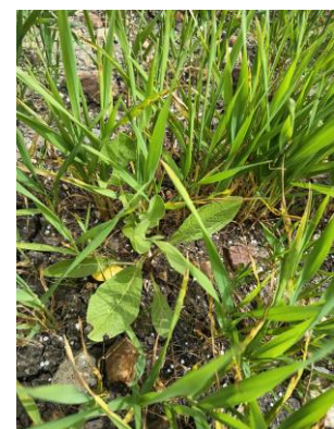
Planta de centaura en trigo

En cuanto a la aplicación de abonos de cobertera , se continúa realizando.