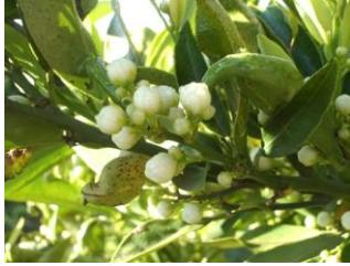
"C" Aparición botones"

La previsión meteorológica para la próxima semana se espera unas temperaturas máximas con valores en torno a los 27-22 °C, las mínimas se situarán en torno a los 11-6 °C. La humedad relativa máxima se situará entre el 45-95 % y la humedad relativa mínima de situará entre el 20-35 %. Los vientos serán de flojos a moderados con dirección variable. La probabilidad de lluvias será del 0 % durante toda la semana. No se prevén alertas meteorológicas por fenómenos adversos durante esta semana.