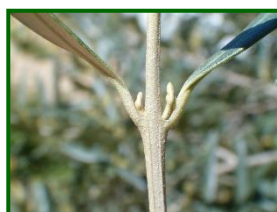
Estado fenológico "B"

En las zonas biológicas de olivar esta semana, las temperaturas máximas han diferido desde los 17,72 °C de la Subbética hasta los 19 °C de La Campiña y Sierra Morena , las mínimas se situaron en torno a los 7-9 °C en todas las zonas de la provincia. La temperatura media ha estado entre los 12 °C de la Subbética y los algo más de 13 °C de la Campiña y Sierra Morena. La humedad relativa media ha estado en torno a valores de 52-55 %.