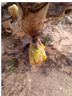
Estado fenológico "D" (Hojas incipientes)

El estado fenológico dominante es D "Hojas incipientes" en el 91 % de las ECBs muestreadas, mientras que en el 9 % restante el estado dominante es E "Hojas extendidas" .