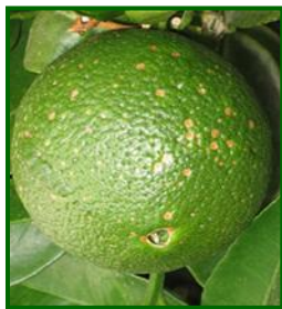
Fruto afectado Piojo Rojo de california

En nuestra zona de cultivo, al piojo rojo de California (PRC) se le ha calculado una constante térmica generacional de 600 grados día acumulados partiendo de un umbral inferior de desarrollo de 11.7 °C . Así, sumando los grados días acumulados a partir del máximo de Formas Sensibles (L1+L2) correspondientes a la 1ª generación se puede prever el de la 2ª generación y así sucesivamente con la 3ª y posible 4ª e incluso 5ª generación. También es posible prever el máximo de Formas Sensibles (L1+L2) de cualquier generación monitoreando el vuelo de machos mediante placas engomadas con feromona, y es que, entre el máximo del vuelo de machos y el máximo de Formas Sensibles (L1+L2) hay una diferencia en torno a los 300 grados acumulados según datos históricos en nuestra zona de cultivo.