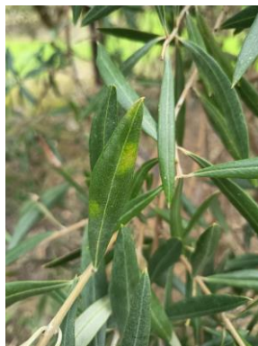
Hojas con síntomas