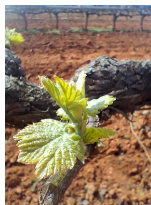
Estado fenológico "E" (Hojas extendidas)

Esta semana las temperaturas máximas han estado entorno a los 20 °C, y las mínimas en torno a los 8 °C. La temperatura media ha estado en torno a los 13,50 °C. La humedad relativa máxima ha estado en torno al 84 % , la media en torno al 62 % y la mínima en torno a 38 % . Los vientos han sido flojos en general. Y las precipitaciones han mínimas de 0,1 litros/m 2 de media. Sigue habiendo una amplitud térmica (diferencia de temperatura entre la máxima y la mínima) cercana a los 12 °C.