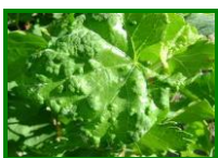
Erinosis (raza de las agallas)

No se detecta la presencia de daños por este agente en las 11 estaciones de control muestreadas.