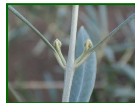
Estado fenológico "C"

En las zonas biológicas de olivar esta semana, las temperaturas máximas han diferido desde los 17,72 °C de la Subbética hasta los 19 °C de La Campiña y Sierra Morena , las mínimas se situaron en torno a los 7-9 °C en todas las zonas de la provincia. La temperatura media ha estado entre los 12 °C de la Subbética y los algo más de 13 °C de la Campiña y Sierra Morena. La humedad relativa media ha estado en torno a valores de 52-55 %.