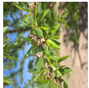
Estado fenológico "H" Fruto cuajado

Esta semana las temperaturas máximas se han situado en torno a los 20 °C y las mínimas en torno a los 9 °C . En cuanto a la humedad relativa , la media se ha situado en torno al 75 % , estando la media de la humedad relativa máxima cercana al 95 % y la media de la humedad relativa mínima ha estado en torno al 55 % . Las precipitaciones han ocurrido con carácter débil, acumulando en el periodo en torno a 8 litros/m 2 de media. Los vientos han sido flojos durante el periodo de observación. La oscilación térmica (diferencia entre la temperatura diurna y nocturna) ha estado en torno a 10 °C .