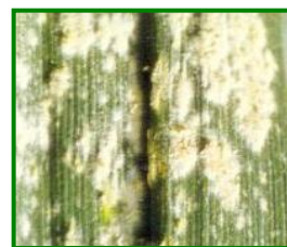
oidio en hoja

Este hongo se puede encontrar en todas las partes aéreas del cultivo, hojas, tallos y espigas, pero las hojas son normalmente las más afectadas. Los primeros síntomas visibles son colonias de micelios y conidias en la superficie de las hojas y demás órganos de la planta. Las cálidas temperaturas diurnas junto a la humedad en hojas y suelo, incrementan el daño de esta enfermedad en el trigo. Cuando la fenología está entre ahijado y preñado, el umbral de intervención es > 20 % de superficie de planta con micelio. Zonas dentro del cultivo, con una elevada humedad relativa en el ambiente, (75-100%) y parcelas con elevada densidad de plantación, favorecen el desarrollo y proliferación de este agente.