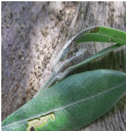
Generación filófaga: larva y daño

Es importante extremar la vigilancia en plantaciones jóvenes y en las intensivas; conviene consultar a su asesor si su explotación tiene estas características.