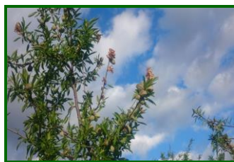
Daño en brotes

Se mantiene la presencia de daños por este agente en el 20 % de las ECBs muestreadas , con una media provincial del 0,20 % de brotes afectados .