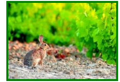
Conejo en viñedo

En las observaciones realizadas en las ECBs de las distintas zonas biológicas, se observa la presencia de daños en el 100 % , con una valor medio de % de cepas afectadas del 17,27 % . Si hacemos referencia al dato por zonas biológicas , los daños aparecen en el 100% de zonas biológicas, la mayor incidencia es en la zona de Las Arenas con un 23,33 % de cepas afectadas, mientras que en las zonas de La Sierra y Los Llanos el % de cepas afectadas es del 15% . En este agente los datos se repiten con respecto a la semana pasada.