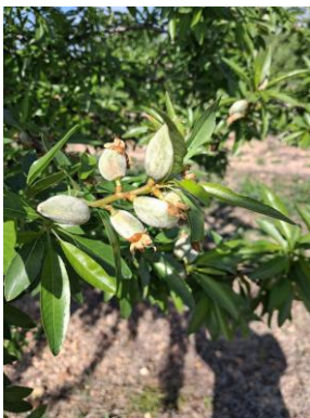
Estado fenológico "I" Fruto joven

El estado fenológico dominante es I "Fruto joven" en el 100 % de las estaciones de control biológico .