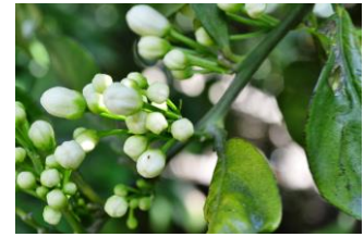
D "se ve la corola"

La previsión meteorológica para la próxima semana se espera unas temperaturas máximas con valores en torno a los 27-22 °C, las mínimas se situarán en torno a los 11-6 °C. La humedad relativa máxima se situará entre el 45-95 % y la humedad relativa mínima de situará entre el 20-35 %. Los vientos serán de flojos a moderados con dirección variable. La probabilidad de lluvias será del 0 % durante toda la semana. No se prevén alertas meteorológicas por fenómenos adversos durante esta semana.