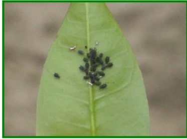
Colonia de A. gossypii

Son un grupo de insectos que generalmente tienen importancia en el cultivo de los cítricos. En las colonias de los pulgones coexisten siempre inmaduros y adultos, tanto ápteros como alados. Los ápteros son de color uniforme, mientras que los alados se distinguen por presentar el tórax negro. En general los ápteros adultos de A. spiraecola y M. persicae son de color verde, mientras que los de T. aurantii y A. gossypii son de color oscuro, casi negro.