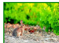
Conejo en viñedo

En las observaciones realizadas en las ECB de las distintas zonas biológicas, se mantiene la presencia de daños de este agente en el 100 % , con una valor medio de % de cepas afectadas del 12,73 % (16,36 % la semana anterior) . Si hacemos referencia al dato por zonas biológicas , los daños aparecen en el 100% de zonas biológicas. Por zonas biológicas los datos son: Las Arenas con un 10 % de cepas afectadas, en La Sierra con un 15 % de cepas afectadas y en Los Llanos el % de cepas afectadas es del 13,33 % .