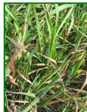
Síntomas de la Mancha

Respecto a la Mancha Borrosa : Es una especie de Helminthosporium que puede afectar a variedades de trigo concretas. Las lesiones son marrones sin contornos definidos (borrosa), de forma oval o redondeadas (elípticas). Las principales fuentes de inóculo son las semillas infectadas y el rastrojo. Para la infección foliar se requieren temperaturas de 20-25 °C y humedad relativa elevada durante 15 horas.