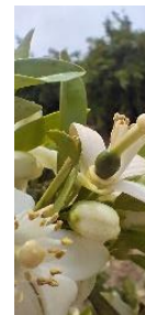
G "Caída de pétalos"

En las zonas biológicas de cítricos esta semana, las temperaturas máximas han tenido valores en torno a los 30 °C , y las mínimas en torno a los 11,50 °C . La temperatura media ha estado en torno a los 20,50 °C . La humedad relativa media ha estado en torno al 54 % , con valores máximos superando el 87 % . Las precipitaciones durante este periodo han sido casi imperceptibles alcanzando los 0,09 litros/m 2 de media en todas las zonas biológicas. Se pueden consultar estos datos en la tabla de datos meteorológicos .