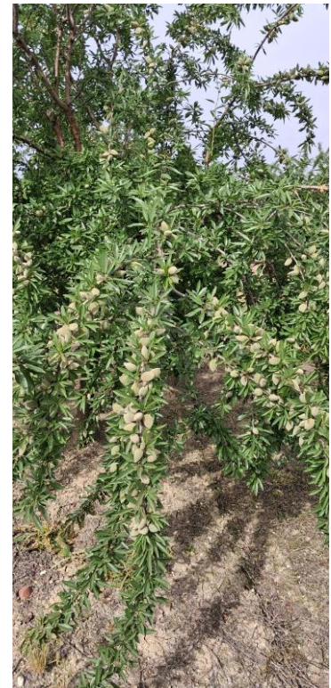
Estado fenológico "J" Fruto desarrollado

Con la llegada la primavera se debe realizar el control de las cubiertas vegetales, la finalidad de esta actuación es reducir la competencia de la cubierta con el cultivo por los nutrientes y el agua del suelo. Labor que se está desarrollando durante estas semanas en la mayoría de las explotaciones de almendro mediante el desbrozado mecánico o laboreo superficial y perpendicular.