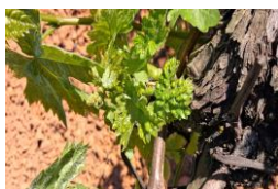
Erinosis (raza de las agallas)

No se detecta una semana más la presencia de daños por este agente en las 11 estaciones de control muestreadas.