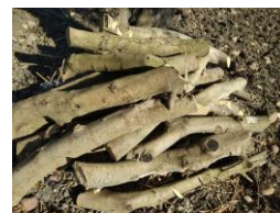
Batería de palos cebo

Se está procediendo a la colocación de las baterías de palos cebo para seguir la entrada de adultos, donde realizarán la puesta y las larvas permanecerán alimentándose hasta llegar a adulto, momento en el que abandona el palo cebo y se desplaza hacia la copa del olivo. Los daños de esta plaga se producen el momento de su llegada a la copa desde el palo cebo, afectando tanto a brotes como a frutos. Estos daños afectan a la cosecha actual (caída de fruto) y a la siguiente (brotes en crecimiento debilitados por su base que se rompen y caen).