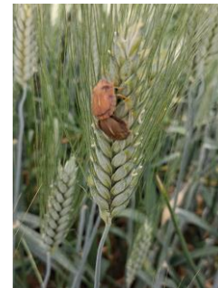
Adultos de paulillón

Se detectan individuos de paulillón en el 79,31 % (64,29 % en el anterior periodo de observación) de las 29 ECB muestreadas, con un aumento de la media provincial de 0,91 adultos+ninfas/m 2 (0,67 en el anterior periodo de observación). Por zonas biológicas los datos son los siguientes: Campiña Baja Occidental , con una media de 1,10 , la Campiña Baja Central con 0,85 y la Campiña Baja Oriental con 1,07 adultos+ninfas/m 2 .