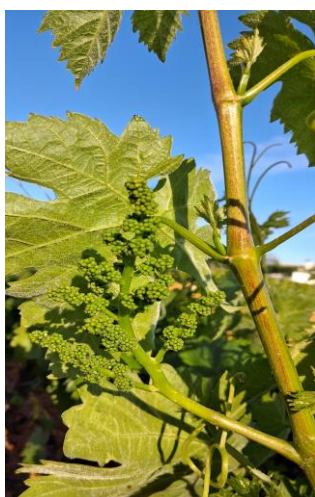
Estado fenológico "H" (Botones florales separados)

El estado fenológico dominante en el 100 % de las ECB es H "Botones florales separados" .