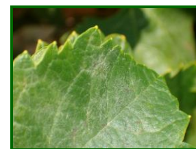
Oídio en hoja

Durante el frío, el hongo inverna en el interior de las yemas y también en los sarmientos, a la espera de condiciones favorables para su desarrollo. La propagación del hongo comienza en primavera y se extiende hasta el verano. En primavera, al comienzo de la brotación es normal que el hongo salga de su letargo y comience su propagación, y esta se extiende hasta el verano. De ahí la importancia de proteger el viñedo durante la etapa de prefloración y floración, sobre todo si se dan las circunstancias climatológicas favorables, ya que es un momento crucial para iniciar los tratamientos fitosanitarios que nos protejan de los efectos adversos del hongo.