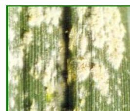
oídio en hoja

Este hongo se puede encontrar en todas las partes aéreas del cultivo, hojas, tallos y espigas, pero las hojas son normalmente las más afectadas. Los primeros síntomas visibles son colonias de micelios y conidias en la superficie de las hojas y demás órganos de la planta. Las cálidas temperaturas diurnas junto a la humedad en hojas y suelo, incrementan el daño de esta enfermedad en el trigo. Cuando la fenología está entre ahijado y preñado, el umbral de intervención es > 20 % de superficie de planta con micelio. Zonas dentro del cultivo, con una elevada humedad relativa en el ambiente, (75-100%) y parcelas con elevada densidad de plantación, favorecen el desarrollo y proliferación de este agente.