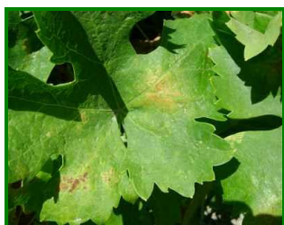
Hoja con síntomas

No se detecta una semana más la presencia de daños por este agente en las 11 estaciones de control muestreadas.