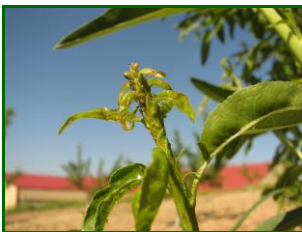
Colonia de pulgones

La media provincial de % de brotes ocupados por pulgones aumenta esta semana hasta 2 % (0,83 % la última observación) estando presentes en el 50 % de las ECB (33,33 % la semana pasada). Por zonas biológicas se detecta la presencia de este agente en todas con valores de % de brotes ocupados del 6 % en la Campiña Alta y 1,20 % en la Campiña Baja.