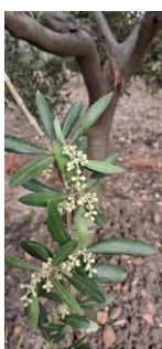
Estado fenológico "D3"

En las zonas biológicas de olivar esta semana, las temperaturas máximas han diferido desde los 23,77 °C de la Subbética hasta los 28-29 °C de la Campiña y de Sierra Morena , las temperaturas mínimas se situaron en torno a los 11-12 °C en todas las zonas de la provincia. La temperatura media ha estado entre los 17 °C de la Subbética y los 20 °C de la Campiña y los 19,50 °C de Sierra Morena . La humedad relativa media ha estado en torno a valores de 40-48 % . Las precipitaciones durante este periodo han sido casi imperceptibles con valores entre los 0-0,01 litros/m 2 . Los vientos han sido flojos esta semana. Se pueden consultar estos datos en la tabla de datos meteorológicos .