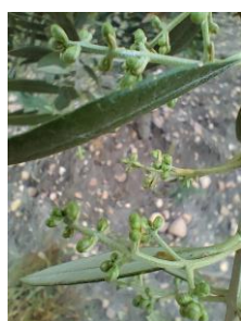
Estado fenológico "D2"

La previsión meteorológica para la próxima semana nos indica unas temperaturas máximas en la zona de la Campiña comprendidas entre los 29 °C y los 24 °C y mínimas entre los 15 °C y los 12 °C , en la zona de la Subbética las temperatura máximas rondarán entre los 25 °C y los 20 °C y las mínimas entre los 8 °C y los 12 °C y en la zona de Sierra Morena las temperaturas máximas variarán desde los 28 °C y los 22 °C , situándose las mínimas entre los 11 °C y los 12 °C . Las humedades relativas máximas variarán desde el 75 al 100 % dependiendo de las zonas. Existe riesgo de precipitaciones al principios y finales del periodo con probabilidades altas en ambos periodos. Los vientos serán flojos con dirección variable y la presencia de periodos de calma más probables en la zona de Sierra Morena .