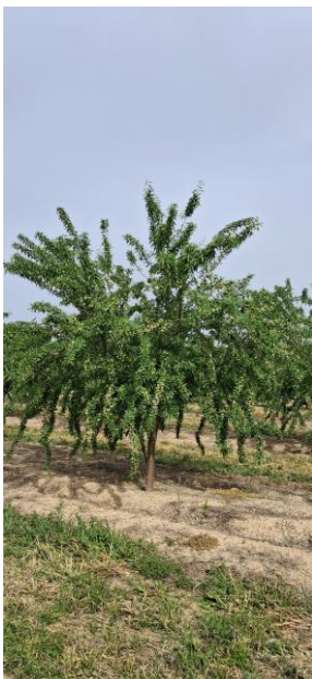
Almendro. Fruto desarrollado

El estado fenológico dominante es J "Fruto desarrollado" en el 100 % de las estaciones de control biológico.