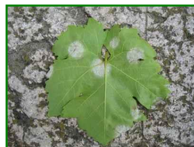
Síntomas de Mildiu

Dado el elevado nivel de incidencia registrado durante la campaña pasada, se espera una alta carga de inóculo invernante, tanto en el suelo como en restos vegetales infectados no incorporados o mal gestionados. Esta situación incrementa el riesgo de infecciones tempranas y obliga a extremar la vigilancia. Por ello, resulta fundamental intensificar los muestreos en estas fases del cultivo, realizando inspecciones periódicas, especialmente tras episodios de lluvia, y prestando atención a parcelas históricamente más sensibles o con condiciones de mayor humedad