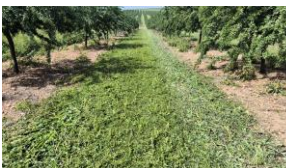
Desbrozado cubierta vegetal