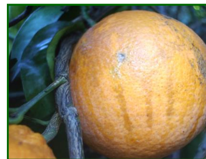
Síntomas de antracnosis en fruto

En el caso de C. gloeosporioides colonizador primario de tejidos dañados y senescentes en el campo provocando fuertes pérdidas en post cosecha . No es capaz de invadir tejidos sanos y no dañados. También puede causar una mancha en la corteza del fruto , especialmente en pomelo, en el campo. Esta mancha aparece como una decoloración superficial de color pardo rojizo, con frecuencia en forma de mancha de lágrima , que normalmente aparece tras un periodo de lluvias ligeras y prolongadas durante el invierno . Es fácilmente controlable de forma preventiva antes de que aparezcan las primeras lluvias de invierno .