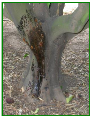
Síntomas de Gomosis

El % de frutos afectados con este agente es 0 % , de media provincial (0,07 % la semana pasada) , esta semana los datos recibidos han sido sobre 9 ECB (27 ECB la semana pasada) . Estos datos corresponden a las parcelas con variedades más tardías que aún quedan sin recolectar.