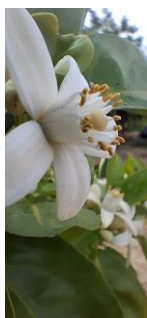
"F" Flor abierta

El estado fenológico dominante es F "flor abierta" en el 38,71 % de las estaciones muestreadas y G "caída de pétalos" en el 61,29 % de las ECB como estado dominante más adelantado.