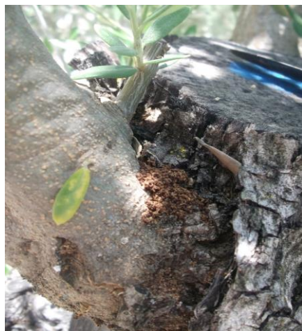
Excrementos de larvas

Las larvas de este lepidóptero pueden producir la muerte de ramas debido a las galerías alimenticias que efectúan en ellas y puede ser grave en plantaciones jóvenes.