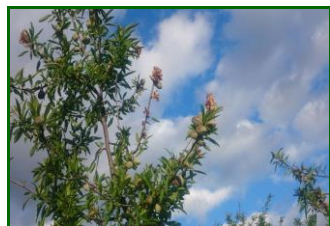
Daño en brotes

Lo daños provocados por este agente sobre brotes se va generalizando observándose ya en el 83,33 % de las ECB, valor que aumenta sensiblemente con respecto a la semana anterior que estaba situado en el 83,33 % . La media provincial desciende hasta el 1,33 % de brotes afectados (2 % la semana pasada). La zona biológica más afectada continúa siendo la Campiña Alta con un 3 % (4 % dato de la semana anterior) de brotes afectados . En el caso de la zona biológica de la Campiña Baja la presencia de brotes afectados desciende hasta el 1 % (1,60 % la semana pasada)