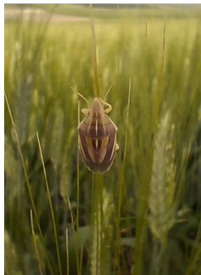
Adulto de paulilla

Continúa observándose la presencia de chinches del trigo en las estaciones de control biológico (ECB) de la provincia de Córdoba.