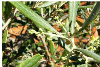
Estado fenológico "D1"

En las zonas biológicas de olivar esta semana, las temperaturas máximas han diferido desde los 23,77 °C de la Subbética hasta los 28-29 °C de la Campiña y de Sierra Morena , las temperaturas mínimas se situaron en torno a los 11-12 °C en todas las zonas de la provincia. La temperatura media ha estado entre los 17 °C de la Subbética y los 20 °C de la Campiña y los 19,50 °C de Sierra Morena . La humedad relativa media ha estado en torno a valores de 40-48 % . Las precipitaciones durante este periodo han sido casi imperceptibles con valores entre los 0-0,01 litros/m 2 . Los vientos han sido flojos esta semana. Se pueden consultar estos datos en la tabla de datos meteorológicos .