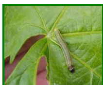
Larva de Piral

No se detecta una semana más la presencia de daños por este agente en las 11 estaciones de control muestreadas.