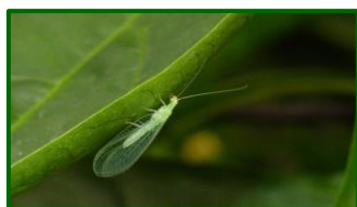
Adulto de crisopa

En cuanto a la actividad de los insectos auxiliares se detecta esta semana un aumento de la presencia de adultos de crisopa. La media provincial aumenta hasta 0,85 adultos por trampa y día.