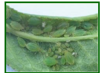
Colonia de pulgones

La media provincial de % de brotes ocupados por pulgones aumenta esta semana hasta 2 % (0,83 % la última observación) estando presentes en el 50 % de las ECB (33,33 % la semana pasada). Por zonas biológicas se detecta la presencia de este agente en todas con valores de % de brotes ocupados del 6 % en la Campiña Alta y 1,20 % en la Campiña Baja.