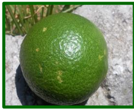
Daños por Mosquito verde

Esta semana la captura de adultos en trampas desciende hasta 0,04 por trampa y día (0,07 la semana pasada), las capturas se registran en el 20 % de las 5 ECB en las que se ha muestreado este agente ( 16,67 % la semana anterior), todas ellas situadas en la zona biológica de La Vega .