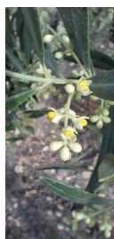
Estado fenológico "F"

En las zonas biológicas de olivar esta semana, las temperaturas máximas han diferido desde los 20 °C de la Subbética hasta los 24-25 °C de la Campiña y de Sierra Morena , las temperaturas mínimas se situaron en torno a los 12-13 °C en todas las zonas de la provincia. La temperatura media ha estado entre los 16 °C de la Subbética y los 18 °C de la Campiña y Sierra Morena . La humedad relativa media ha estado en torno a valores de 75-76 % . Las precipitaciones durante este periodo han sido variables con valores entre los 13 y 25 litros/m 2 . Los vientos han sido flojos esta semana. Se pueden consultar estos datos en la tabla de datos meteorológicos .