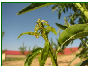
Colonia de pulgones

La media provincial de % de brotes ocupados por pulgones vuelve a aumentar esta semana hasta el valor de 2,33 % (2 % la semana anterior) manteniéndose la presencia en el 50 % de las ECB. Haciendo el análisis por zonas biológicas se detecta la presencia de este agente en todas con valores de % de brotes ocupados del 4 % en la Campaña Alta (6 % la semana pasada) y 2 % en la Campaña Baja (1,20 % la semana pasada).