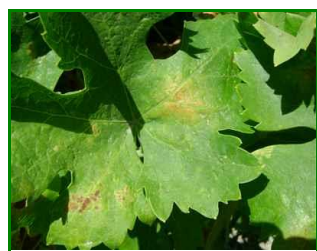
Hoja con síntomas

Una semana más en las observaciones realizadas en las ECB, no se observa presencia de daños por este agente.