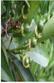
"11" Cuajado de fruto

La previsión meteorológica para la próxima semana se espera unas temperaturas máximas con valores en torno a los 25-28 °C , las mínimas se situarán en torno a los 10-13 °C . La humedad relativa máxima se situará entre el 80-100 % y la humedad relativa mínima de situará entre el 50-20 % . Los vientos serán flojos, con dirección oeste-suroeste y un breve periodo de calma al inicio de este periodo de observación. La probabilidad de lluvias durante el principio del periodo de observación se situará en torno al 50 % , el sábado 2 y domingo 3 de mayo, el resto de días la probabilidad de que ocurran será muy baja. No se prevén alertas meteorológicas por fenómenos adversos durante esta semana.