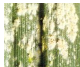
oídio en hoja

Este hongo se puede encontrar en todas las partes aéreas del cultivo, hojas, tallos y espigas, pero las hojas son normalmente las más afectadas. Los primeros síntomas visibles son colonias de micelios y conidias en la superficie de las hojas y demás órganos de la planta. Las cálidas temperaturas diurnas junto a la humedad en hojas y suelo, incrementan el daño de esta enfermedad en el trigo. Cuando la fenología está entre ahijado y preñado, el umbral de intervención es > 20 % de superficie de planta con micelio. Zonas dentro del cultivo, con una elevada humedad relativa en el ambiente, (75-100%) y parcelas con elevada densidad de plantación, favorecen el desarrollo y proliferación de este agente.