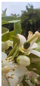
G "Caída de pétalos"

El estado fenológico dominante es G "caída de pétalos" en el 2,6 %, H "caída de estilos" en el 87,2 % y finalmente I1 "cuajado de fruto" en el 10,3 % de las ECB.