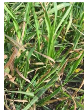
Síntomas de la Mancha

Aunque se localiza en todo el mundo, es en zonas con alta pluviometría donde su prevalencia es mayor. Las lesiones que produce tienen forma alargada u oval y generalmente son de color café oscuro. Al madurar la lesión, el centro se vuelve a menudo de un color que varía entre el café claro y el bronceado, rodeado por un anillo irregular de color café oscuro.