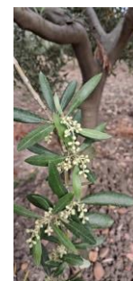
Estado fenológico "D3"

En las zonas biológicas de olivar esta semana, las temperaturas máximas han diferido desde los 20 °C de la Subbética hasta los 24-25 °C de la Campiña y de Sierra Morena , las temperaturas mínimas se situaron en torno a los 12-13 °C en todas las zonas de la provincia. La temperatura media ha estado entre los 16 °C de la Subbética y los 18 °C de la Campiña y Sierra Morena . La humedad relativa media ha estado en torno a valores de 75-76 % . Las precipitaciones durante este periodo han sido variables con valores entre los 13 y 25 litros/m 2 . Los vientos han sido flojos esta semana. Se pueden consultar estos datos en la tabla de datos meteorológicos .