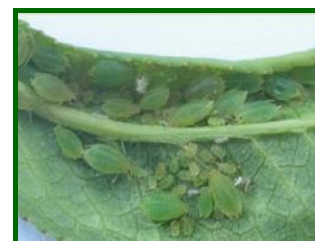
Colonia de pulgones

La media provincial de % de brotes ocupados por pulgones vuelve a aumentar esta semana hasta el valor de 2,33 % (2 % la semana anterior) manteniéndose la presencia en el 50 % de las ECB. Haciendo el análisis por zonas biológicas se detecta la presencia de este agente en todas con valores de % de brotes ocupados del 4 % en la Campaña Alta (6 % la semana pasada) y 2 % en la Campaña Baja (1,20 % la semana pasada).