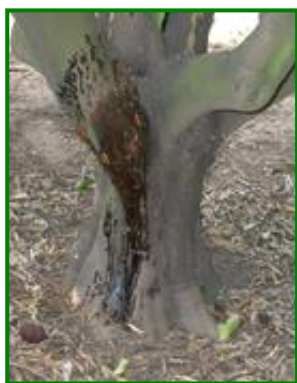
Síntomas de Gomosis

El % de frutos afectados con este agente es cero , esta semana los datos recibidos han sido sobre 15 ECB (9 ECB la semana pasada). Estos datos corresponden a las parcelas con variedades más tardías que aún quedan sin recolectar.