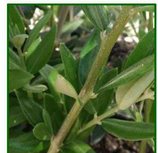
Larva de crisopa

Las larvas de este agente depredan tanto los huevos como las pequeñas larvas de polilla del olivo, por lo que es conveniente observar los niveles de depredación para considerar o no un posible tratamiento.