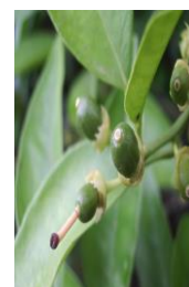
"H" Caída de estilos

En las zonas biológicas de cítricos esta semana, las temperaturas máximas han tenido valores en torno a los 26 °C, y las mínimas en torno a los 13 °C. La temperatura media ha estado en torno a los 19 °C. La humedad relativa media ha estado en torno al 71 %, con valores máximos superando el 95 %. Las precipitaciones durante este periodo han sido de 14,77 litros/m 2 de media en todas las zonas biológicas. Los vientos en todas las zonas han sido flojos. Se pueden consultar estos datos en la tabla de datos meteorológicos .