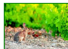
Conejo en viñedo

En las observaciones realizadas en las ECB de las distintas zonas biológicas, la presencia de daños de este agente se mantiene en el 100 % de estas, con un valor medio de % de cepas afectadas del 13,64 % (12,73 % la semana pasada) . Si hacemos el análisis a nivel de zonas biológicas , los daños aparecen en el 100% de zonas biológicas. Por zonas biológicas los datos son: Las Arenas con un 10 % de cepas afectadas , en La Sierra con un 15 % de cepas afectadas y en Los Llanos el % de cepas afectadas aumenta levemente hasta alcanzar el valor de 15 % (13,33 % la semana anterior) .