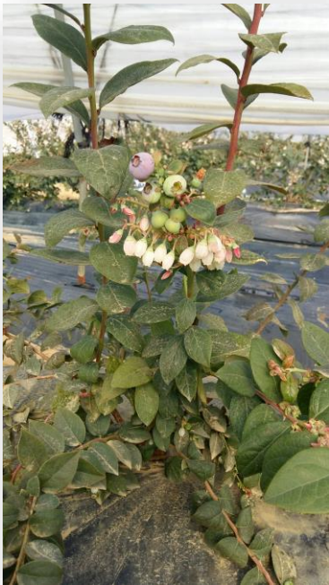
Figura 1. Arándano en producción

Durante la última década se ha producido en la provincia de Huelva un incremento del cultivo de frutos rojos. La necesidad de diversificar las producciones y atender las demandas del mercado han favorecido la expansión de los cultivos de arándano y frambuesa. El arándano ha sido el cultivo que ha sufrido una mayor expansión, aumentando su superficie en un 250% en los últimos 5 años.