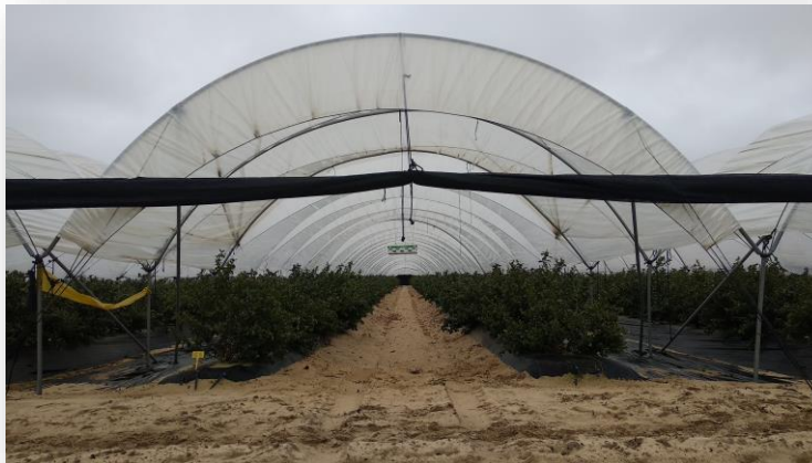
Figura 2. Invernadero de arándano en la provincia de Huelva

La programación racional del riego implica conocer la cantidad de agua a aplicar en base a las necesidades del cultivo y su momento de aplicación. Para ello, existen métodos basados en la monitorización del contenido de agua en el suelo mediante sondas de humedad y otros basados en la medida de la transpiración del cultivo mediante el método de la medida del flujo de savia. El método más usual para programar el riego viene siendo el recomendado por la FAO, basado en el balance de agua en el suelo (Doorenbos y Pruitt, 1977) 1 . La aplicación de una u otra tecnología depende de la capacidad técnica del personal encargado de los riegos, el valor de la producción, la respuesta del cultivo al riego y el coste de implantar la tecnología. Lo ideal es combinar una programación basada en balance de agua con la monitorización del contenido de humedad del suelo.