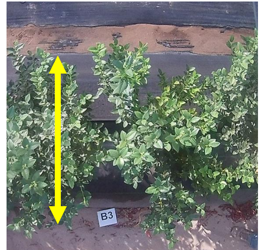
Figura 4. Ancho del dosel vegetal