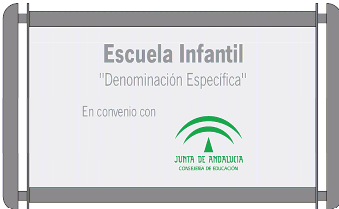
PLACA A PARED SP