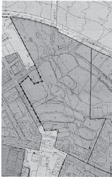
Plano de Situación.