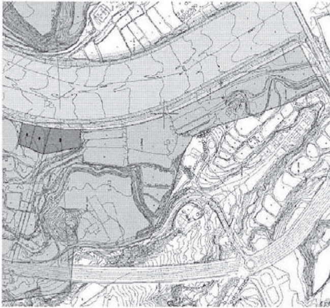
Plano de Situación.