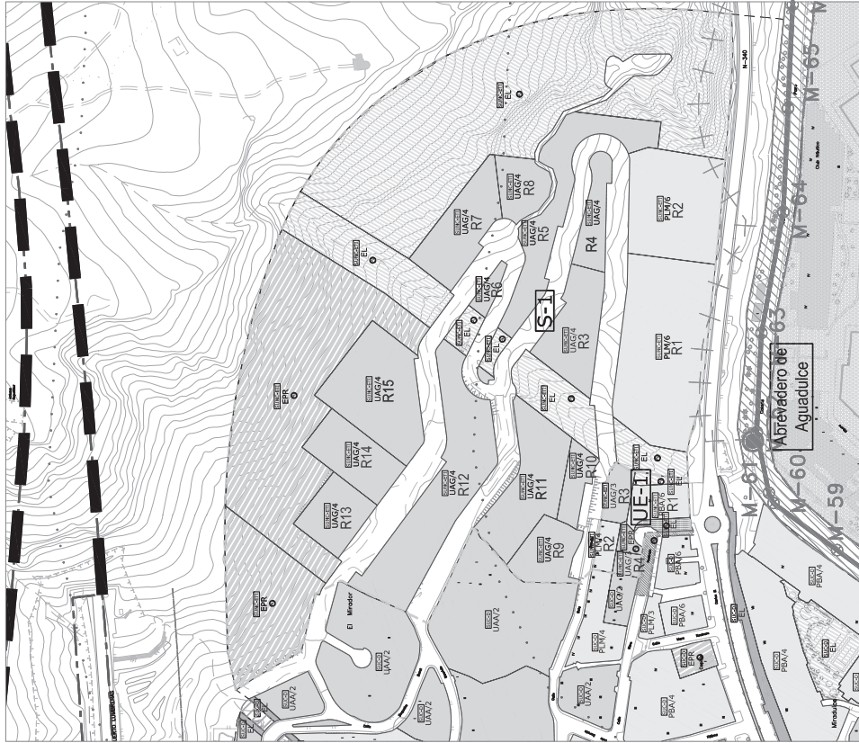
OTROS PARÁMETROS VINCULANTES DE ORDENACIÓN.