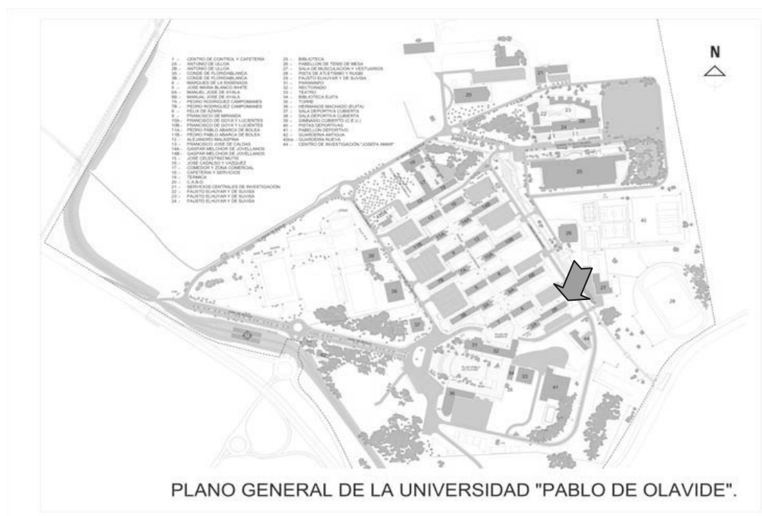
Fig.2: Plano de localización del Decanato de la Facultad de Humanidades