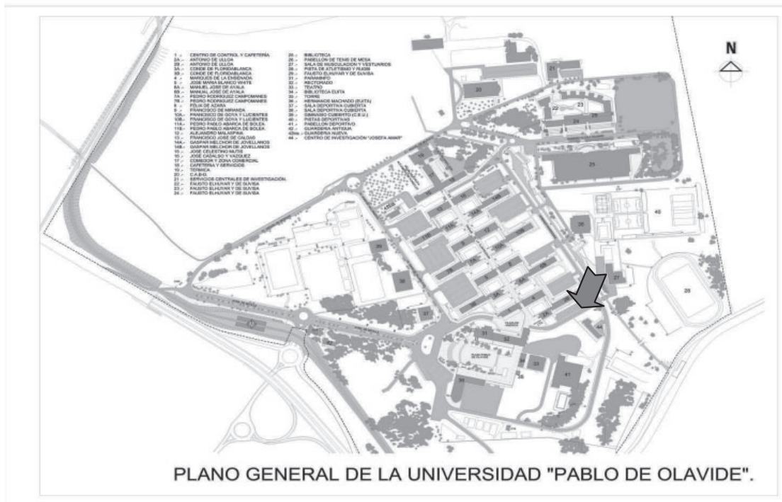
Fig.2: Plano de localización de la Dirección de la Escuela Politécnica Superior