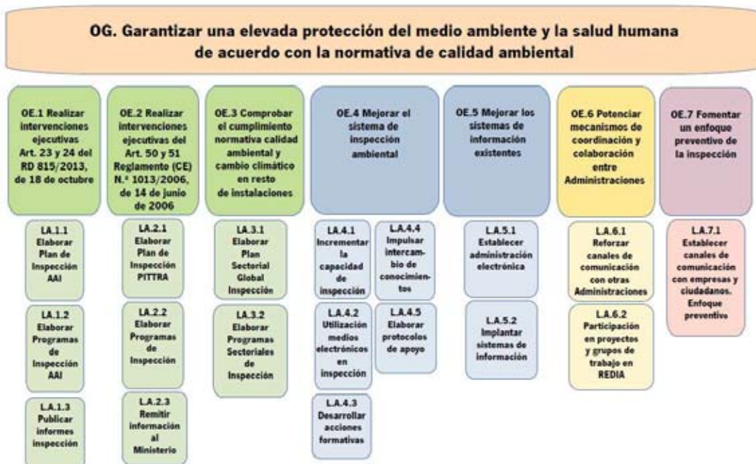
Figura 1. Árbol de objetivos.

El Plan Integral de Inspección PIDIA se organiza en torno a cuatro aspectos principales, cuyos objetivos específicos (OE) se desagregan, a su vez, en líneas de actuación (LA) (ver Figura 1).