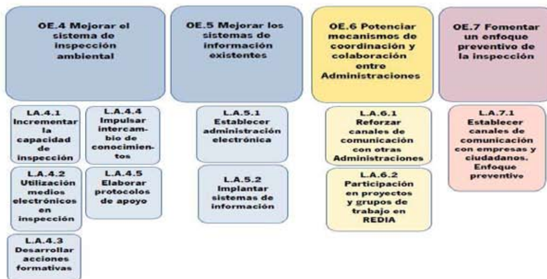
Figura 2. Objetivos y líneas de actuación del PIDIA 2020-2025 desarrollados en las actuaciones de mejora continua 2020

Los objetivos específicos OE.4, OE.5, OE.6 y OE.7 del Plan PIDIA 2020-2025 están dedicados a la mejora del sistema de inspección ambiental existente y al establecimiento de canales de colaboración y cooperación con todas las entidades y organismos que intervienen en el proceso de inspección y, como no, con los titulares de las instalaciones y resto de agentes económicos.