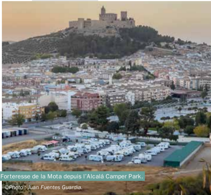
Forteresse de la Mota depuis l'Alcaíá Camper Park.