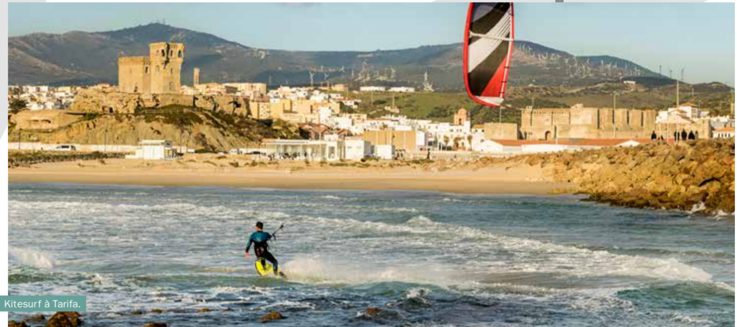
Kitesurf à Tarifa.