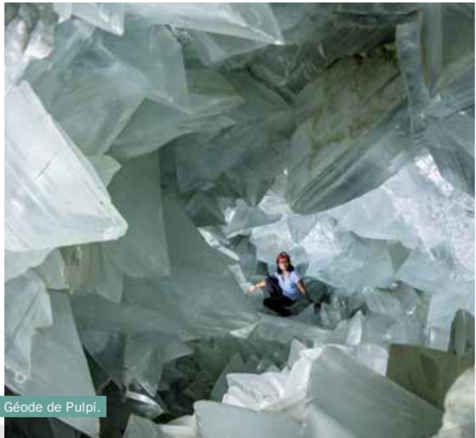
Géode de Pulpi.