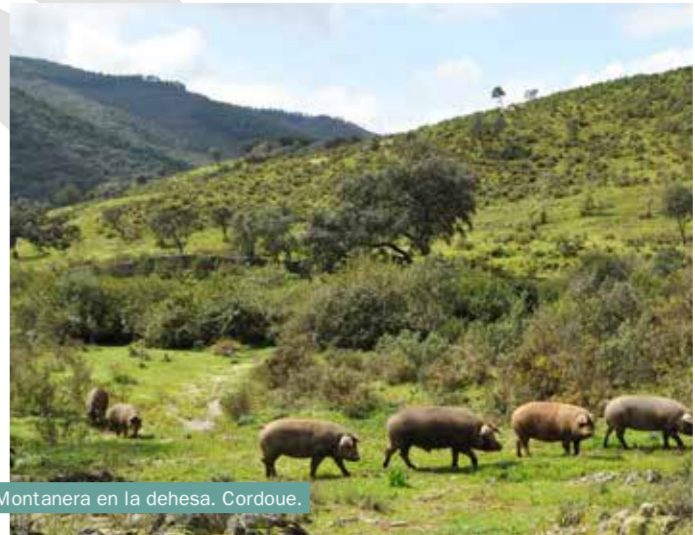
Montanera en la dehesa, Cordoue.

Le caravanning favorise une forme de tourisme moins invasive et plus humaine , qui encourage les échanges culturels et rapproche le voyageur des coutumes et traditions locales . Il ne vous sera pas difficile de voir les artisans travailler dans leurs ateliers et de participer à leur travail : argile, fer forgé, alfa ou cuir. Mais, selon la période de l'année à laquelle vous voyagez, vous pouvez également « brouter » un troupeau de porcs ibériques pendant la saison de la « montanera » (pâturage de montagne), partir à la chasse aux moutons de Segureño, vous rendre dans la forêt pour cueillir des champignons, déguster une excellente huile d'olive extra vierge, cueillir des châtaignes ou participer à la joie des fêtes des vendanges après la récolte du raisin. Profitez de l'occasion et achetez des produits locaux et biologiques ; vous aiderez ainsi les économies locales. Et si vous optez pour des expériences d'agrotourisme qui impliquent une immersion totale dans la campagne, essayez de fabriquer des fromages artisanaux, de pétrir du bon pain et de recueillir du miel. Vous pouvez aussi simplement vous asseoir au coin du feu ou sur un banc au pied de la rue et écouter les anecdotes et les récits de vie des anciens de la région.