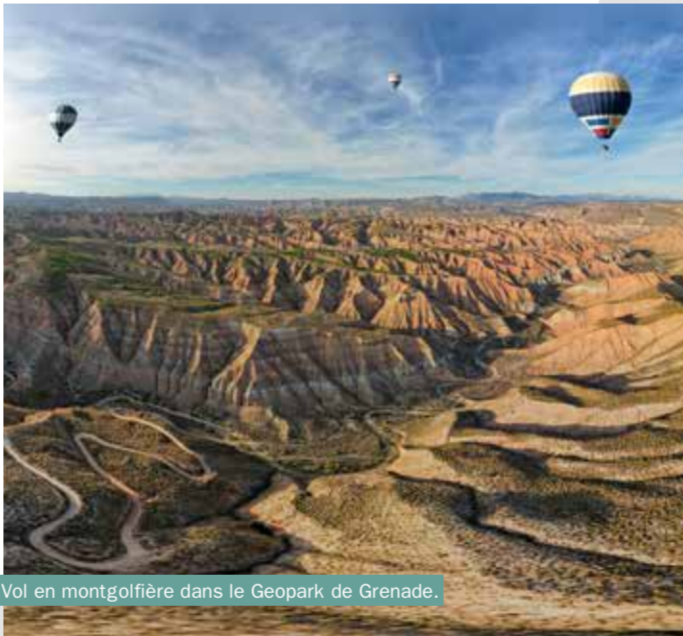
Vol en montgolfière dans le Geopark de Grenade.