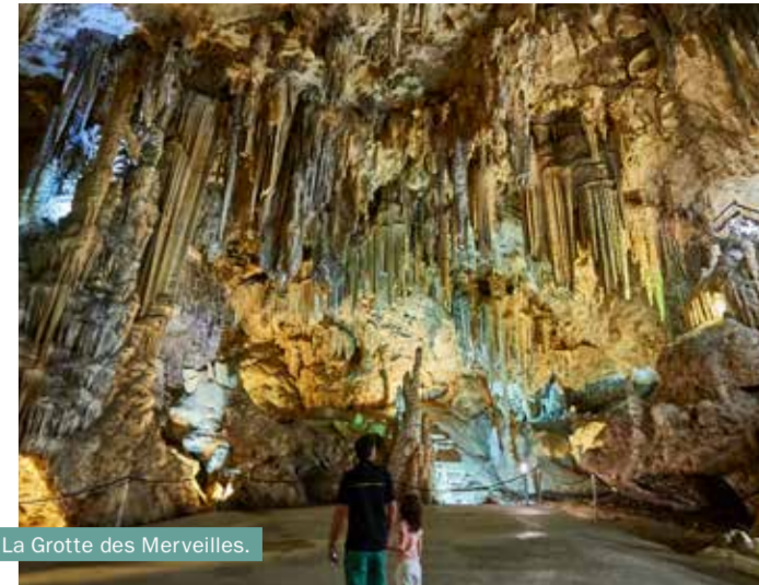
La Grotte des Merveilles.

Pas besoin d'emballer ou de déballer, vous avez tout ce dont vous avez besoin pour une autonomie totale. Vous ne dépendez pas d'horaires stricts et vous pouvez improviser quand vous en avez besoin. Tout cela fait du tourisme en camping-car une option idéale pour voyager avec les plus petits. Partons à l'aventure !