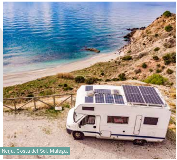
Nerja, Costa del Sol, Malaga.

Et si vous voulez vous immerger dans l' atmosphère maritime des villes côtières andalouses, vous pouvez visiter les marchés aux poissons remplis de poissons frais , tout juste débarqués, pour assister à une vente aux enchères en direct. Vous pourrez également découvrir l'art ancien de l' almadraba , de première main, ou visiter l'un des marais salants et des estuaires de la baie de Cadix et de Huelva , où, comme par le passé, on pratique encore la pêche artisanale.