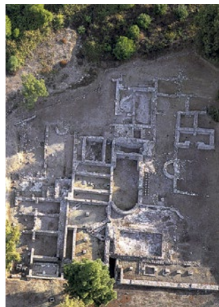
↑ Vista aérea de los restos arqueológicos del edificio termal de Carteia.

Se trata de una construcción de gran envergadura y debió estar en uso desde el s. I hasta el s. IV d.C. Disponía de todas las dependencias de unas termas: caldarium o estancia de baño caliente; tepidarium o estancia templada; frigidarium o estancia fría, y apodyterium o zona de vestuarios. Contaba además con una palestra para realizar ejercicios gimnásticos, provista de natatio (piscina al aire libre) y con una letrina. Se trataba, por tanto, de un edificio complejo, no sólo destinado al baño. En los siglos VI y VII d.C. se empleó el espacio como necrópolis. En el mismo lugar, restos de otro edificio de planta absidal apuntan a la existencia de una basilica tardorromana.