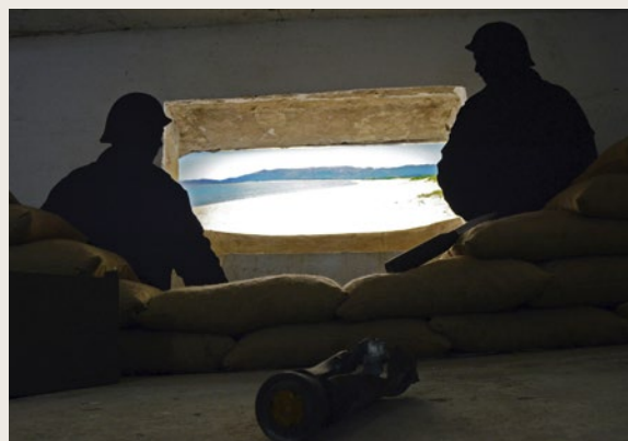
↑ Interior del búnker.

La tercera sala ha sido despojada de su carácter militar y en ella se evocan aspectos socioculturales de la España de posguerra, con recursos gráficos y sonoros, desde una radio de la época.