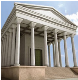
↑ Reconstrucción ideal del templo.

Asentado sobre antiguas construcciones religiosas de época púnica, se levantaba un gran templo, el monumento republicano más antiguo documentado en este lugar (s. II a.C.) que tenía una superficie de 24 x 18 m. El templo se alzaba sobre un podio de 1,90 m de altura y se accedía a él por una escalinata frontal enmarcada por dos cuerpos laterales que remataban la fachada. Se trataba de un templo posiblemente hexástilo —con seis columnas en el frente—, del tipo peripteros sine posticum , es decir, rodeado de columnas salvo en el lado trasero. Disponía de una cella que albergaba la estatua de la divinidad, cuya identidad por el momento se desconoce.