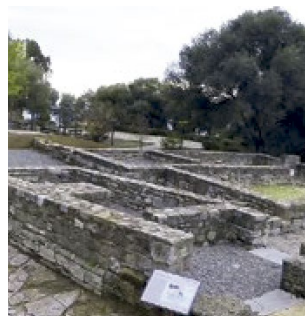
← Domus del Rocadillo y parte del viario. ↓ Reconstrucción virtual del teatro romano. ↓ Factoría de salazones.

Agencia Andaluza de Instituciones Culturales CONSEJERÍA DE CULTURA Y PATRIMONIO HISTÓRICO