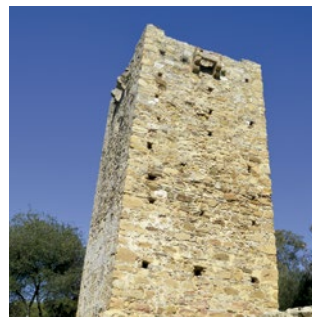
↑ Torre del Rocadillo.

De planta cuadrangular y adosada a la muralla romana, esta torre vigía fue encargada al ingeniero Livadote a finales del s. XVI. Tiene unos 12 m de altura siendo la mitad inferior un cuerpo macizo. Sobre él se encuentra la cámara de guardia, a la que se llegaba por medio de una escalera de cuerda. Se trata de una estancia abovedada en la que hay una chimenea de tiro vertical y una estrecha ventana desde la que se divisa la desembocadura del río Guadarranque.