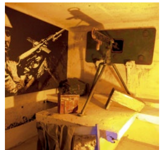
↑ Interior de una sala del búnker.

En esta zona también podemos visitar uno de los búnkeres construidos durante la II Guerra Mundial, el cual ha sido musealizado, siendo la primera instalación de estas características de Andalucía.