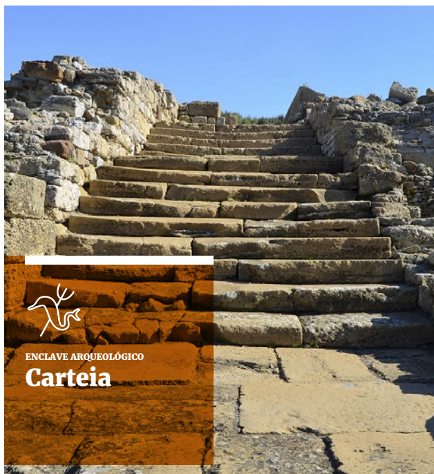
↑ Escalinata monumental de época augustea (siglo I d.C.).