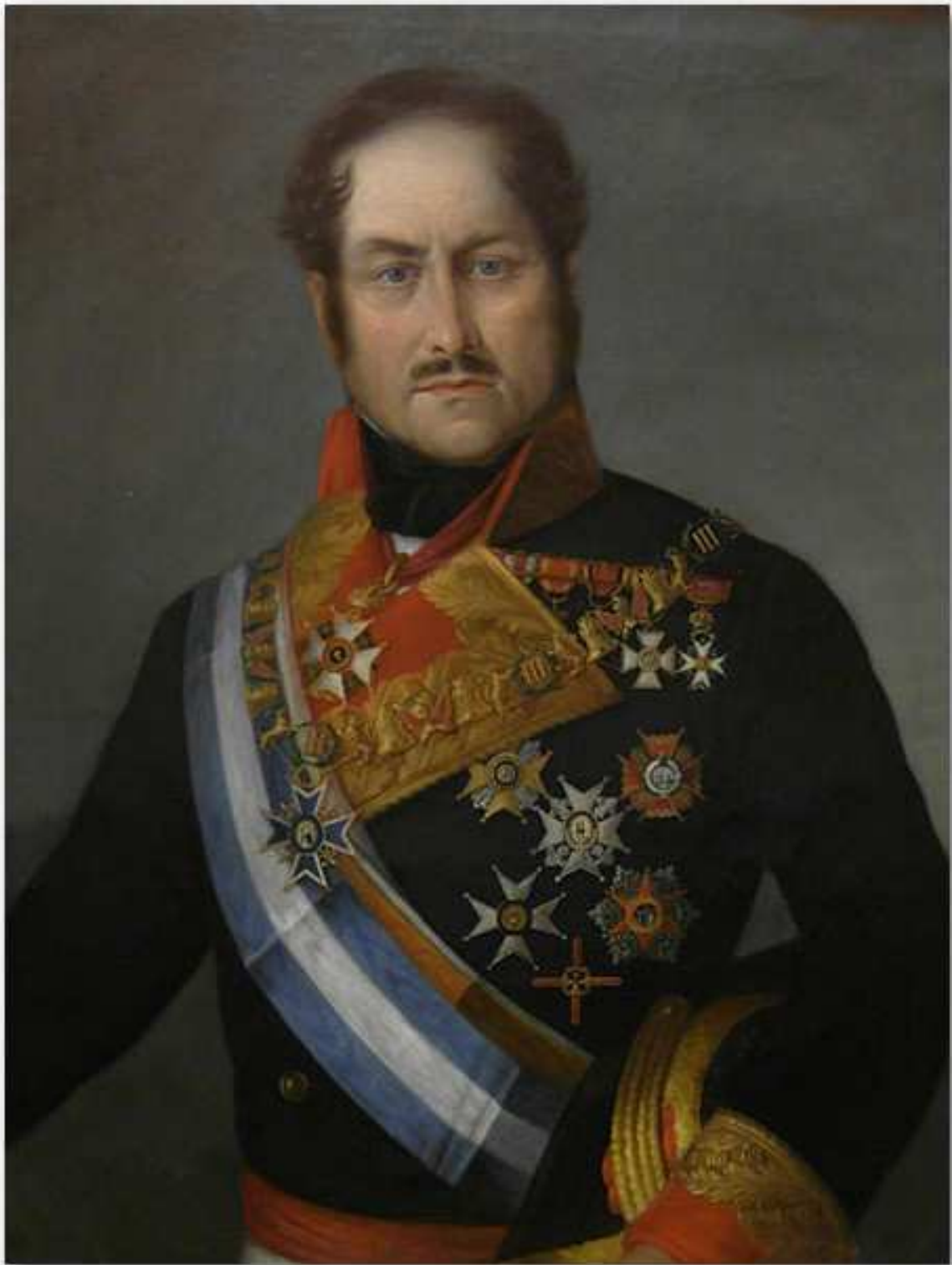
Retrato de Juan Van Halen y Sarti.