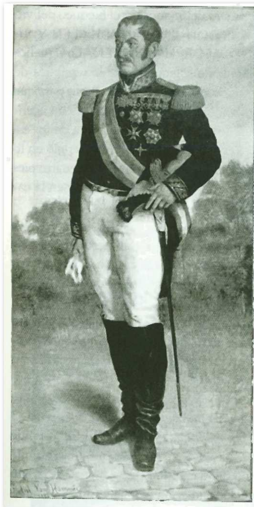
Retrato de Van Halen por A. van Hammé. (Musée de l'Armée, Bruselas)