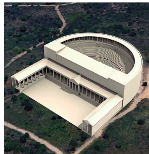
↑ Reconstruction virtuelle du théâtre romain. – Usine de salaisons.