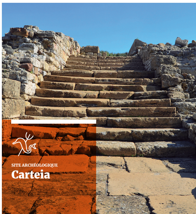
↑ Perron monumental datant de l'époque augustéenne (1 er siècle après Jésus-Christ).