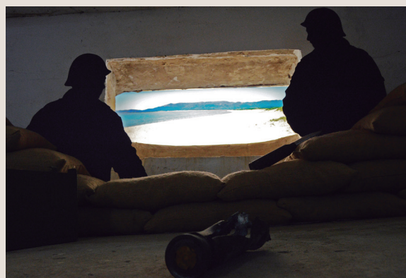
↑ Intérieur du bunker.

La troisième salle a été dépouillée de son caractère militaire afin d'y évoquer les aspects socioculturels de l'Espagne d'après-guerre, avec des ressources graphiques et sonores, grâce à une radio de l'époque.