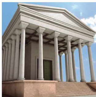
↑ Reconstruction idéale du temple..

Reposant sur d'anciennes constructions religieuses datant de l'époque punique, se dressait un grand temple, le monument républicain le plus ancien enregistré à cet endroit (II e siècle avant Jésus-Christ). D'une surface de 24 x 18 m, le temple se hissait sur un podium de 1,90 m de hauteur et l'on y accédait par un perron frontal encadré de deux corps latéraux qui couronnaient la façade - de type péripète sine posticum , c'est-à-dire, entouré de colonnes à l'exception de l'arrière. Sur le podium se dressait une cella qui abritait la statue de la divinité, dont l'identité est pour le moment inconnue.