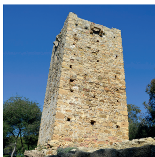
↑ La tour du Rocardillo.

À cet endroit, nous pouvons admirer la « Domus du Rocardillo », aux caractéristiques constructives et structurelles similaires à celles de la maison située près du temple. Située au croisement de deux rues dallées, on y accédait par deux perrons qui sauvaient le dénivelé de la rue. Il s'agit d'une maison de type domus, avec de nombreuses pièces, un atrium avec une citerne et un péristyle dallé revêtu de mosaïques. Des segments de routes romaines subsistent tout près.