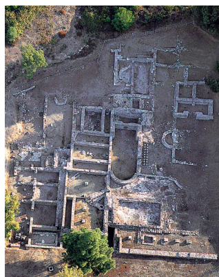
↑ Vue aérienne des vestiges archéologiques de l'édifice thermal de Carteia.

Il s'agit d'une construction de grande envergure, qui a dû être utilisée entre le I er et le IV e siècle après Jésus-Christ. Elle était équipée de toutes les dépendances des thermes : un caldarium ou salle de bains chauffée, un tepidarium ou une pièce tempérée, un frigidarium ou une pièce froide et un apodyterium ou une zone de vestiaires. Il disposait également d'un forum pour pratiquer des exercices de gymnastique, doté d'une natatio (piscine à ciel ouvert) et de latrines. Il s'agissait donc d'un édifice complexe, non seulement destiné aux bains. Aux VI e et VII e siècles après Jésus-Christ, l'espace a été utilisé comme nécropole. Au même endroit, des restes d'un autre édifice de plan absidal rappellent l'existence d'une basilique tardo-romaine.