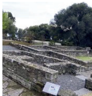
← Domus du Rocadillo et une partie du chemin..

Quinta Edición del Plan Andaluz de Cultura