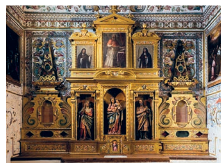
↑ Retablo de la Sala del Reservado.

Debe su nombre a que en ella se reservaba el Santísimo el Jueves Santo. A partir de 1636 recibe una decoración con motivos marianos. En el retablo encontramos la Virgen con el Niño , San Joaquín y Santa Ana , obras de Martínez Montañés, y en la bóveda símbolos de las letanías, el Espíritu Santo y querubines y angelotes. También podemos admirar la serie de cuadros de la Vida de la Virgen .