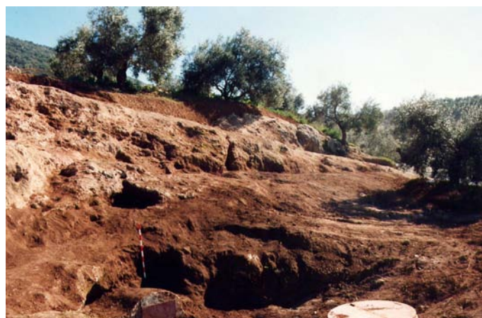
Lámina III. Zona del Manantial.

En la zona del manantial se realizó una exhaustiva limpieza de la vegetación intrusiva, formada sobre todo por higueras y zarzas, despejando la zona de la cueva por donde antiguamente manaba el agua y de donde, según cuentan los lugareños, se sacaron gran cantidad de platos y vasijas hechas a mano. Durante el proceso de limpieza muchas de las estructuras que se observaban antes del comienzo de la intervención se fueron definiendo, apareciendo a su vez otras nuevas, todas ellas talladas en la roca. (Lámina III)