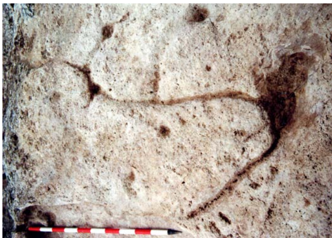
Lámina IX. Cabeza de caballo

El conjunto de estas insculturas tiene para nosotros, por tanto, un contenido mágico religioso, aunque son muy difíciles de interpretar y fechar, dado que aparecen representaciones de tipo figurativo-naturalista asociadas a otras esquemáticas y de tipo geométrico. En este sentido destacan los grabados encontrados al lado de la pileta, realizados con la técnica del picateado (muy uniforme) sobre una superficie más o menos horizontal, y entre los que podemos distinguir motivos geométricos (un triángulo), esquemáticos de tipo ramiformes y un posible antropomorfo. Junto a ellos, numerosas cazoletas y una representación figurativa que parece corresponder a la cabeza de un caballo. (Lámina IX)