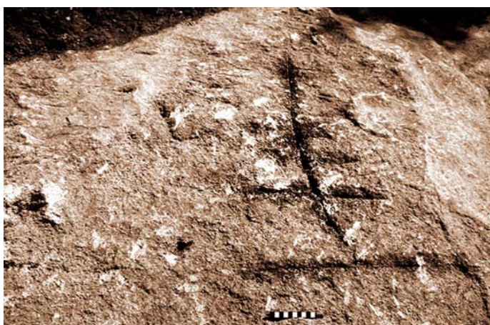
Lámina VII. Grabado Tectifomre

En todo el farallón rocoso podemos observar numerosas muestras de insculturas, tanto de tipo figurativo como esquemáticas, que nos revelan la gran importancia y nueva dimensión que toma este yacimiento. (Lámina VII y VIII)).