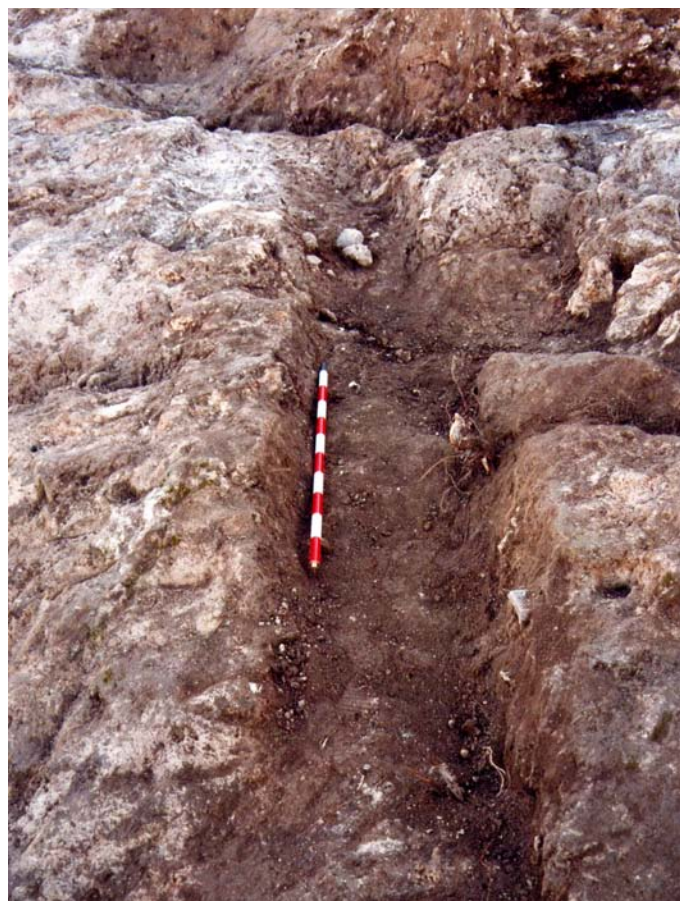
Lámina VI. Corredor

Aparte se han localizado otras posibles entradas a la cueva, lo cual no podremos afirmar hasta que no sean excavadas, y un pasillo o corredor (Lámina VI), con orientación suroeste- noreste, que va a dar a una oquedad que podría ser el tragaluz de la cueva donde nace el manantial.