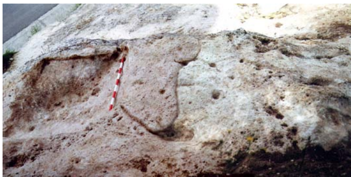
Lámina IV. Pileta y grabados rupestres