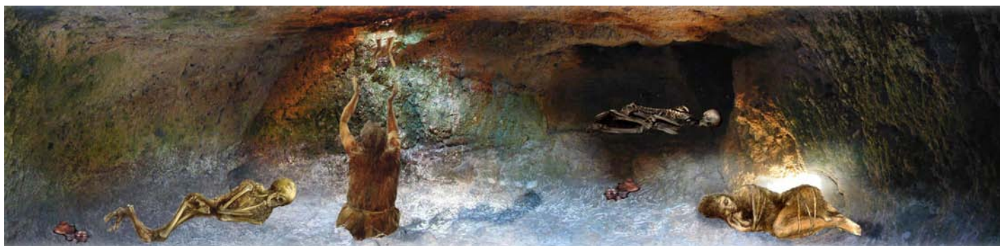
Lámina II. Recreación Infográfica del interior de una tumba colectiva. J.M. Higuera

está trabajado, bien de forma plana, bien formando una cubierta abovedada rematada en un techo plano circular. La mayoría cuentan con un tragaluz en el techo que se ha identificado con rituales post-mortem . (Lámina II).