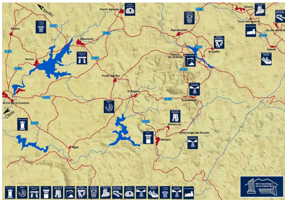
Figura 1. Ruta Arqueológica de los Pueblos Blancos. Mapa J.M.Higueras

Gracias a esta iniciativa de turismo cultural, pionera en Andalucía, se han podido recuperar numerosos yacimientos de la sierra de Cádiz, que no sólo estaban expuestos a los rigores de la naturaleza sino que eran objeto de un expolio indiscriminado, reanudándose en ellos la investigación científica. Para la puesta en valor del patrimonio arqueológico serrano, ha sido necesario dotar a los yacimientos de la infraestructura necesaria para hacer posible su visita turística y divulgación.