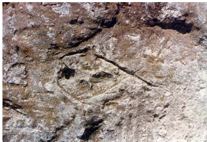
Lámina VIII. Pez.