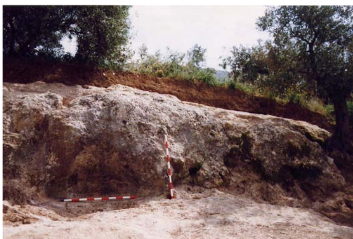
Lámina V. Pileta sobre nichillo exterior

Aparte se han localizado otras posibles entradas a la cueva, lo cual no podremos afirmar hasta que no sean excavadas, y un pasillo o corredor (Lámina VI), con orientación suroeste- noreste, que va a dar a una oquedad que podría ser el tragaluz de la cueva donde nace el manantial.