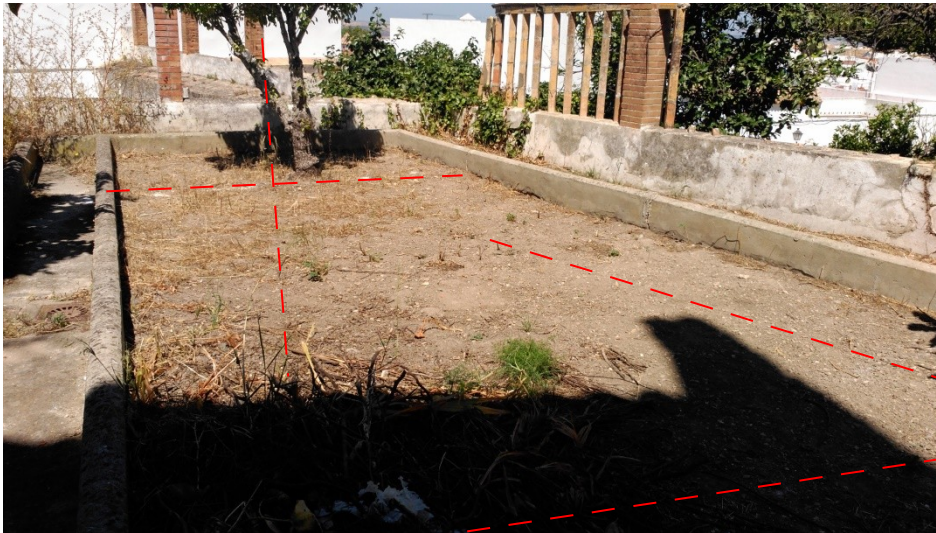
Emplazamiento de la piscina

El presente Artículo hace referencia al Control de Movimiento de Tierras realizado en Avda. de Andalucía, 29 (Medina Sidonia, Cádiz) para la construcción de una piscina para uso privado en el patio trasero de una vivienda unifamiliar. Las dimensiones eran reducidas, de 6 x 3 metros con una cota última de excavación de 2.00 metros.