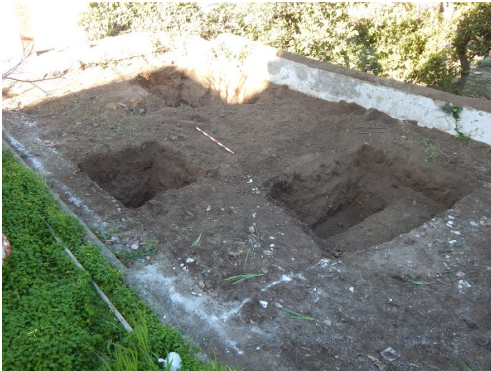
Detalle de la intervención

otro lado, la dinámica urbanística había sido muy activa, con un desarrollo desde tiempo atrás que no ha permitido la conservación de restos en muchos casos. En el que nos acontece, Avenida de Andalucía, 29, comunicar que no obtuvimos resultados arqueológicos , quedando constatada únicamente la aparición de un nivel de escombrera – revuelto contemporáneo.