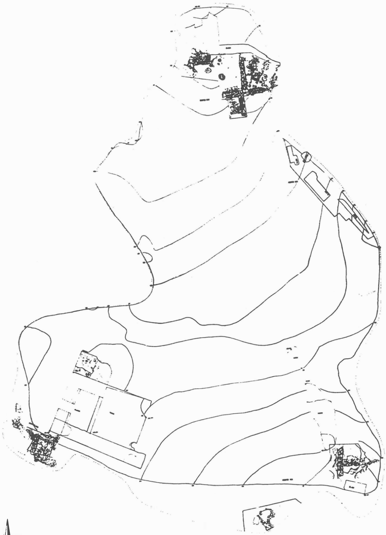
FIG.2. Planta general de la zona I