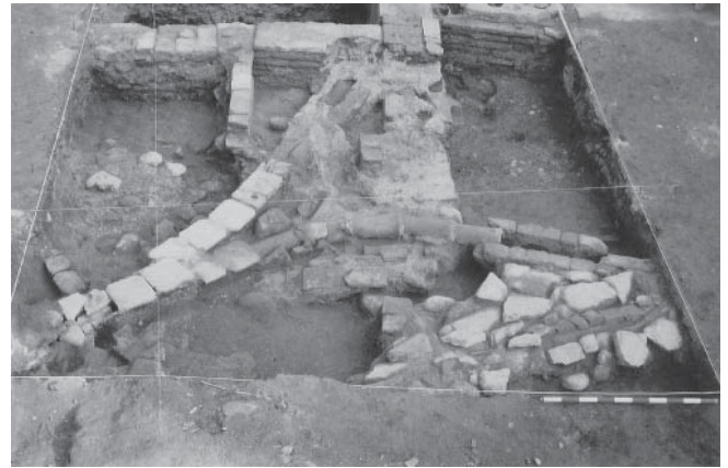
LÁM. II. Estructuras modernas fase IVa.

cerámicas de mayor antigüedad, aunque sin sobrepasar la etapa moderna, se localiza un pavimento (E. 28) en el que se combinan las piedras y el ladrillo fruto de diversas reparaciones.