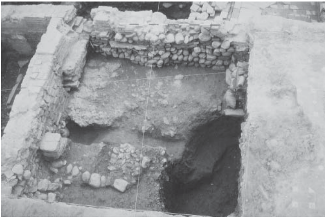
LÁM. I. Panorámica final de la intervención con las cuatro áreas U.T.M. excavadas.