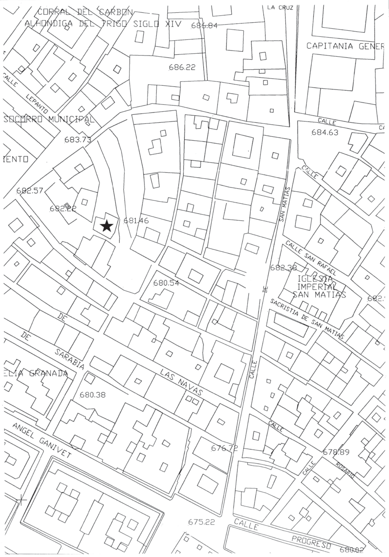
FIG. 1. Situación del solar.