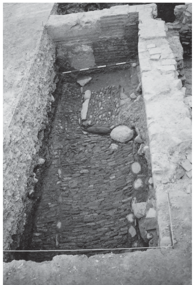
LÁM. III. Detalle estructuras modernas.

Está constituida por todo un complejo sistema de canalizaciones que a veces se van superponiendo o destruyendo unas a otras.