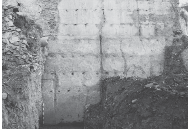
LÁM. IV. Muralla zona sur.