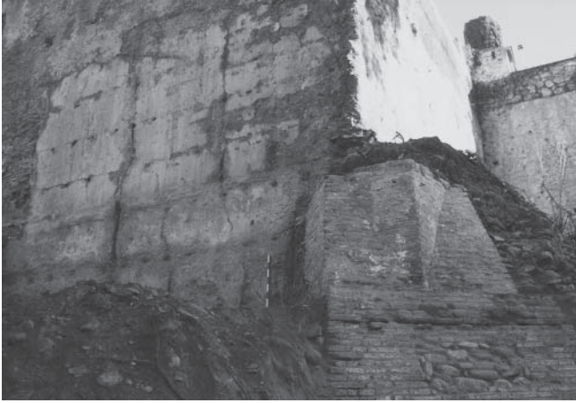
LÁM. III. Vista general del torreón.