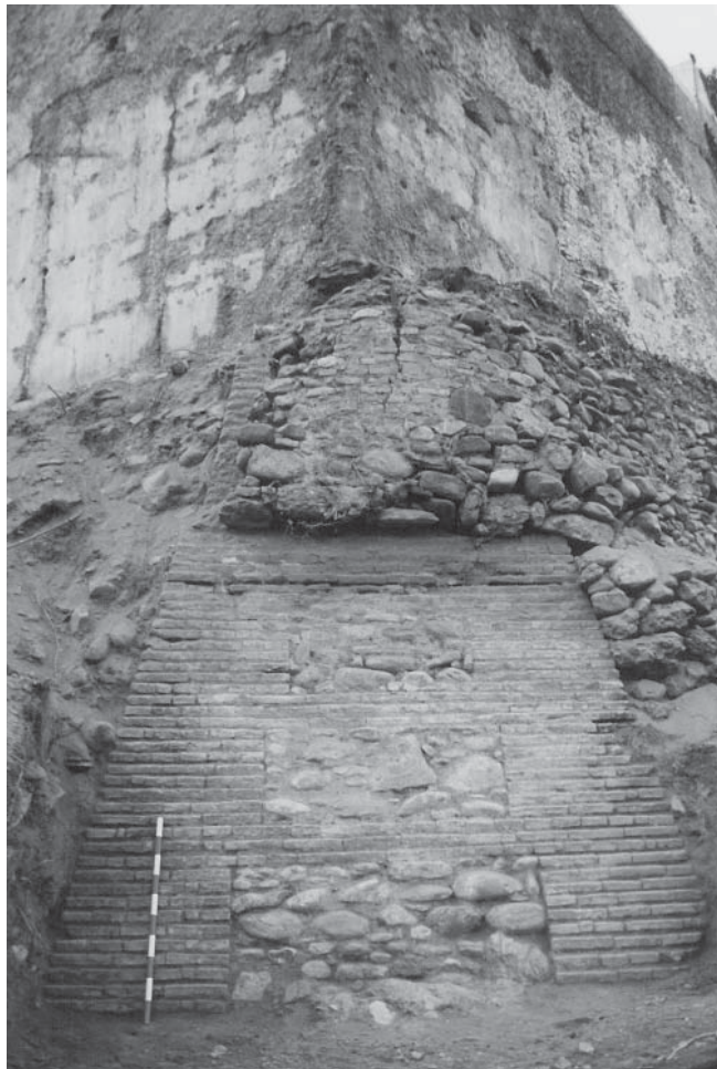
LÁM. I. Esquina del torreón y contrafuerte de época moderna.

Con la ocupación napoleónica y con el General Sebastiani estos paseos se ensancharon a expensas del río Genil y dividiéndolos en sus dos partes actuales. Dentro de la política destructiva iniciada por los franceses hay que situar el derribo parcial de las murallas