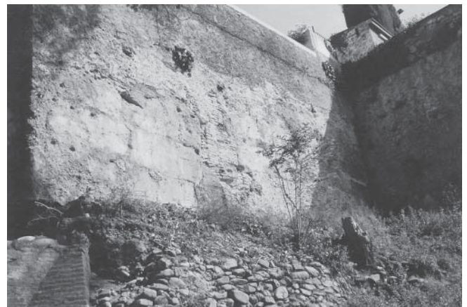
LÁM. II. Detalle de la muralla en su lado este.

Después de una limpieza de todo el muro quedó al descubierto y como estructura emergente un lienzo de muralla (E-001) con unas dimensiones de 3 m de altura por 6 m de largo y que continuaba ya que presentaba un quiebro en ángulo recto; en este otro