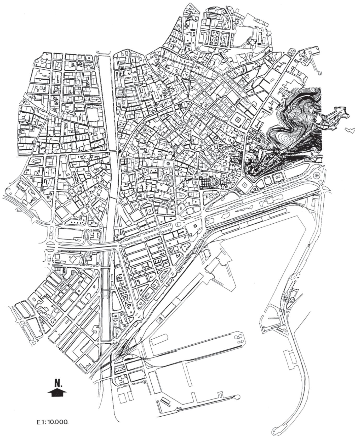
FIG. 1. Ubicación general del solar intervenido.