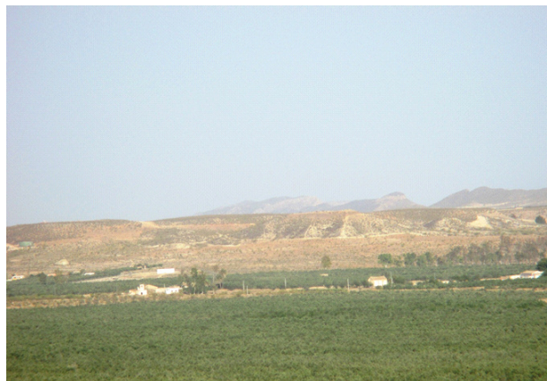
Lámina II. Restos de construcciones contemporáneas, capilla y vivienda actual y vistas de antigua Venta y Cortijo los Yesos. Grupo María Morales.

Lámina I. Vista del área prospectada, con el grupo María Morales en primer término y Ana María I y II al fondo.