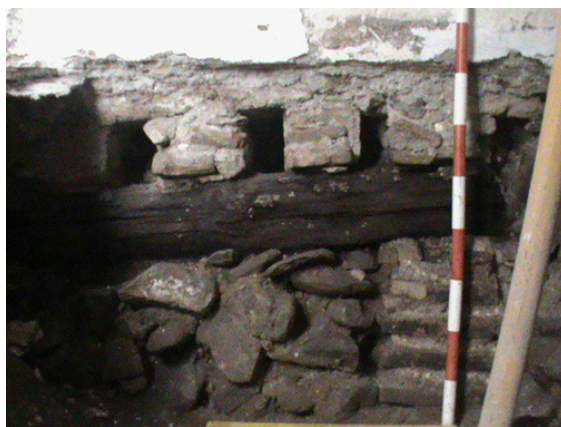
Lám. 2. Sondeo 2. Puerta y mechinales.