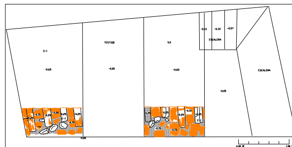
Lám. 1. Sondeo 1 E-1. Muro y mechinales.