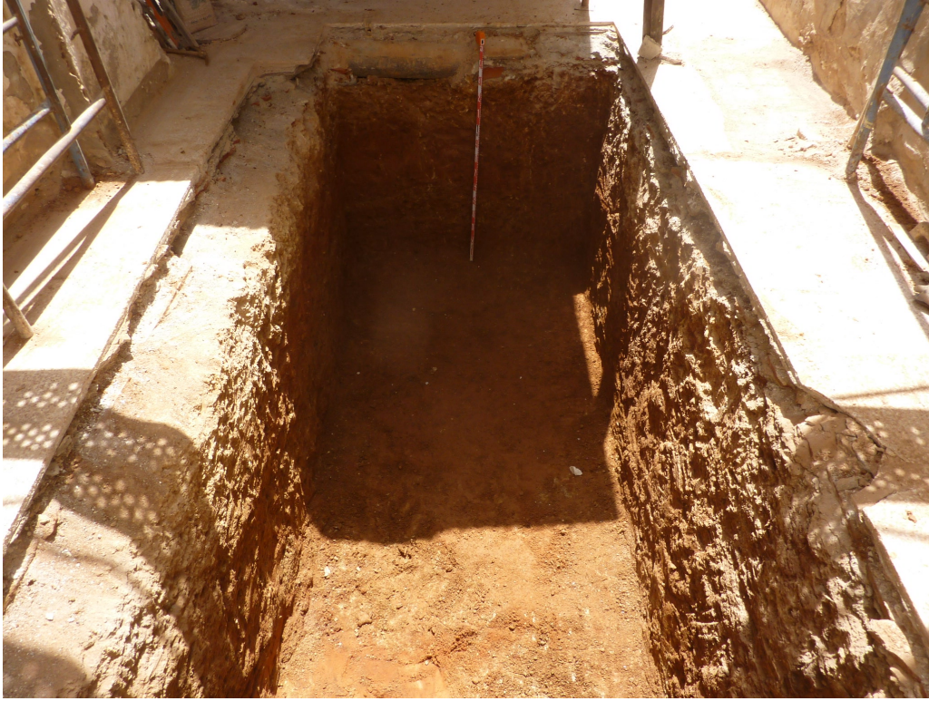
Figura 2. Sondeo una vez finalizado