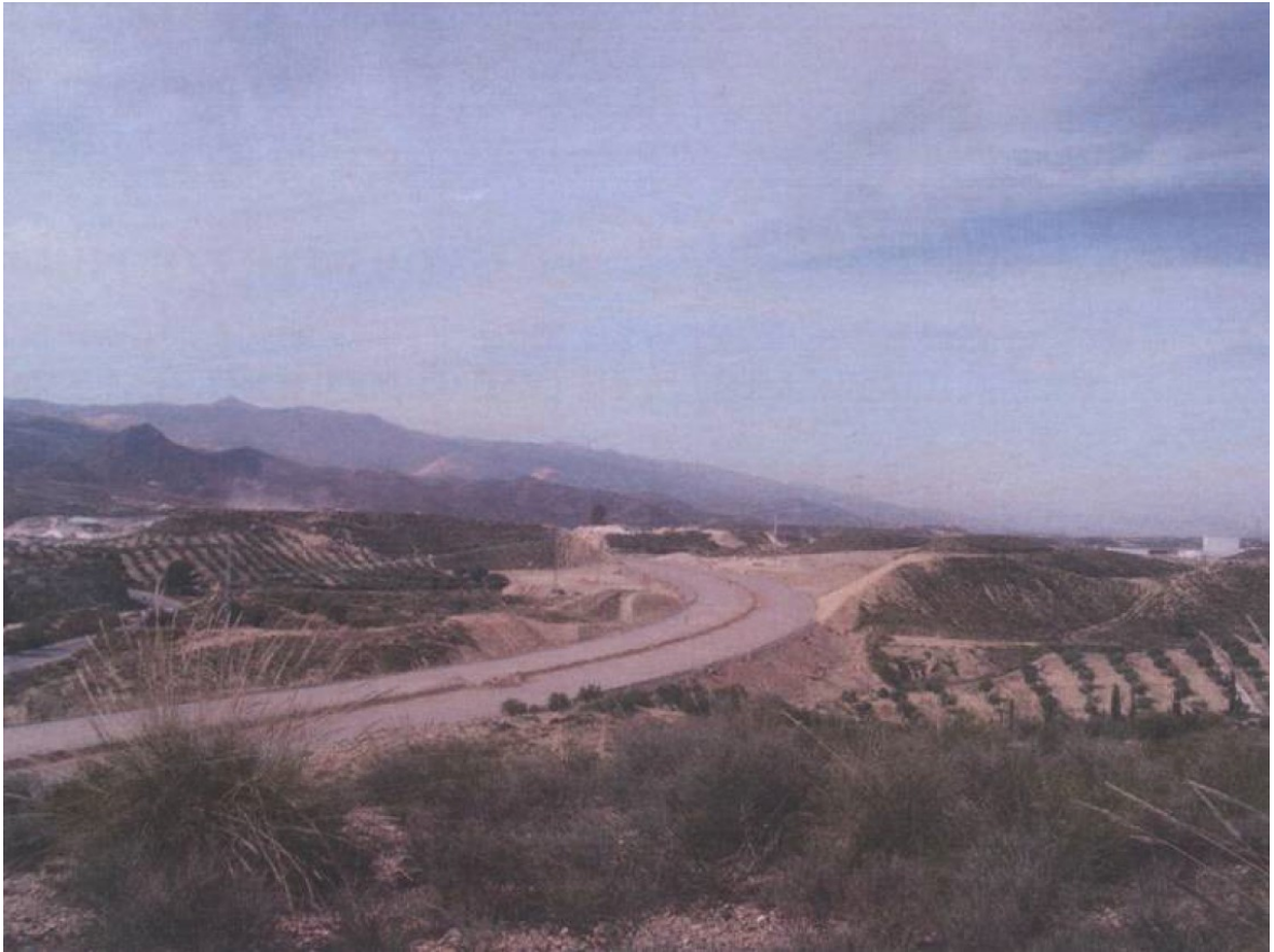
Lám.3. Vista general del proyecto constructivo.