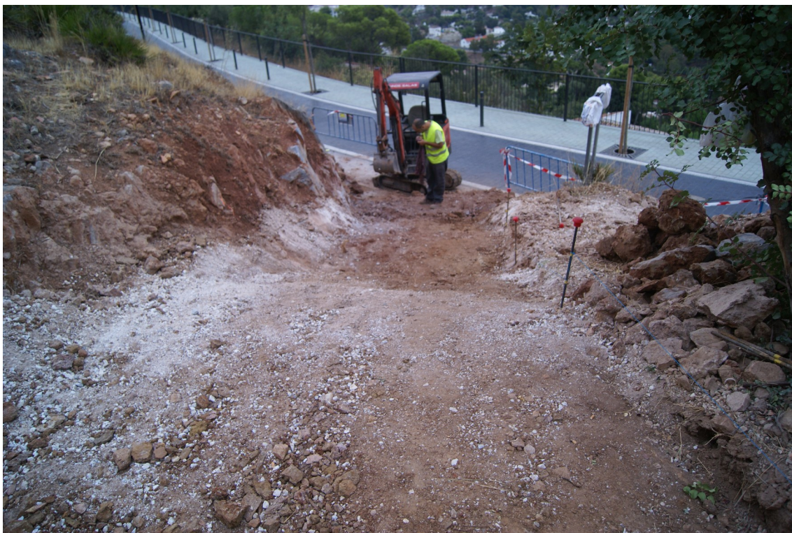
Lám. 2. Acceso tras retirar la escalinata anterior de traviesas.