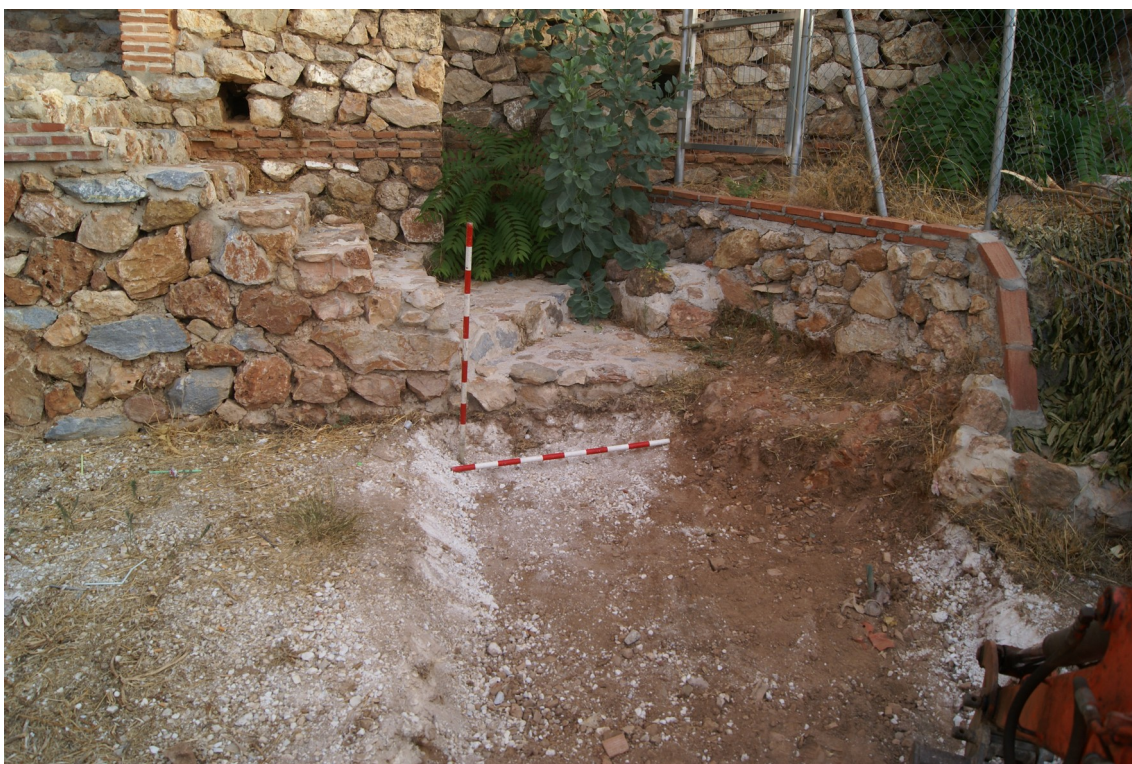
Lám. 3. Sector Norte de la zona de actuación.