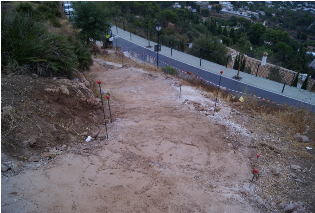
Lám. 4. Detalle del replanteo del nuevo acceso.