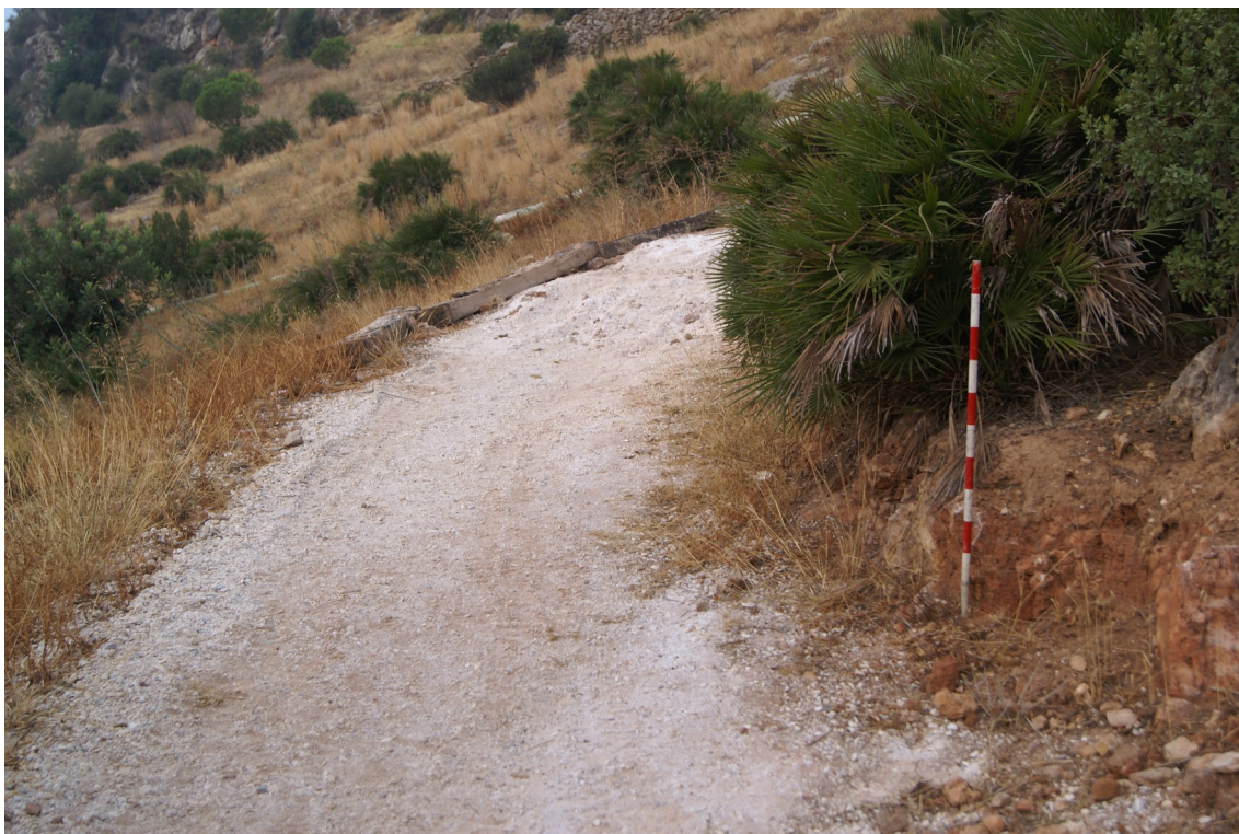
Lám. 1. Inicio de los trabajos.

Bajo las traviesas, se encontraba una capa de hormigón, de poco grosor y un relleno de zahorra de granulometría media que servía de sustento de dichas traviesas y rellenaba los rebajes realizados sobre la roca madre. Este proceso no conllevó acción alguna sobre el subsuelo de la rampa existente en la ladera, sin detectar indicios de restos muebles ni inmuebles de interés arqueológico desde el Vial Sur hasta la entrada a la zona comercial. En el caso que hubiese habido restos en esta zona, fueron arrasados en la construcción de la referida rampa.