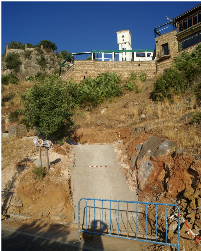
Lám. 5. Detalle del hormigonado.