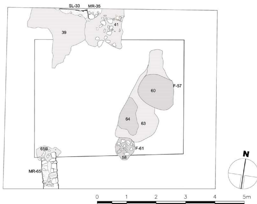
FIGURA 5. PLANTA GENERAL DE LA SUBFASE IA

Las evidencias materiales adscritas a época bajomedieval islámica que hemos aglutinado en una Fase II sin representación estratigráfica no bastan para contrastar los datos referidos a la ocupación del entorno entre los siglos XII y XIV, que, en puridad, quedan sin representación en nuestra excavación. Todo lo posterior a la subfase Ib pertenece a las acciones de reducción y adición estratigráfica producidas entre los siglos XVIII y XXI, hasta las vinculadas a la demolición del edificio preexistente.