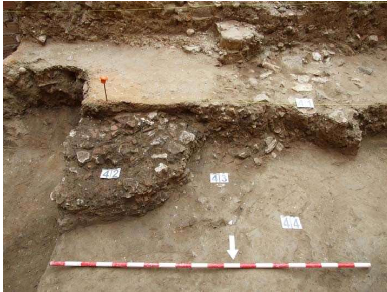
FIGURA 4. VERTIDO UE 42 Y PREPARACION DE PAVIMENTO UES 40B, 40 Y 39

Otro retazo de pavimento es SL-33, sobre UE-42, aunque conserva solo unos centímetros cuadrados sobre el perfil norte, formando conjunto constructivo con un resto de enlucido pintado en rojo que reviste la cara meridional del muro MR-35, de características similares a MR-65.