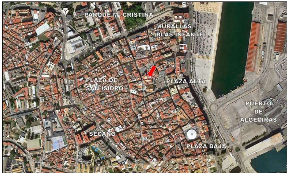
FIGURA 1. UBICACIÓN SOBRE ORTOFOTOGRAFÍA DE 2012

La parcela excavada tiene su fachada meridional abierta a la calle Santísimo y superficie de 72'51 m 2 . Su planta poligonal es casi cuadrada y mostraba las huellas de varias zapatas de hormigón retiradas cuando se hizo la demolición del edificio preexistente.