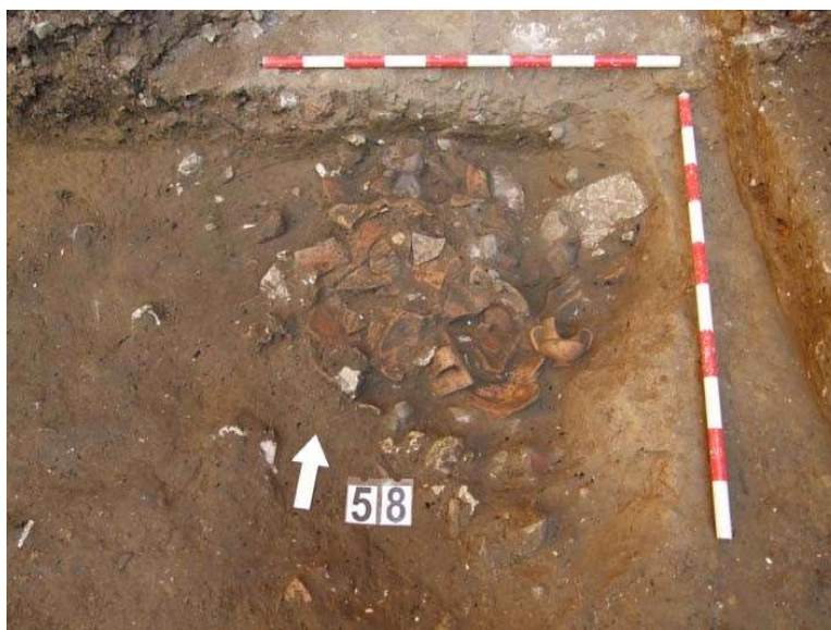
FIGURA 3. CERÁMICAS EN EL DEPÓSITO UE-58

En su extremo norte, F-62 está cortada por otra fosa (F-61), más pequeña y de forma circular (diámetro de 0'80 m y profundidad de 0'22), que presenta un depósito de cerámicas (UE 58) con piezas casi completas y restos de fauna, sobre un vertido de lajas de piedras calizas (UE 59). El depósito UE 58 se compone principalmente de 8 piezas: 1 jarrita, 2 cazuelas, 2 alcadafes, 1 cántaro con pintura roja y 2 ollas, que proporcionan una datación anterior al siglo XII.