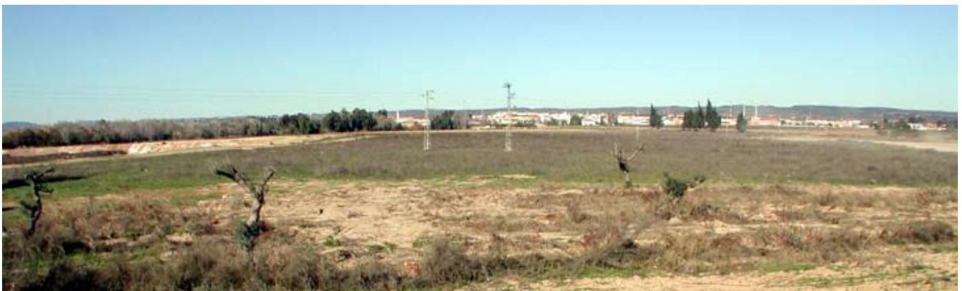
Lámina II. Imagen general de la parcela. A la izquierda, los árboles limitan con el río Guadalquivir; a la derecha, la carretera Alcolea-Guadajoz. El casco urbano de Alcolea del Río, al fondo.

La finca “El Zairón” ha servido durante el siglo XX y hasta el año 2002 como terreno de labranza de regadío. En la década de los 90 la empresa ARENOR, S. L. compró parte de la propiedad, que a partir de 1997, pasó a ser explotada para la extracción de áridos (arenas y gravas) en cantera (15).