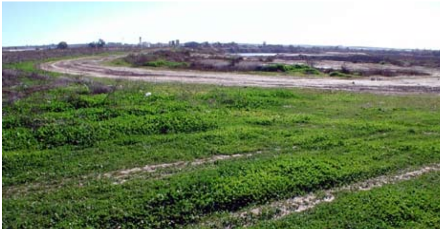
Lámina III. Imagen de la mitad sur de la parcela. Al fondo, la zona actualmente en explotación por la empresa ARENOR, S. L. En primer plano se observa la abundante vegetación producto del abandono de la zona como suelo cultivable en los dos últimos años.

la recogida de la última cosecha de maíz, hecho que dificultó, en parte, tener una idea previa de lo que podía encontrarse al realizar la prospección (Lámina III).