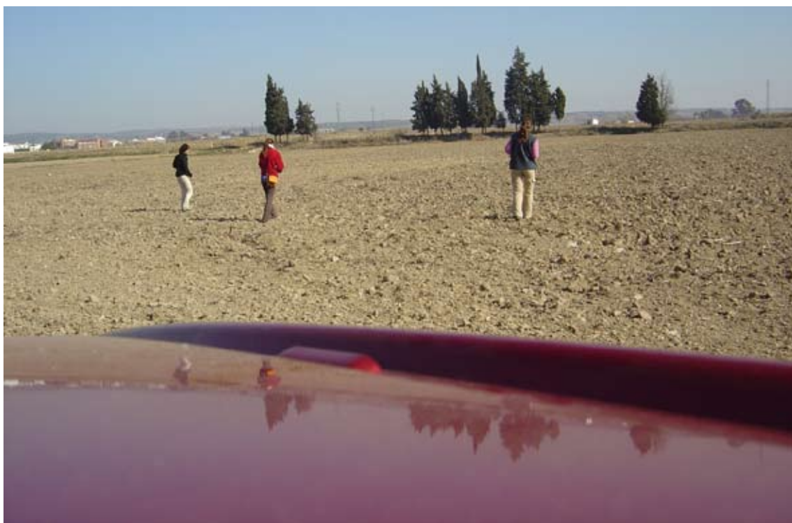
Lámina IV. Arqueólogas realizando la prospección superficial intensiva.

decidimos in situ , no realizar los muestreos, y llevar a cabo sólo la batida de los transectos, cuyos resultados estimamos suficientemente válidos para valorar la existencia o no de yacimiento en la zona (Lámina IV).