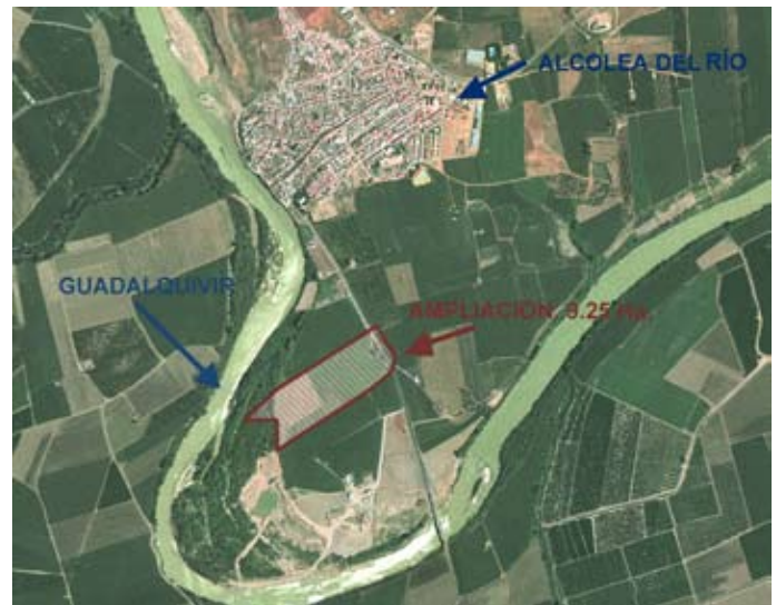
Lámina I. Situación de la parcela afectada por la ampliación en relación al núcleo urbano de Alcolea del Río (Foto aérea 1998-1999).

Con fecha 1 de marzo de 2005 se presenta en el Registro de la Delegación Provincial de Cultura de Sevilla, acta de inicio de la actividad arqueológica. Al término de la misma, y datada en 17 de marzo, se procede a la entrega de la diligencia de finalización en la citada Delegación.