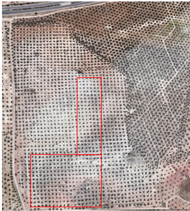
Fig. 2. Zona a intervenir en I Fase.