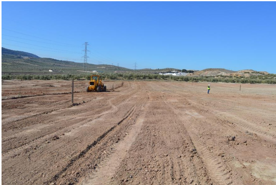
Fig. 3. Control Arqueológico Movimiento de Tierras.