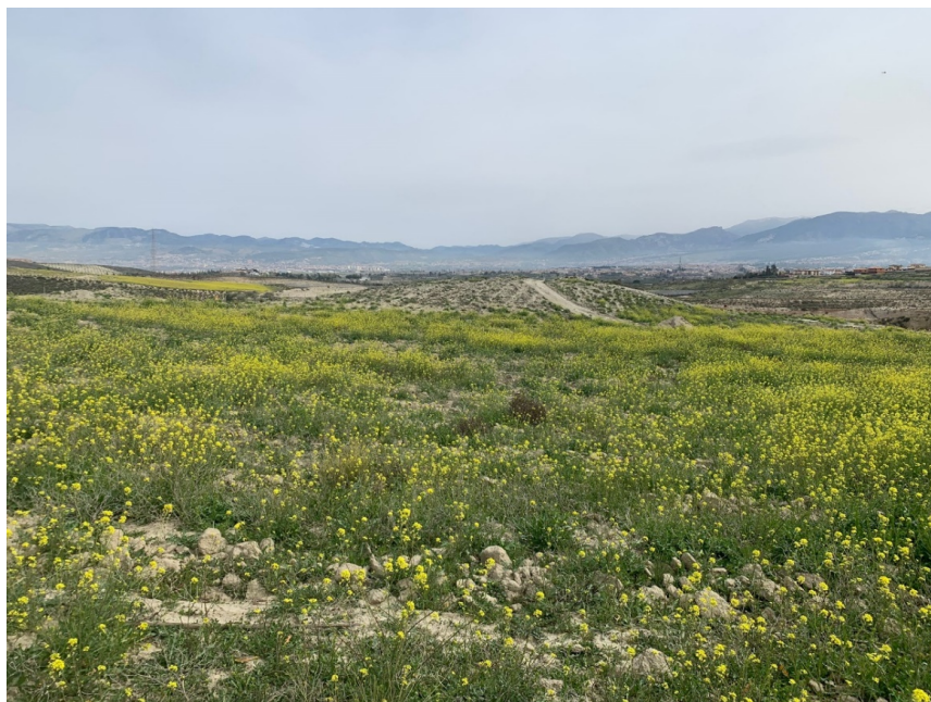
Ilustración 17. Vista, desde el oeste, de las parcelas 75, en primer término, y 73. Al fondo, algo más elevada, la parcela 72