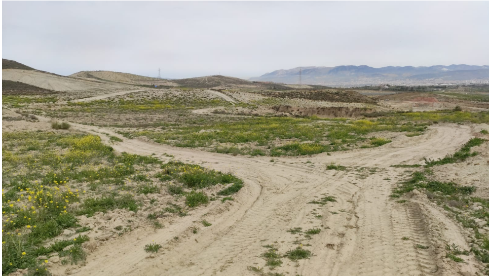
Ilustración 11. Vista de la parcela 73, desde el suroeste, en su confluencia con la parcela 75