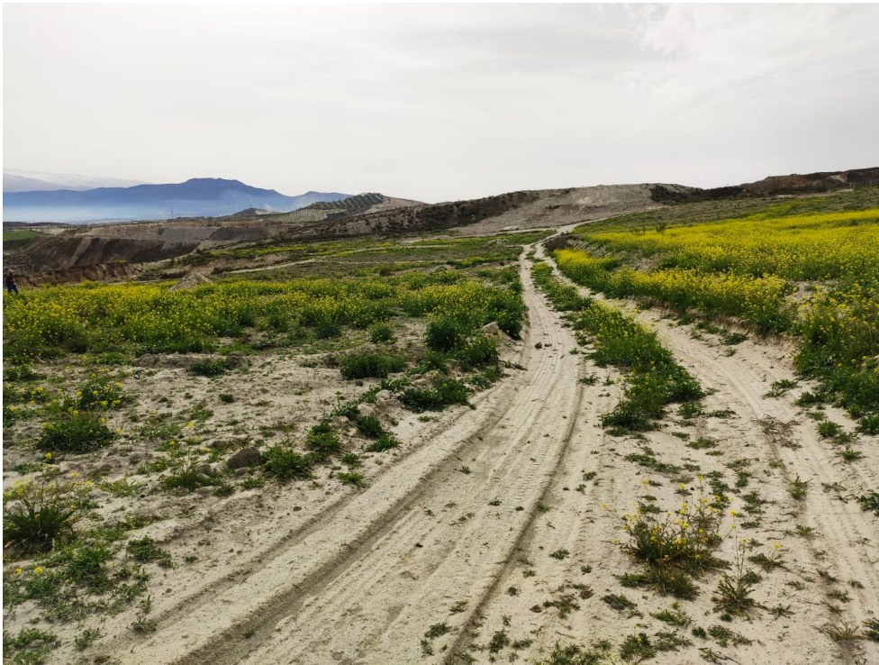
Ilustración 12. Vista de la linde, con rodadas, entre las parcelas 75 (a la derecha) y 73

Parcela 74. Pequeña parcela, casi rectangular, muy afectada por los movimientos de tierra de la cantera actual. Solo resta una zona sin afectar, la más meridional de la misma, con un tipo de vegetación baja similar a la de la parcela 69. Además, se observa en superficie una gran cantidad de ladrillos huecos, así como fallos de horno de una fábrica de ladrillos ( Ilustraciones 13 y 14 ).