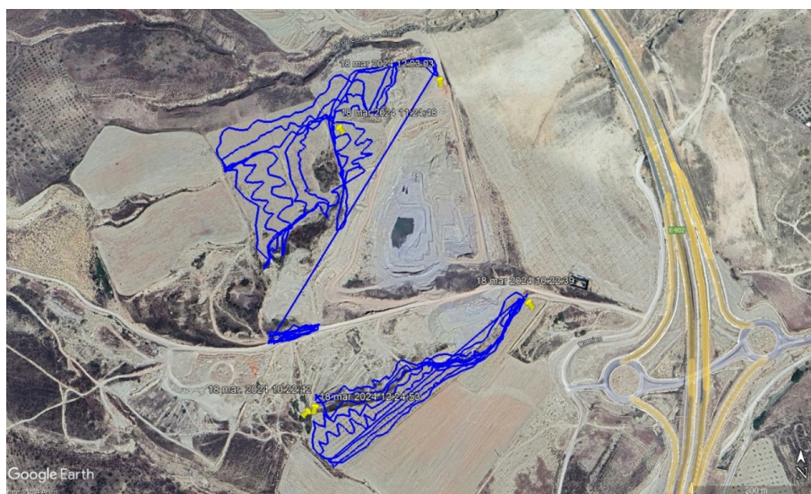
Ilustración 4. Recorridos de los prospectores por las parcelas afectadas

Durante la intervención se ha llevado a cabo también una completa documentación gráfica de las parcelas prospectadas, así como de los elementos muebles que han sido considerados de interés.