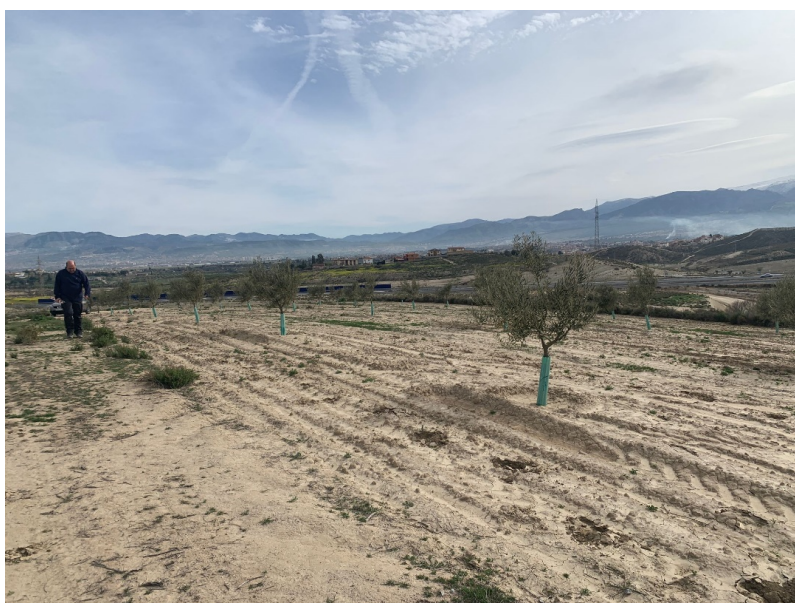
Ilustración 6. Detalle de la parcela 68

Parcela 69. Parcela estrecha y alargada, en sentido SE-NE, colindante a la 68 y la 70. Se encuentra parcialmente afectada por los movimientos de tierra de la cantera actual (parcela 70). Presenta una vegetación baja, con arbustos e hierbas silvestres ( Ilustraciones 7 y 8 ). Grado de