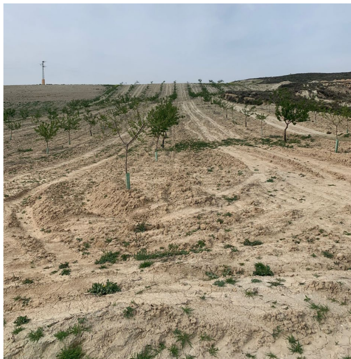
Ilustración 5. Vista, desde el este, de la parcela 68