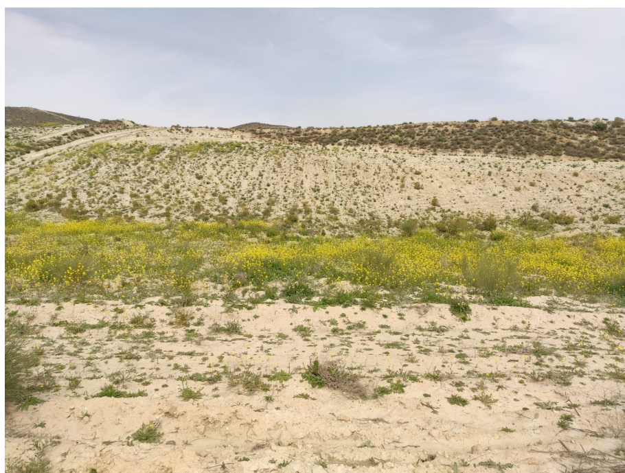
Ilustración 10. Vista, desde el sur, de la mitad septentrional de la parcela 72

Parcela 73. Parcela aproximadamente rectangular, con orientación N-S, entre las parcelas 72, al este, y 75, al oeste. Parcialmente afectada, en su extremo sur, por la cantera actual, el resto de la misma está ocupada por terrenos incultos, ocupados por vegetación natural silvestre, fundamentalmente jaramagos ( Ilustraciones 11 y 12 ). Grado de visibilidad medio-alto. No se han observado restos bienes o inmuebles de carácter arqueológico en su superficie.