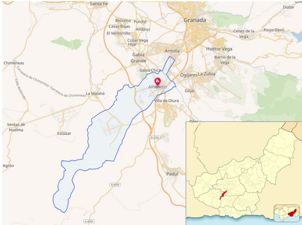
Ilustración 2. Localización y emplazamiento de Alhendín (Mapas de Wikimedia, Datos del mapa © Colaboradores de OpenStreetMap, y De Miguillen, CC BY-SA 3.0, https://commons.wikimedia.org/w/index.php?curid=10373284 )

Alhendín es una localidad situada en la parte meridional de la comarca de la Vega de Granada, constituyendo una de las treinta y cuatro entidades que componen el Área Metropolitana de Granada. Su amplio término municipal ( Ilustración 2 ) comprende el núcleo de población de Alhendín —capital municipal— así como las urbanizaciones de Los Arenales, La Quinta, Los Llanos, La Masía, El Salado y Sueños de Cadima.