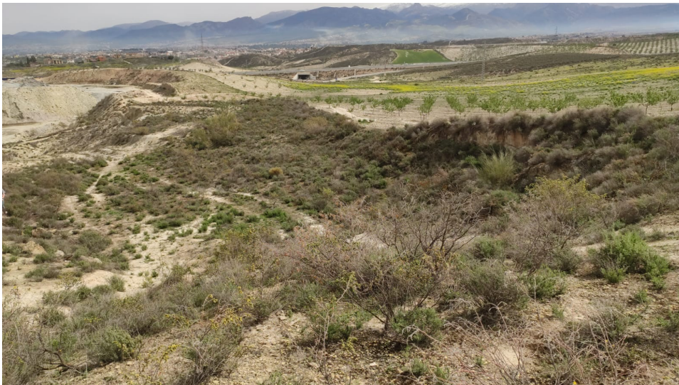
Figura 8. Vista, desde el noroeste, de la parcela 69

Parcela 72. Parcela aproximadamente rectangular, con orientación N-S, al este de la parcela 73. Ya está ocupada, casi al 50% de su tamaño original, por la cantera actual, más concretamente, su mitad sur. La mitad norte, objeto de esta prospección, está ocupada por terrenos incultos, ocupados por vegetación natural silvestre, fundamentalmente jaramagos ( Ilustraciones 9 y 10 ). Grado de visibilidad medio-alto. No se han observado restos bienes o inmuebles de carácter arqueológico en su superficie.