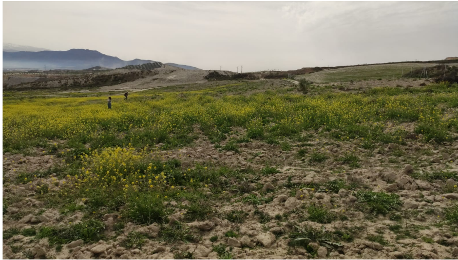
Ilustración 15. Vista, desde el norte, de la parcela 75

Parcela 75. Parcela aproximadamente rectangular, con orientación N-S, al oeste de la parcela 73. Parcialmente afectada, en su extremo sur, por la cantera actual, el resto de la misma está ocupada por terrenos incultos, ocupados por vegetación natural silvestre, fundamentalmente jaramagos ( Ilustraciones 15, 16 y 17 ). Grado de visibilidad medio-alto. No se han observado restos bienes o inmuebles de carácter arqueológico en su superficie.