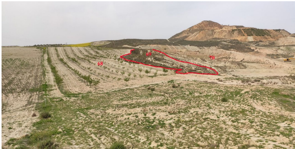
Figura 7. Vista, desde el sureste, de las parcelas 68, 69 y 70

visibilidad, medio-alto. No se han observado restos bienes o inmuebles de carácter arqueológico en su superficie.