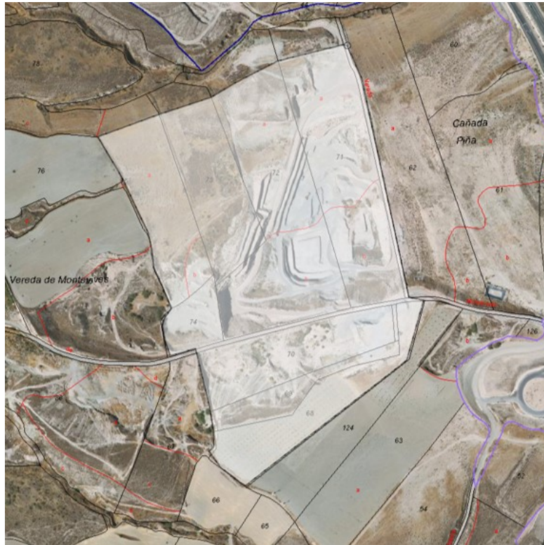
Ilustración 3. Fotografía aérea con el área de ampliación de la cantera sobre parte de la parcela 72, así como la mayoría de la 73 y 75 y la totalidad de las 74, 69 y 68