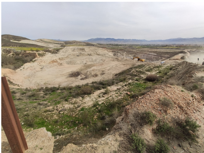
Ilustración 13. En primer plano, parcela 74, desde la vereda de Montevives. En el centro, cantera actual

Grado de visibilidad alto. No se han observado restos bienes o inmuebles de carácter arqueológico en su superficie.