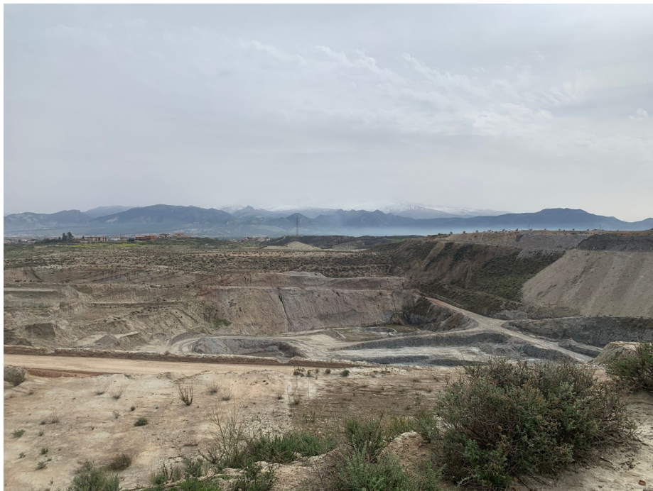
Ilustración 1. Vista de la cantera actual “Suspiros del Sur”, desde el oeste (parcela 73)

El presente informe muestra los resultados obtenidos durante la actuación arqueológica de prospección superficial llevada a cabo con motivo del proyecto de ampliación de la explotación minera Agrupación “Suspiro del Sur”, ubicada en la localidad de Alhendín (Granada), cuyo promotor es LADRILLOS SUSPIRO DEL MORO, S.L. (CIF B-18505560) ( Ilustración 1 ).