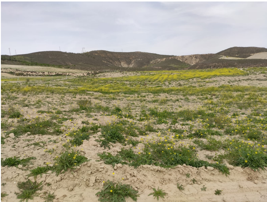
Ilustración 16. Vista, desde el sur, de la parcela 75