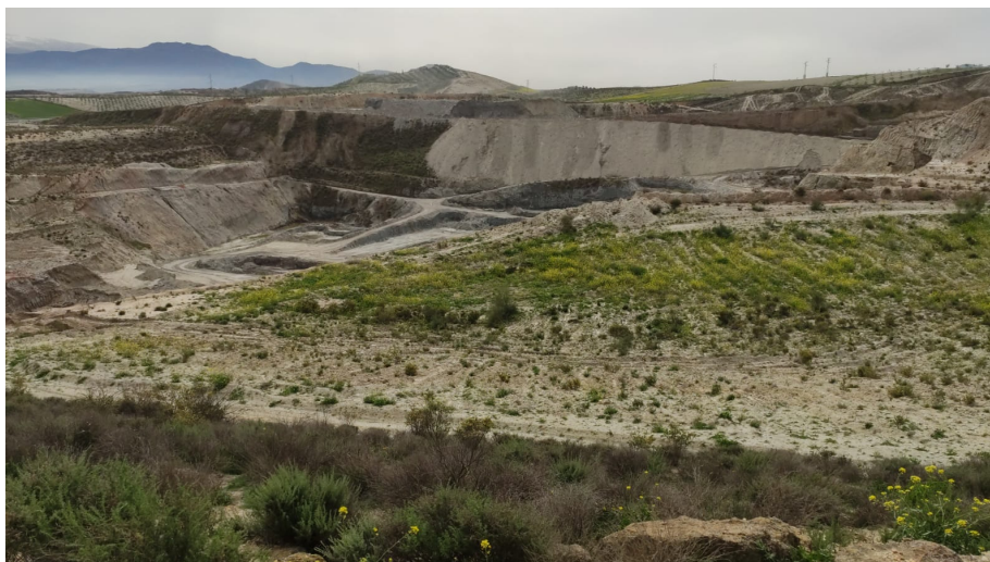
Ilustración 9. Vista, desde el norte, de la mitad septentrional de la parcela 72