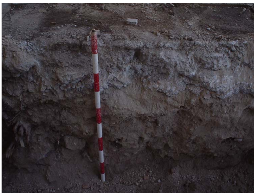
Lam. 2.- Detalle del perfil Este.