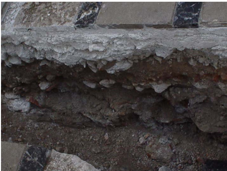
Lam. 1.-Detalle de la zanja en la que se localiza el pavimento y su preparación.