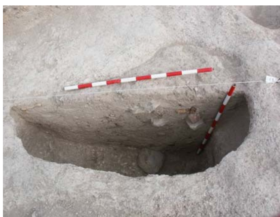
Lám. 2. C.E. 1 tras su excavación