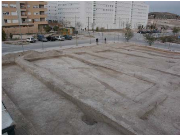
Lám 3. C.E. 2 desde el sureste.

Esta estructura forma parte del sistema de irrigación de época medieval islámica que ha sido documentado a lo largo de los trabajos de urbanización del RP 4 y SUNP 1 en los años 1995-2005.