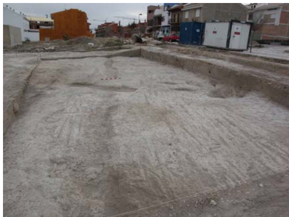
Lám. 4. C.E. 2, acequia islámica.