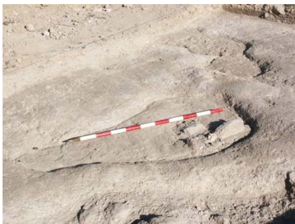
Lám. 1. C.E. 1 antes de su excavación.

Finalmente, el número 9 corresponde a un fragmento de base con ónfalo en cerámica gris, que también debe corresponder a un recipiente cerrado.