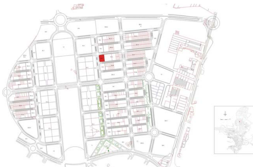
Figura 1. Situación del solar.

La parcela se encuentra en la zona de expansión norte de Jaén, dentro de la urbanización SUNP1, concretamente en la 2ª fase de esta. La parcela viene delimitada por el norte por la calle 6, por el sur por la calle 5 norte, por el oeste por la calle B. Finalmente, por el este se encuentra en el extremo de una manzana de viviendas donde, en algunos casos ya se han llevado a cabo campañas de excavación en extensión.