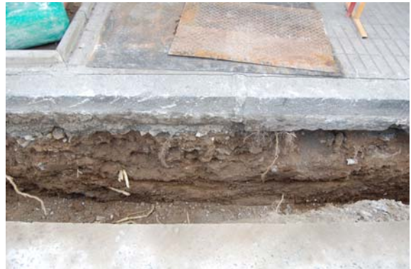
*Avenida Infante Don Fernando.