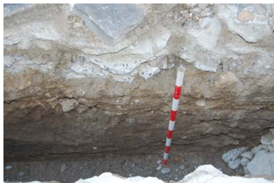
*Calle de los Claveles.