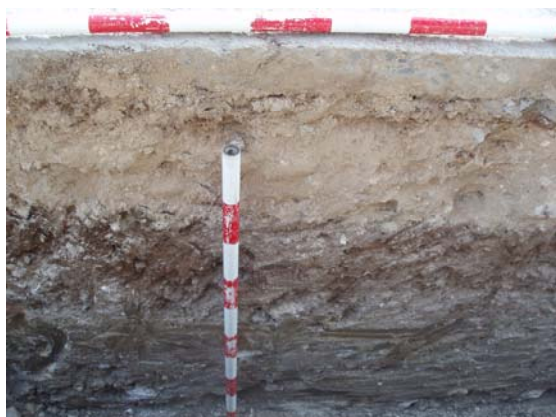
*Urbanización Santa Catalina VI.