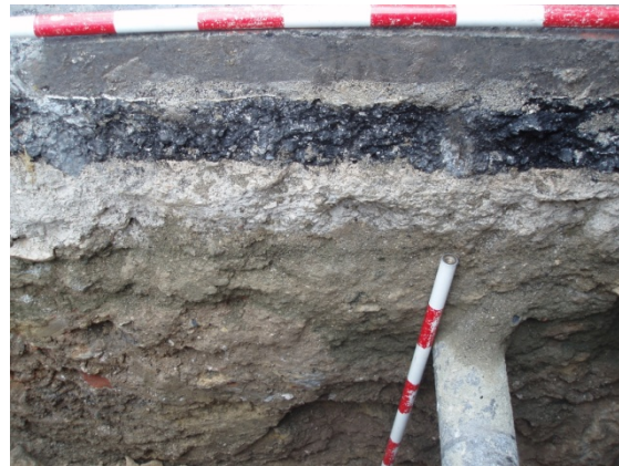
*Plaza Fernández Viagas I.