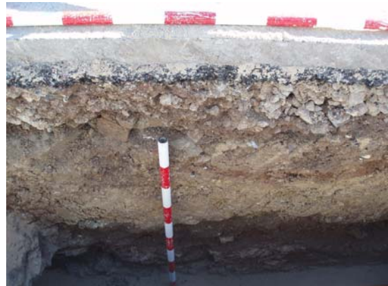
*Urbanización Nueva Andalucía III.