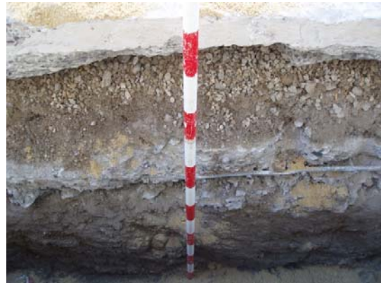
*Plaza Fernández Viagas-Cristo de los Avisos.