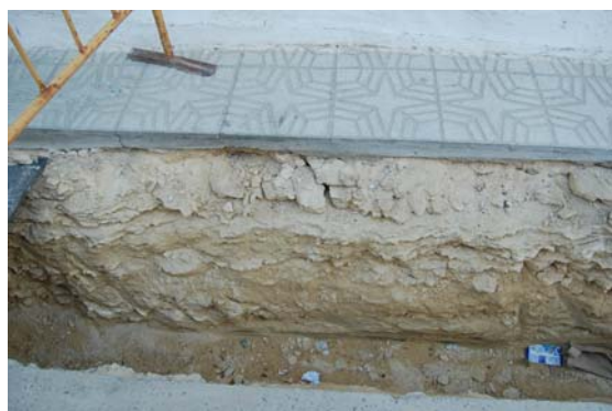
*Calle Cristo de los Avisos.