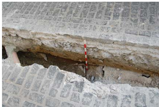
*Cuesta de los Rojos.