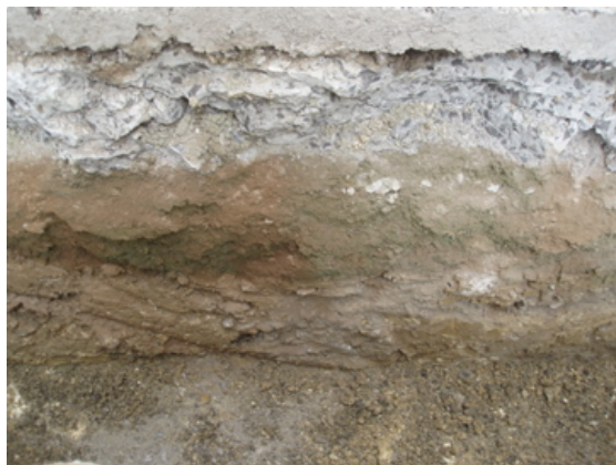
*Calle Escultor Diego Márquez.