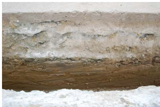
*Plaza del Carmen.