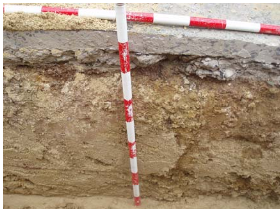
*Urbanización Santa Catalina IV.