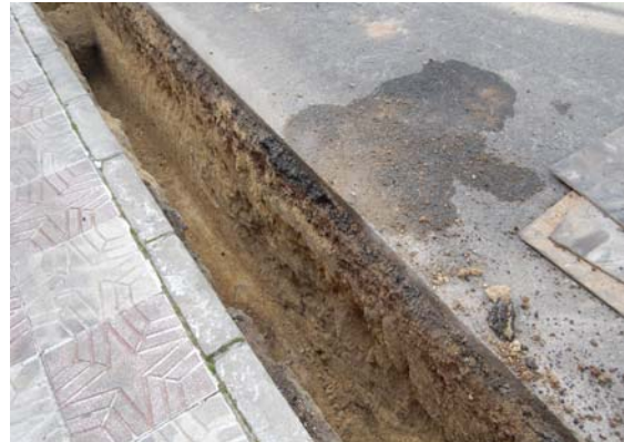
*Urbanización Nueva Andalucía II.