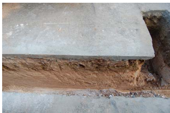
*Urbanización Santa Catalina II.