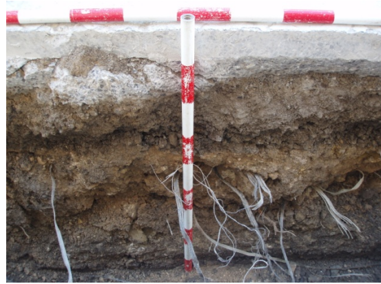
*Plaza Fernández Viagas-San Francisco.