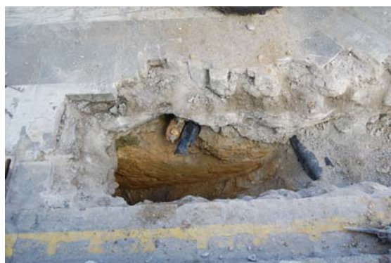
*Urbanización Santa Catalina I.