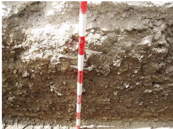
*Urbanización El Tejar.