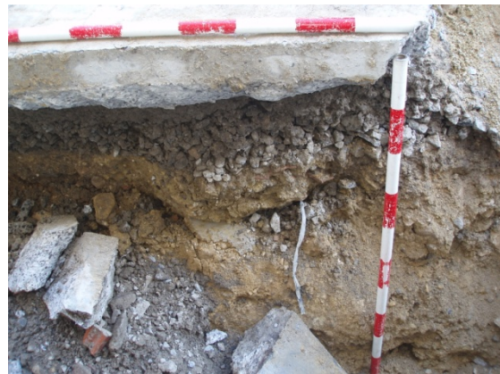
*Plaza Fernández Viagas II.