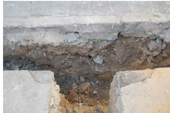
*Avenida de la Legión.