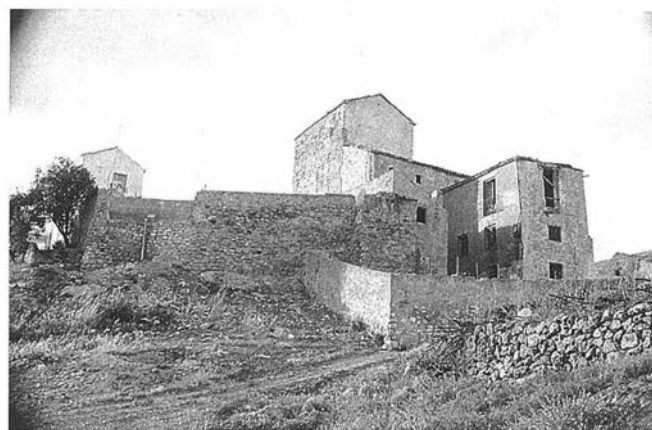
LAM. VI. Torre del Término