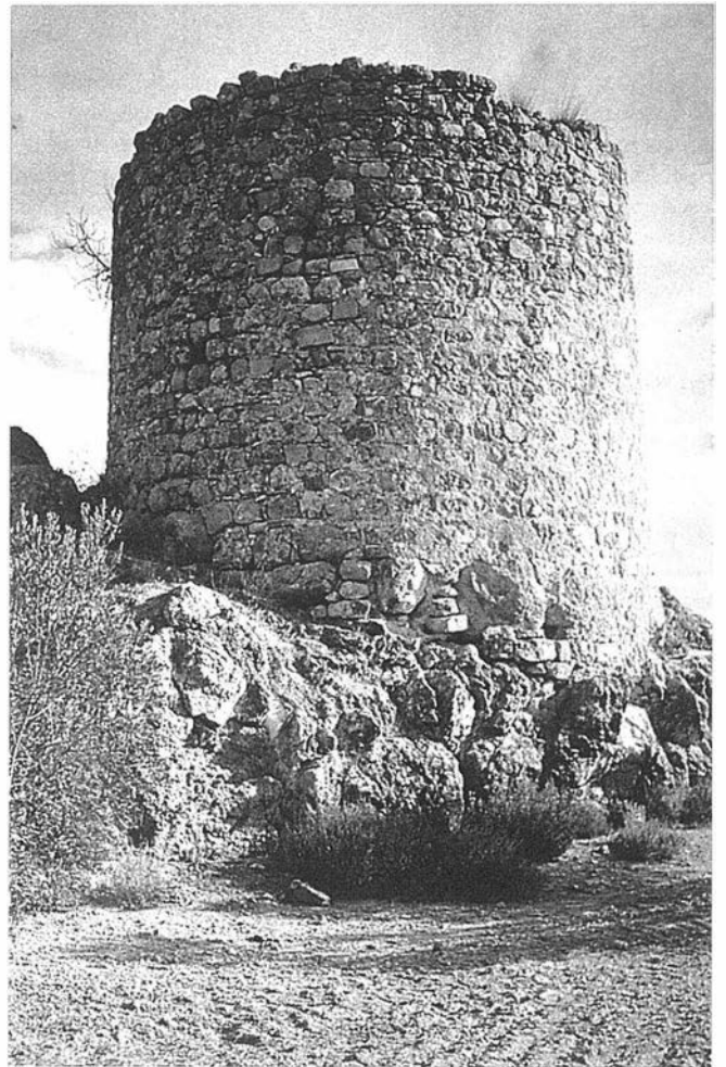
LAM. II. Torre Olvidada