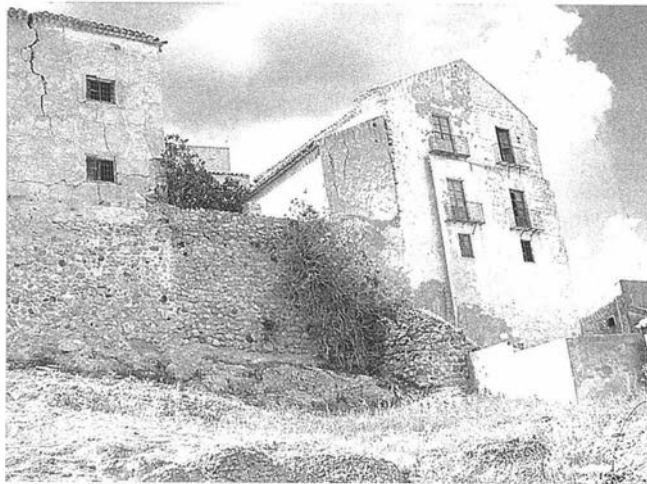
LAM. V. Asentamiento del Castil de la Peña