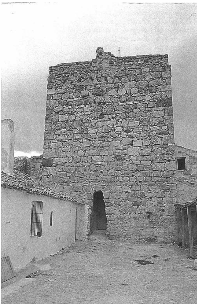
LAM. IV. Castillo de la Muña