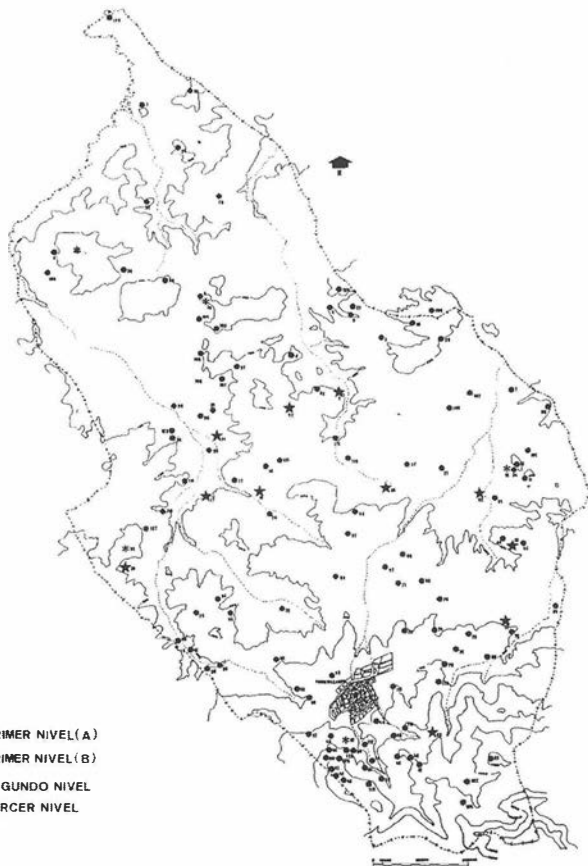
FIG. 2. Término Municipal de Torredelcampo. Yacimientos localizados catalogados según los niveles de protección