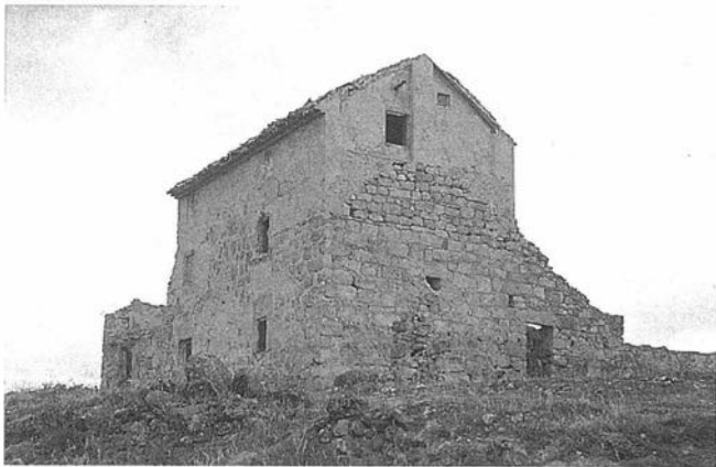
LAM. III. Yacimiento de Casa Fuerte