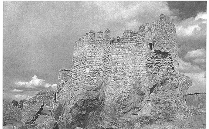
LAM. I. Castillo del Berrueco