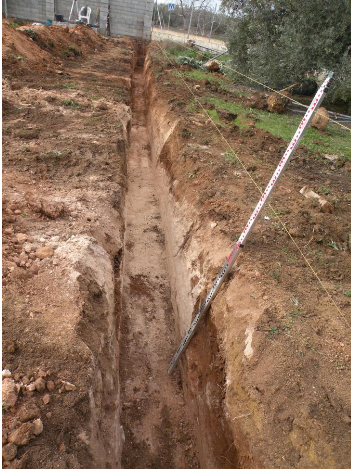
Ilustración 2. Zanja longitudinal de la parcela.

La zanja nos proporciona la sección completa de la parcela en la que podemos observar la tierra vertida para la ocupación agrícola anterior sobre lo que denominamos geológico o base geológica que aflora a cotas muy altas, por lo que los posibles niveles arqueológicos en caso de que los hubiera habido serían escasos. Al ser una secuencia completa del solar podemos destacar que en el solar se encuentran varias vetas distintas de una misma base, en una zona la base geológica presenta una textura más arcillosa y maleable equiparable a la que localizamos en unas parcelas de la misma calle, Baños de Argel 11, 12,13, mientras que aquí encontramos una veta de la misma textura pero la base geológica que nos encontramos es más compacta y sin esa textura plasticosa aunque igualmente maleable, más arenosa. Por lo que encontramos sobre la misma base geológica algunas zonas con un pregeológico, consiste en una tierra sin material formado por el mismo geológico pero con una menor consistencia.