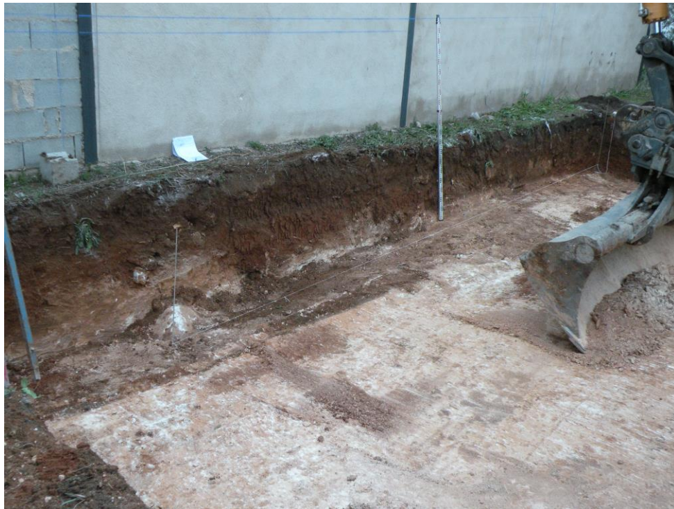
Ilustración 3. Perfil Este de la zona de la piscina.

El resto del control de movimientos de tierra se llevo a cabo en la zona de la piscina, con unas dimensiones de 8 m por 4, bajando unos 80 cm aproximadamente. Se localiza la base geológica en toda la planta. Las unidades documentadas son la U.E 1 en toda la planta, la U.E 3 pregeológico en algunas zonas y la U.E 4 en toda la planta.