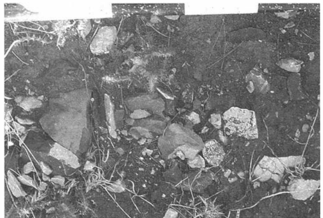
FOTO. 5. La tumba dolménica del Km 23'5, en su estado 1989 tras los saqueos de 1987.

FOTO. 4. Gran núcleo de crestas y restos de talla insituen el taller de El Chorrito-1 .