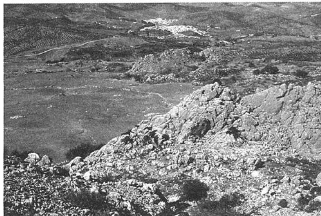
FOTO. 1. Panorámica del taller de sílex de El Chorrito, al fondo la Villa de El Burgo.