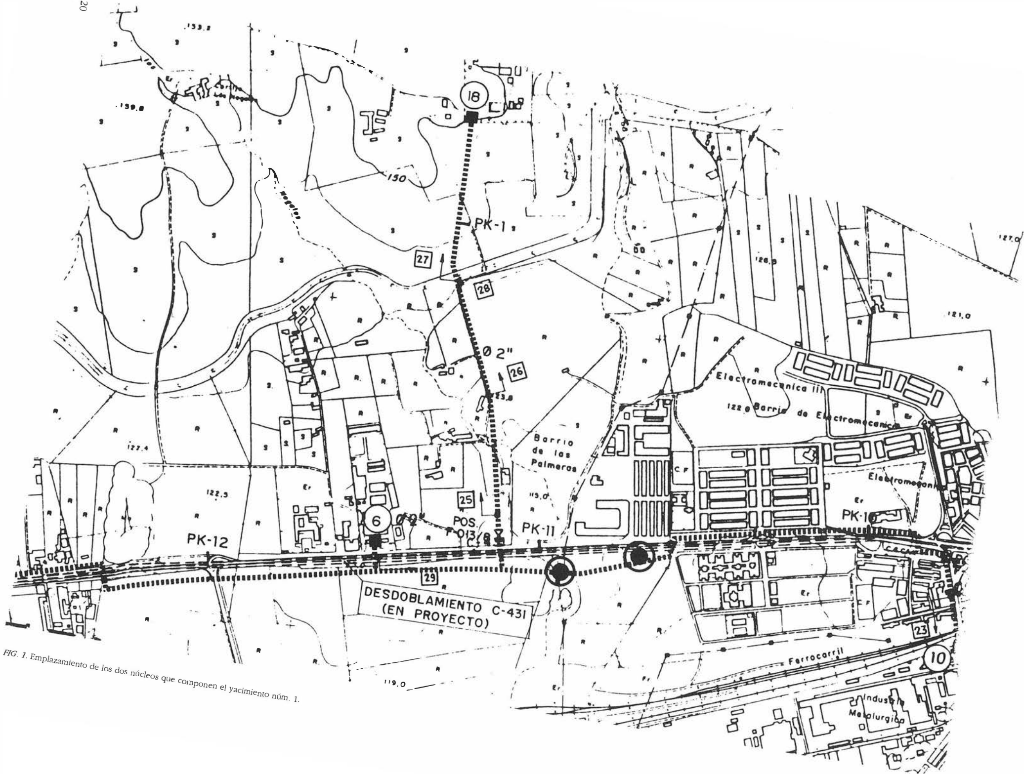
FIG. 1. Emplazamiento de los dos núcleos que componen el yacimiento núm. 1.