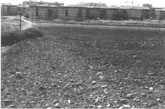
LAM. V. En primer plano los terrenos del yacimiento núm. 5 por los que discurría el trazado de la red de gas.

Sur del Barrio de Las Palmeras e inmediatamente a la izquierda de la carretera comarcal 431 de Córdoba a Palma del Río (Fig. 1).