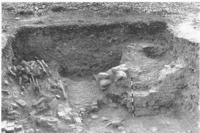
LAM. 2. Corte 1. LAM. 3. Corte 2.

ladrillo, con una anchura aproximada de 50 centímetros el muro Este y 90 centímetros el muro Sur. Bajo estos muros se encuentra la cimentación del edificio, formada por grandes piedras y con una anchura de unos 80 centímetros aproximadamente. En el interior de la habitación se ha documentado un nivel de incendio. Hasta este nivel, básicamente, nos encontramos con idéntica estratigrafía y material cerámico que en los Cortes 1 y 2.