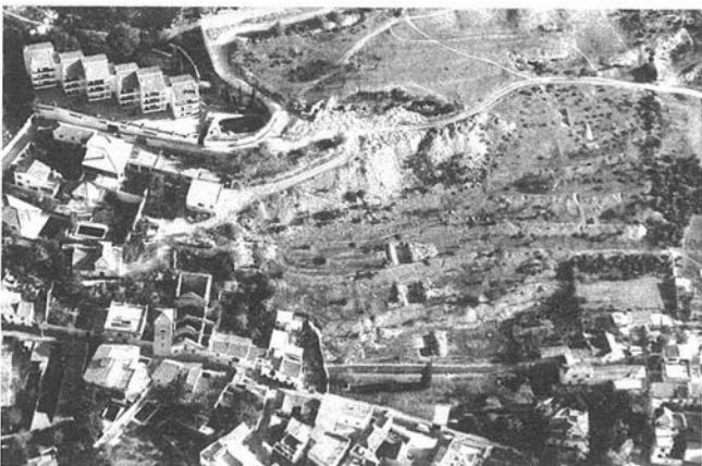
LAM. 1. Vista general.

revestido con yeso. Al Sur de esta habitación y continuando con el muro de dirección Norte-Sur, aparece otra pequeña dependencia con una anchura de 1,10 metros, la cual se soporta sobre la lastra. Presenta un piso de ladrillos muy deteriorados y en parte perdidos. Siguiendo hacia el Sur, otro nuevo escalón y otra pequeña dependencia de iguales características que la anterior y con una anchura de 1,20 metros. Como en el caso anterior, los ladrillos pueden estar en dirección Norte-Sur o Este-Oeste, dichos ladrillos tienen unas dimensiones de 28 x 14 centímetros. Más al Sur otro nuevo escalón y otra nueva dependencia de anchura 1,10 metros y de iguales características, con la salvedad de su lado Oeste, donde se dan grandes ladrillos de 32 x 28 centímetros y con dirección Noroeste-sudeste. Por último y más al Sur, otra pequeña dependencia, la cual no podemos delimitar, en ésta han desaparecido los ladrillos y sólo queda la lastra.