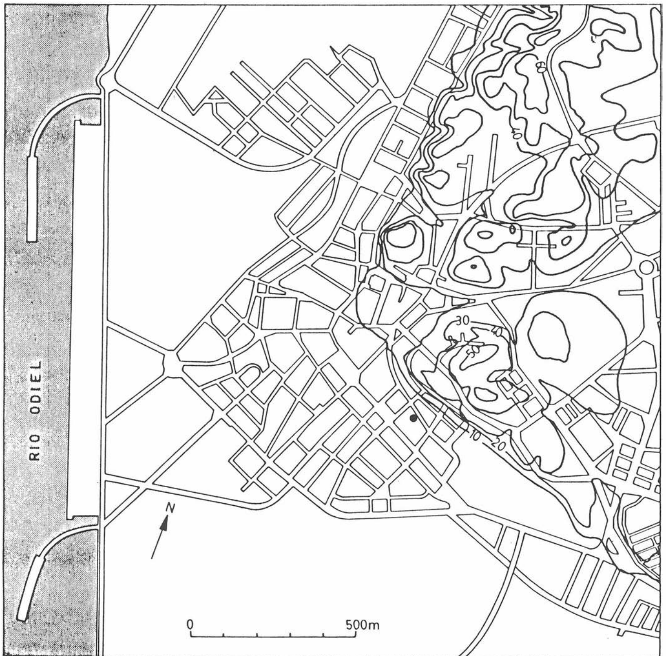
FIG. 1. Localización de la excavación.

mente en el mismo y sin criterios preestablecidos, ya que la configuración topográfica del lugar y su relación con las marismas y el estuario del Tinto-Odiel, donde incide notablemente la influencia de las mareas, ha condicionado históricamente y aún lo hace, la distribución del poblamiento, de ahí que no deba sorprender excesivamente el que a escasa distancia de un lugar arqueológicamente estéril encontremos una zona de indudable interés arqueológico.