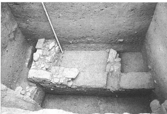
LAM. 1. Estructuras de la excavación. LAM. 2. Alzado de las Estructuras 1 y 3.

Con una potencia entre 0,45 y 0,60 m, formado por una tierra de color más claro, amarillento, con manchas grises producto de la