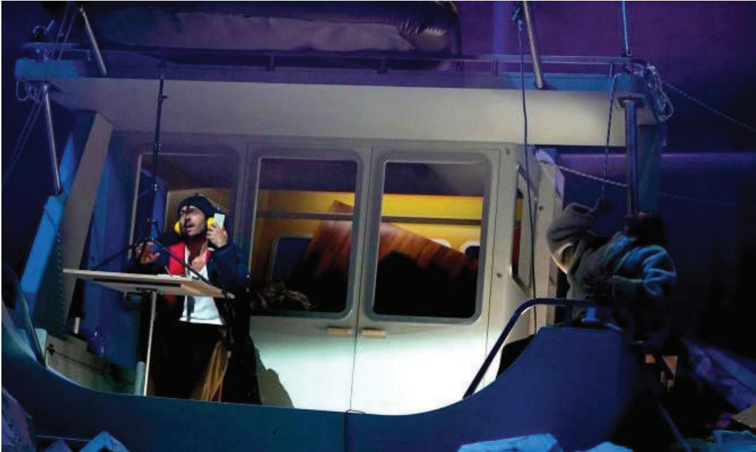
Imagen de la obra.